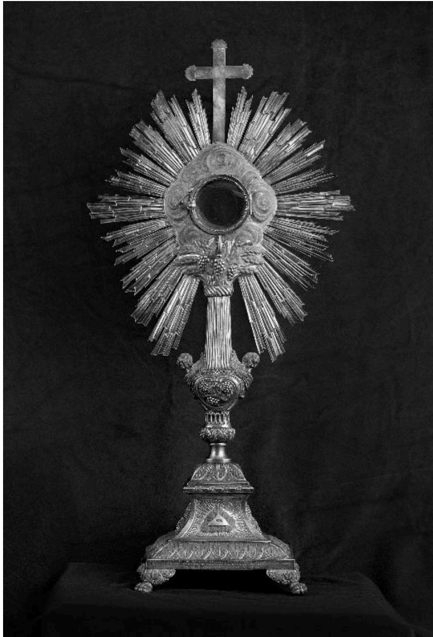
Vue générale du revers de l'ostensoir.