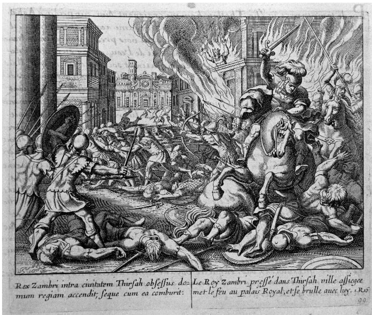
Ancien Testament, Le Livre des Rois (chapitre 16) : La mort du roi Zambri.