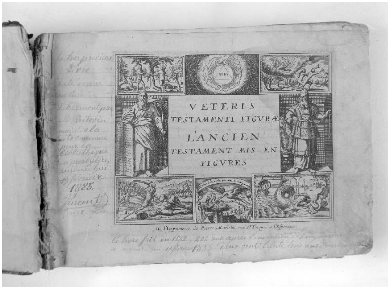
Vue de la page du titre de l'Ancien Testament.