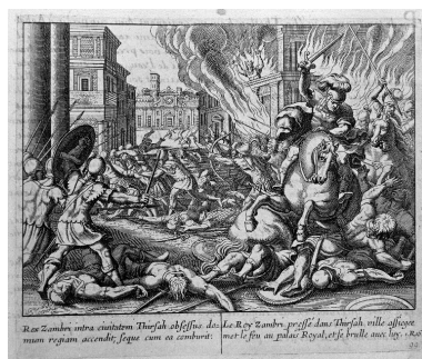
Ancien Testament, Le Livre des Rois (chapitre 16) : La mort du roi Zambri.