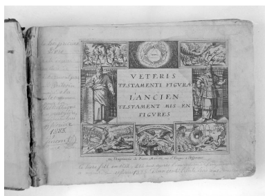
Vue de la page du titre de l'Ancien Testament. IVR22_19966002480X