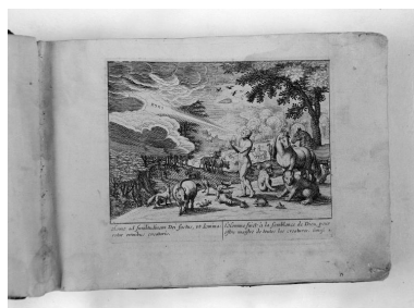
Vue d'une scène de la Genèse : l'homme maître des animaux. IVR22_19966002481X