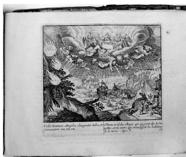
Apocalypse 8 : Vision de saint Jean.