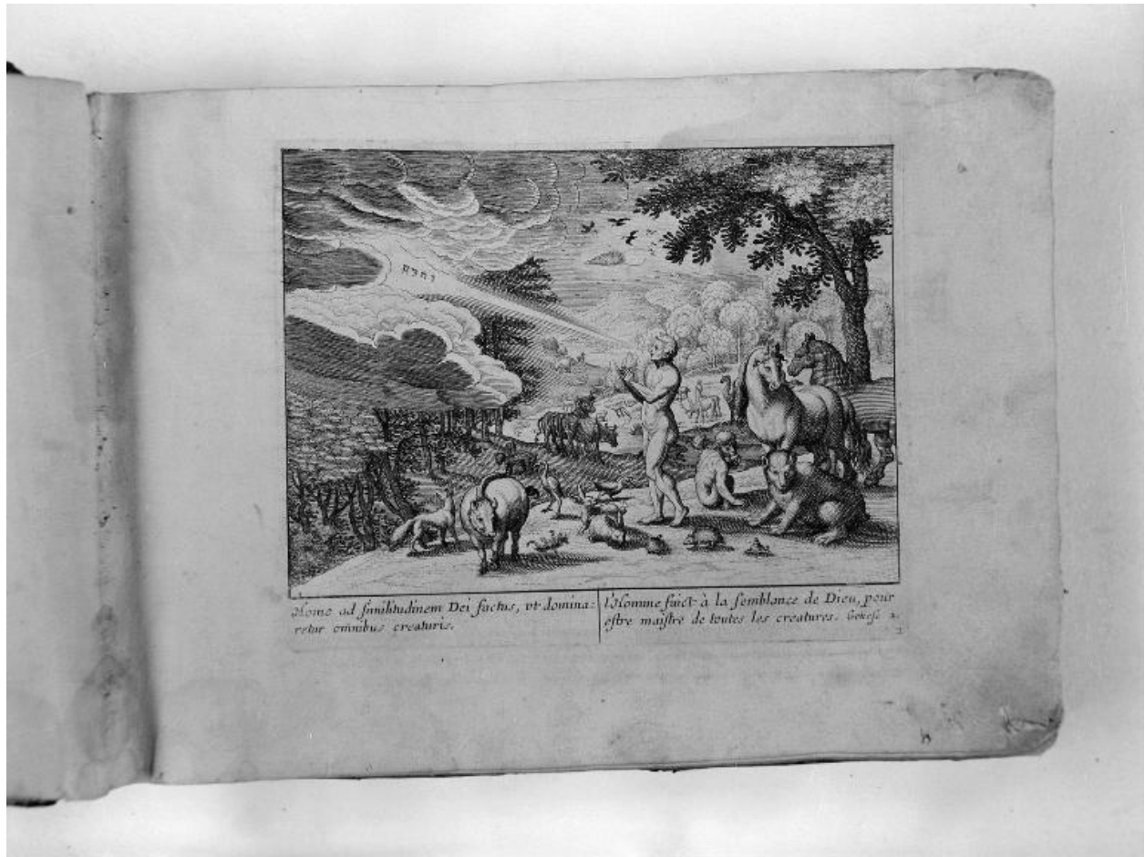
Vue d'une scène de la Genèse : l'homme maître des animaux.