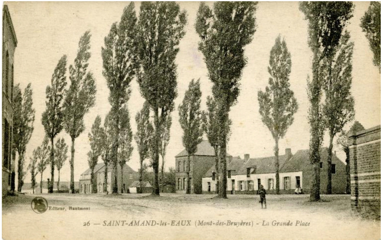
Hameau du Mont des Bruyères ; la place, carte postale sans date (début du 20e siècle ?).