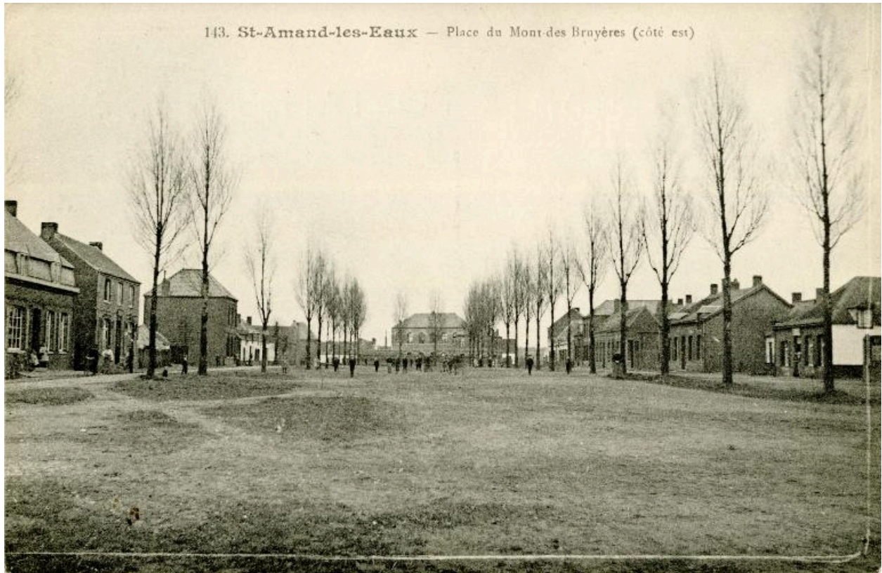
Hameau du Mont des Bruyères ; la place vers l'ouest, carte postale sans date (début du 20e siècle ?) (Médiathèque de Saint-Amand-les-Eaux).