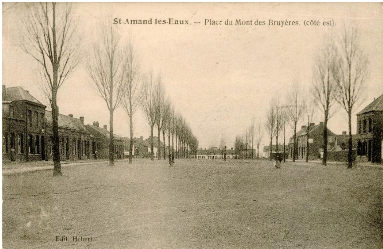
Hameau du Mont des Bruyères ; la place vers l'est, carte postale sans date (début du 20e siècle ?).