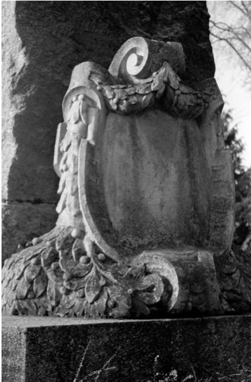
Cartouche placé au revers du monument.