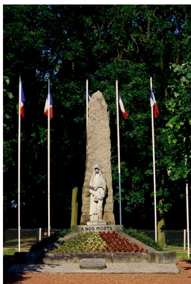
Vue générale. IVR22_19948000506ZA