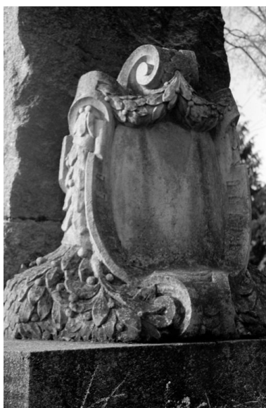
Cartouche placé au revers du monument.