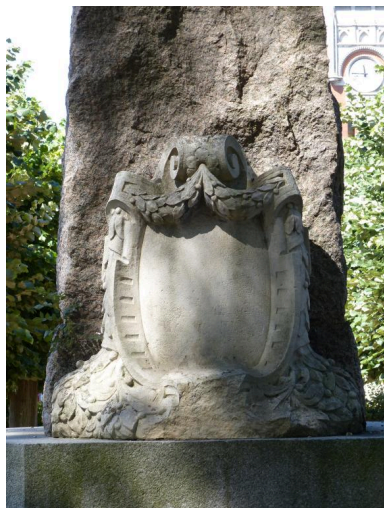
Le cartouche placé à l'arrière du monument. IVR32_20208005241NUCA