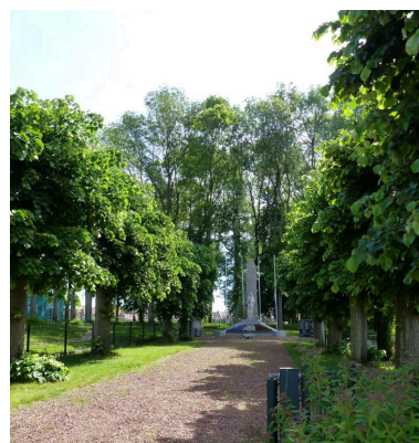
Vue de situation. IVR32_20208005035NUCA