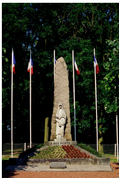
Vue générale. IVR22_19948000506ZA