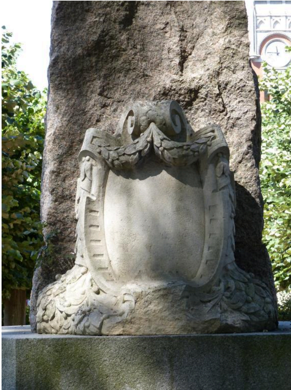
Le cartouche placé à l'arrière du monument.