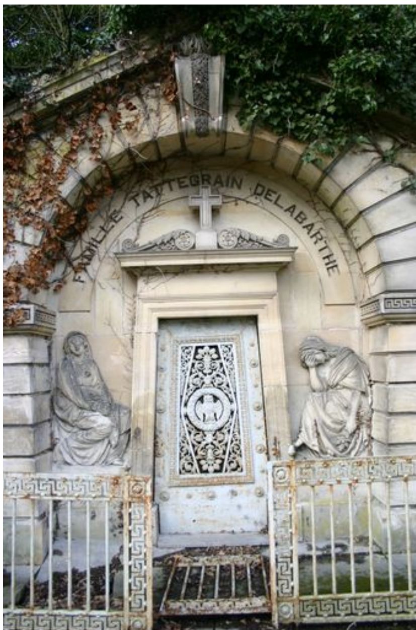
Vue rapprochée de la façade sculptée du tombeau-chapelle.