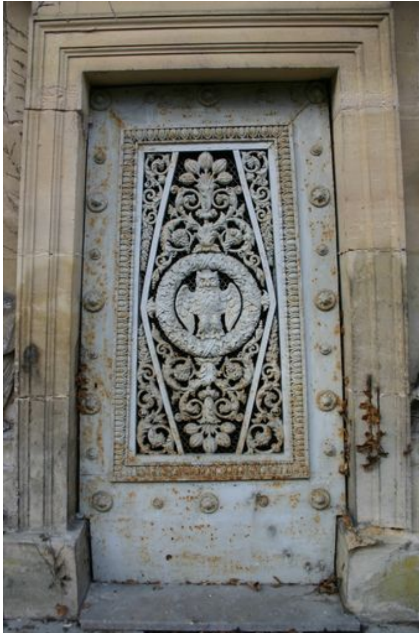
Détail de la porte trapézoïdale en fonte ouvragée et moulée.