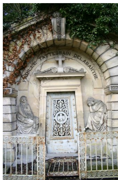
Vue rapprochée de la façade sculptée du tombeau-chapelle.