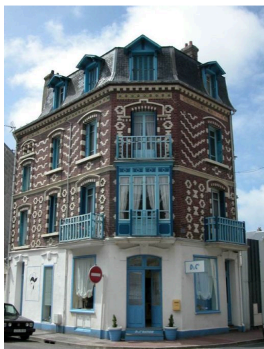
Vue d'ensemble. IVR22_20038005237NUCA