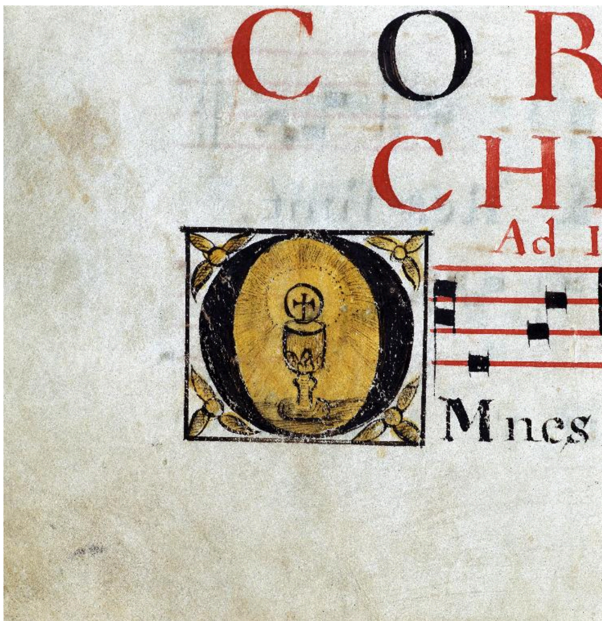
Détail de la page 90 : lettre O enluminée avec un calice et une hostie.