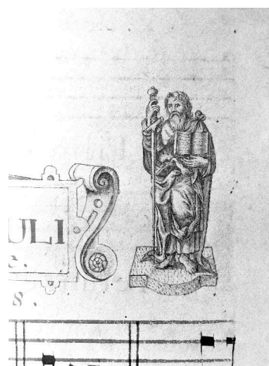
Détail de la page 146 : petit dessin représentant saint Paul.