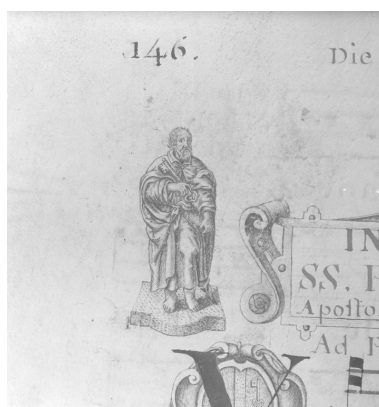
Détail de la page 146 : petit dessin représentant saint Pierre. IVR22_19966003582X