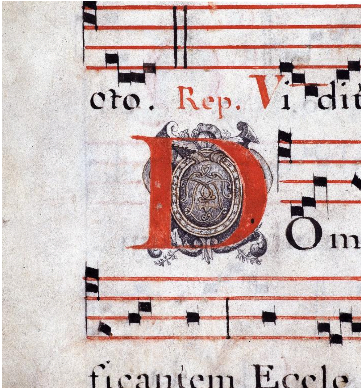
Détail de la page 146 : lettre D avec un cuir enroulé.