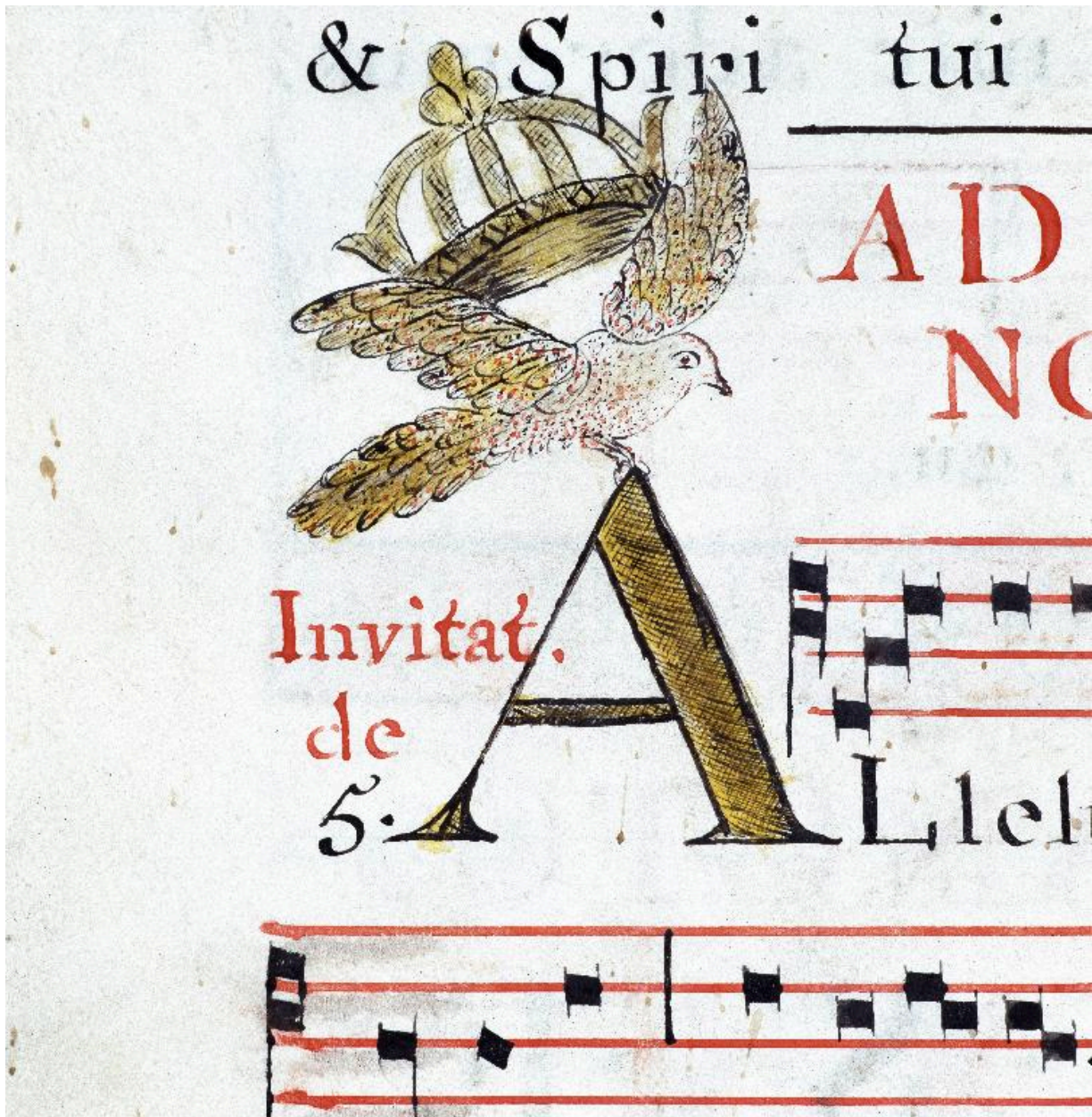
Détail de la page 82 : lettre A enluminée avec une colombe et une couronne.