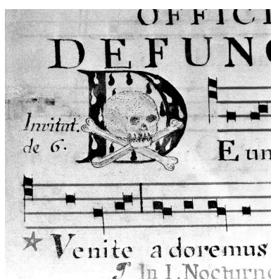
Détail de la page 24 (début de l'officium defunctorum) : lettre D enluminée avec une tête de mort.