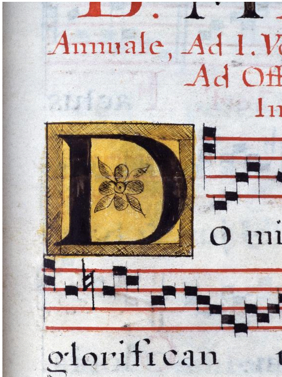
Détail de la page 165 : lettre D enluminée dans un cadre doré