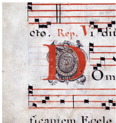
Détail de la page 146 : lettre D avec un cuir enroulé. IVR22_19966003613XA