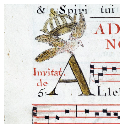
Détail de la page 82 : lettre A enluminée avec une colombe et une couronne. IVR22_19966003616XA