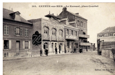
Façade postérieure sur la rue du Général-Leclerc, carte postale, 1er quart 20e siècle (coll. part.). IVR22_20058000439XAB