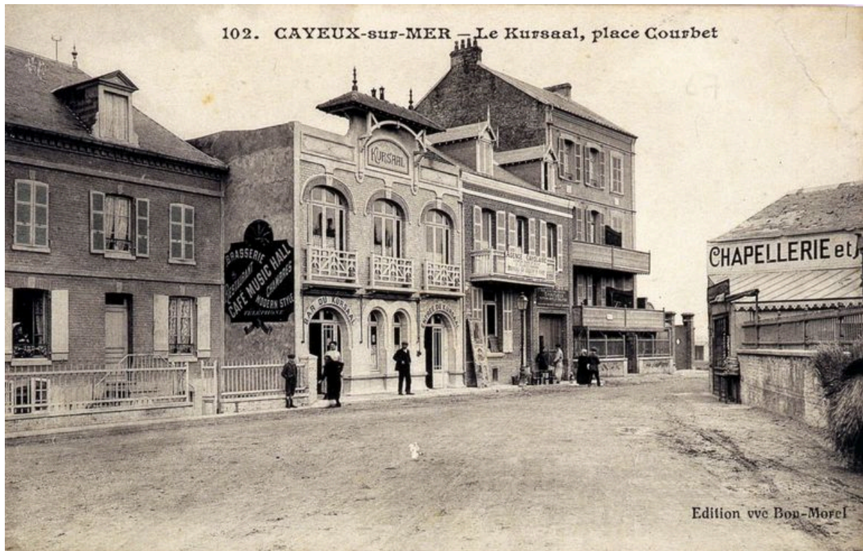
Façade postérieure sur la rue du Général-Leclerc, carte postale, 1er quart 20e siècle (coll. part.).