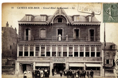
L'ancien Kursaal avec sa terrasse couverte, carte postale, 1er quart 20e siècle (coll. part.). IVR22_20058000460XAB