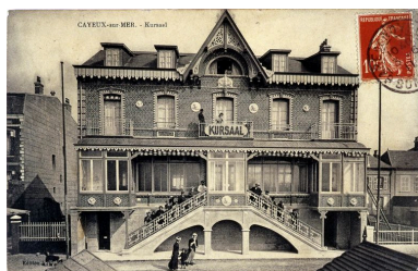
L'ancien Kursaal, carte postale, 1er quart 20e siècle (coll. part.). IVR22_20058000459XAB