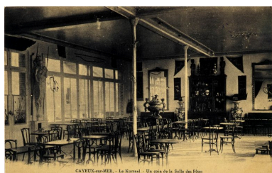
Intérieur du Kursaal, carte postale, 1er quart 20e siècle (coll. part.). IVR22_20058000456XAB