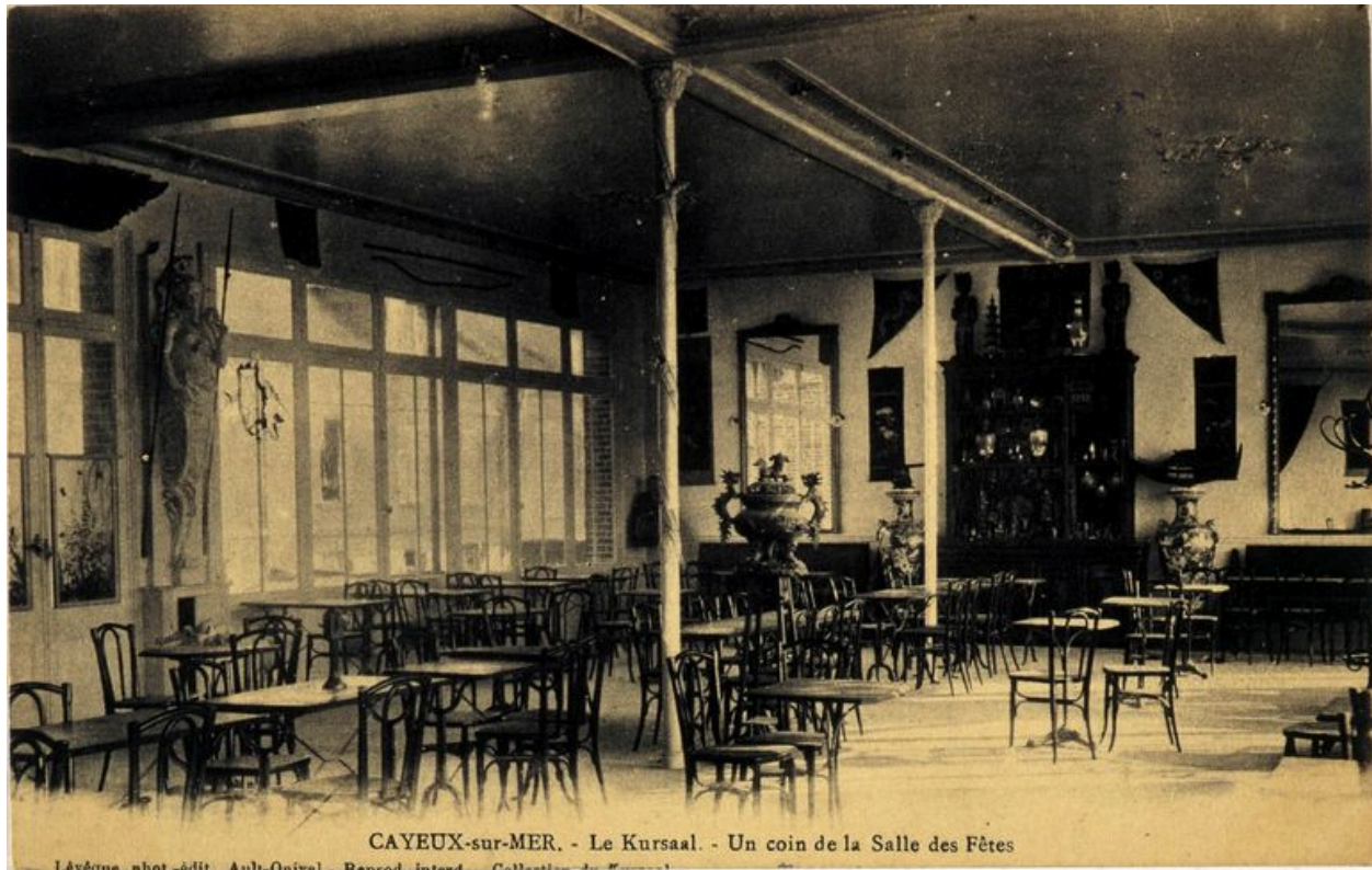
CAYEUX-sur-MER. - Le Kursaal. - Un coin de la Salle des Fêtes

L'événement, photo-édité, Aulx-Quival, Bannod, inter, Collection de Cayeux-sur-Mer