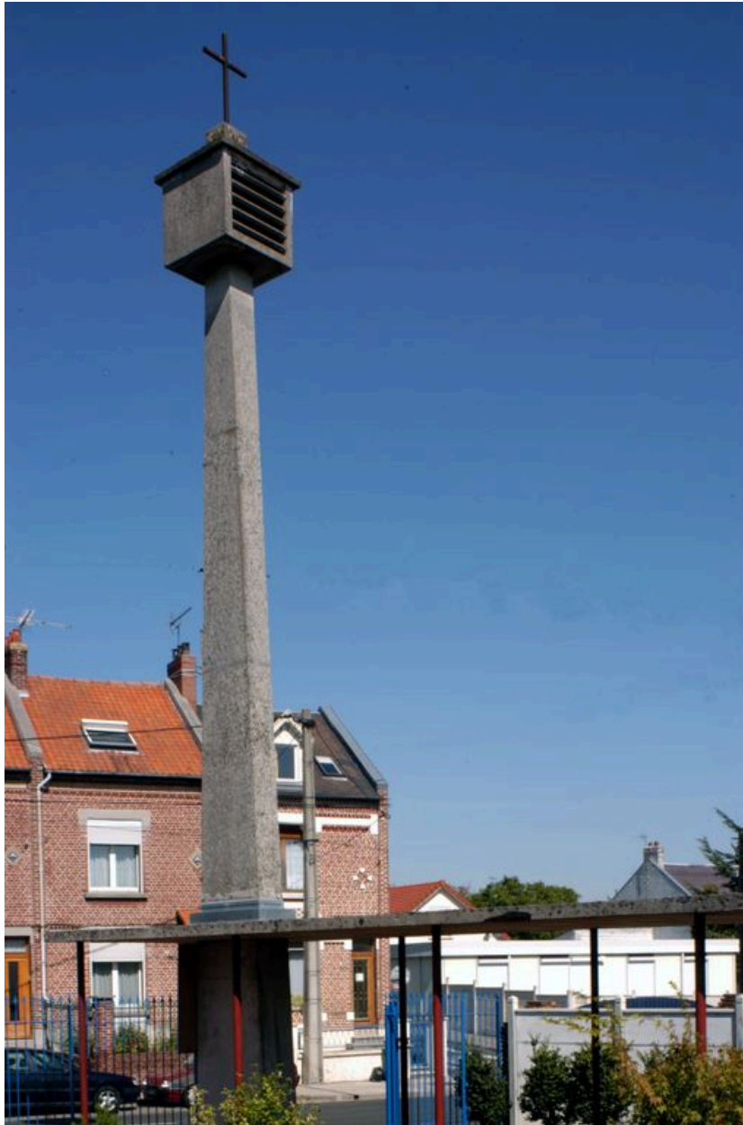
Vue du clocher.