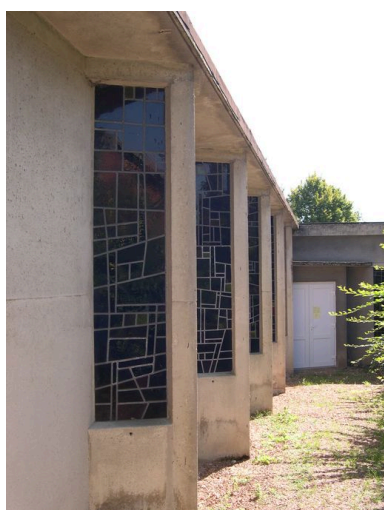
Vue des fenêtres de la façade ouest, depuis le nord. IVR22_20038011014NUCA