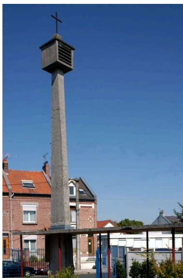
Vue du clocher. IVR22_20038000916NUCA