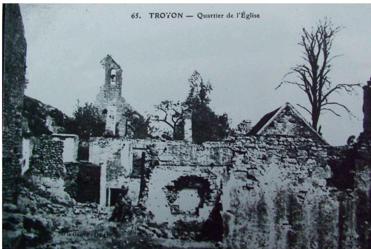
Vue du quartier de l'église au hameau de Troyon pendant les conflits.