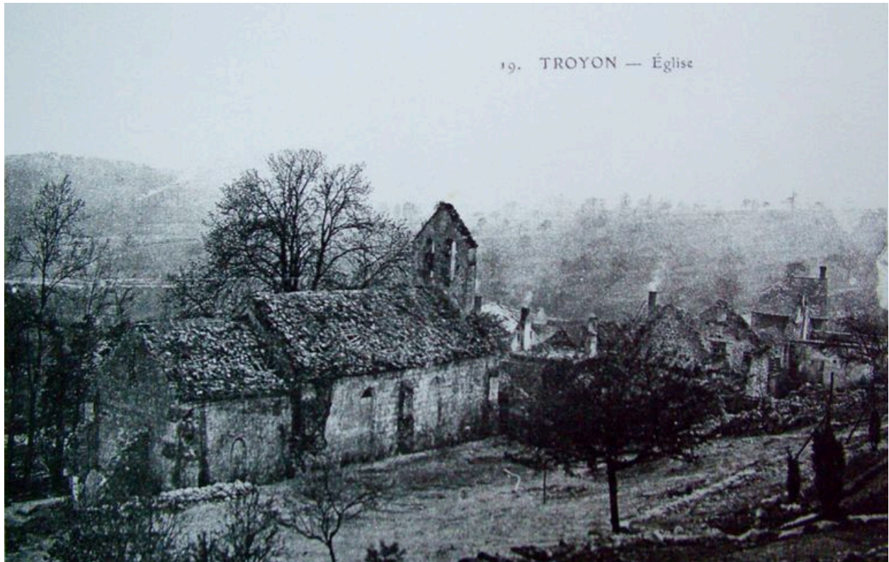
Vue de l'église du hameau de Troyon avant la guerre.