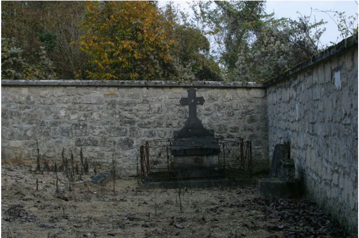
Vue de ce qu'il reste du hameau de Troyon.