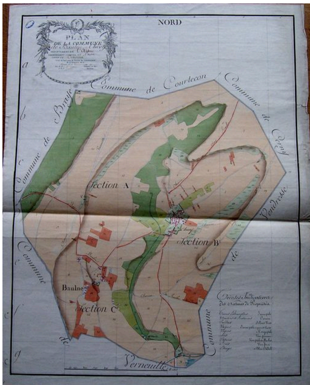
Plan cadastral de Baulne et Chivy établi le 5 octobre 1805 (AN : F 31/107).