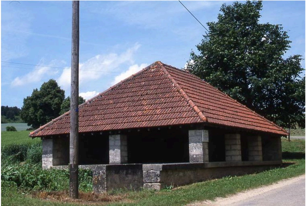
Vue du lavoir situé dans le bas du village.