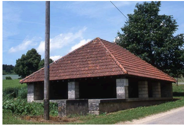
Vue du lavoir situé dans le bas du village.