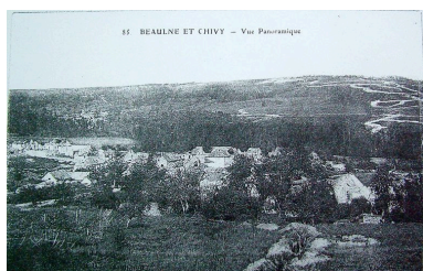
Vue panoramique du hameau de Beaulne-et-Chivy avant la guerre (coll. part).