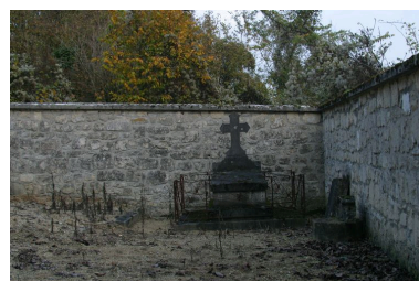
Vue de ce qu'il reste du hameau de Troyon.