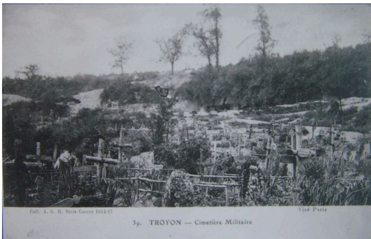
Vue du cimetière provisoire à l'emplacement du hameau de Troyon (coll. part).