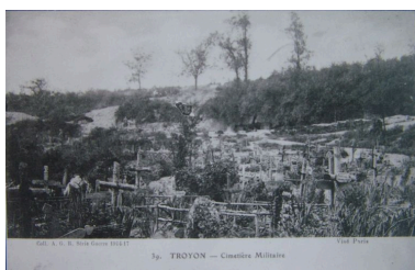
Vue du cimetière provisoire à l'emplacement du hameau de Troyon (coll. part).