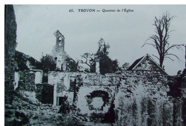
Vue du quartier de l'église au hameau de Troyon pendant les conflits.