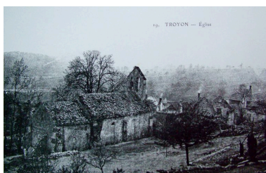
Vue de l'église du hameau de Troyon avant la guerre.