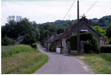
Vue du hameau de Beaulne. IVR22_20030203255NUCA