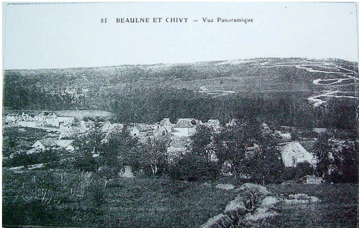
Vue panoramique du hameau de Beaulne-et-Chivy avant la guerre (coll. part).