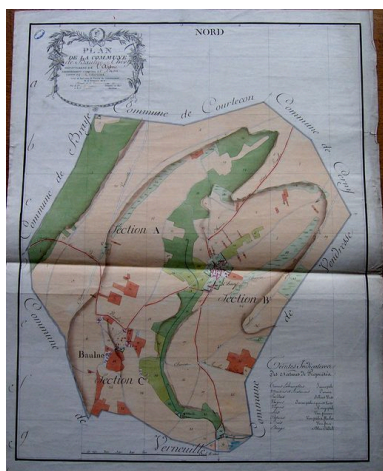
Plan cadastral de Baulne et Chivy établi le 5 octobre 1805 (AN : F 31/107).