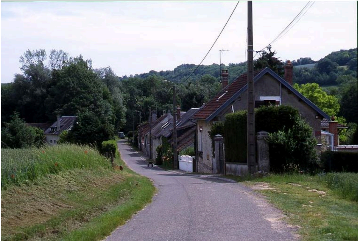
Vue du hameau de Beaulne.