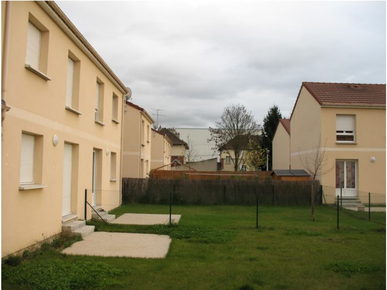
Maisons individuelles construites à l'emplacement des barres.