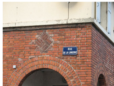
Détail de la mise en oeuvre des briques.