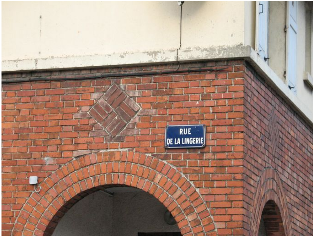
Détail de la mise en oeuvre des briques.