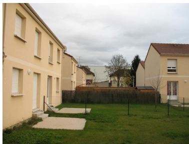
Maisons individuelles construites à l'emplacement des barres. IVR22_20076005219NUCA