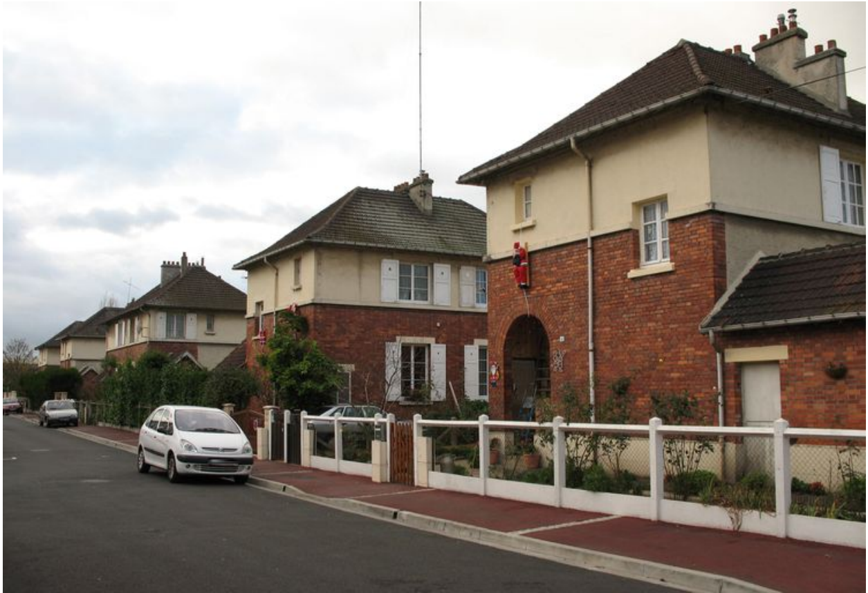
Maisons individuelles de la cité de la Lingerie.