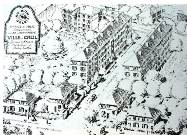
Vue cavalière de la cité de la Lingerie après sa construction (AC Creil).