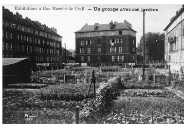
La cité de la Lingerie est composée jusqu'au début des années 2000 de logements collectifs en barre et de maisons individuelles (AP).