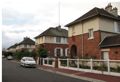
Maisons individuelles de la cité de la Lingerie.