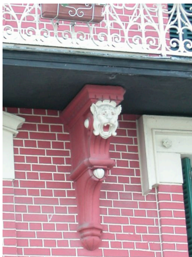
Détail de la tête de lion ornant la console du balcon. IVR22_20058002892NUCA