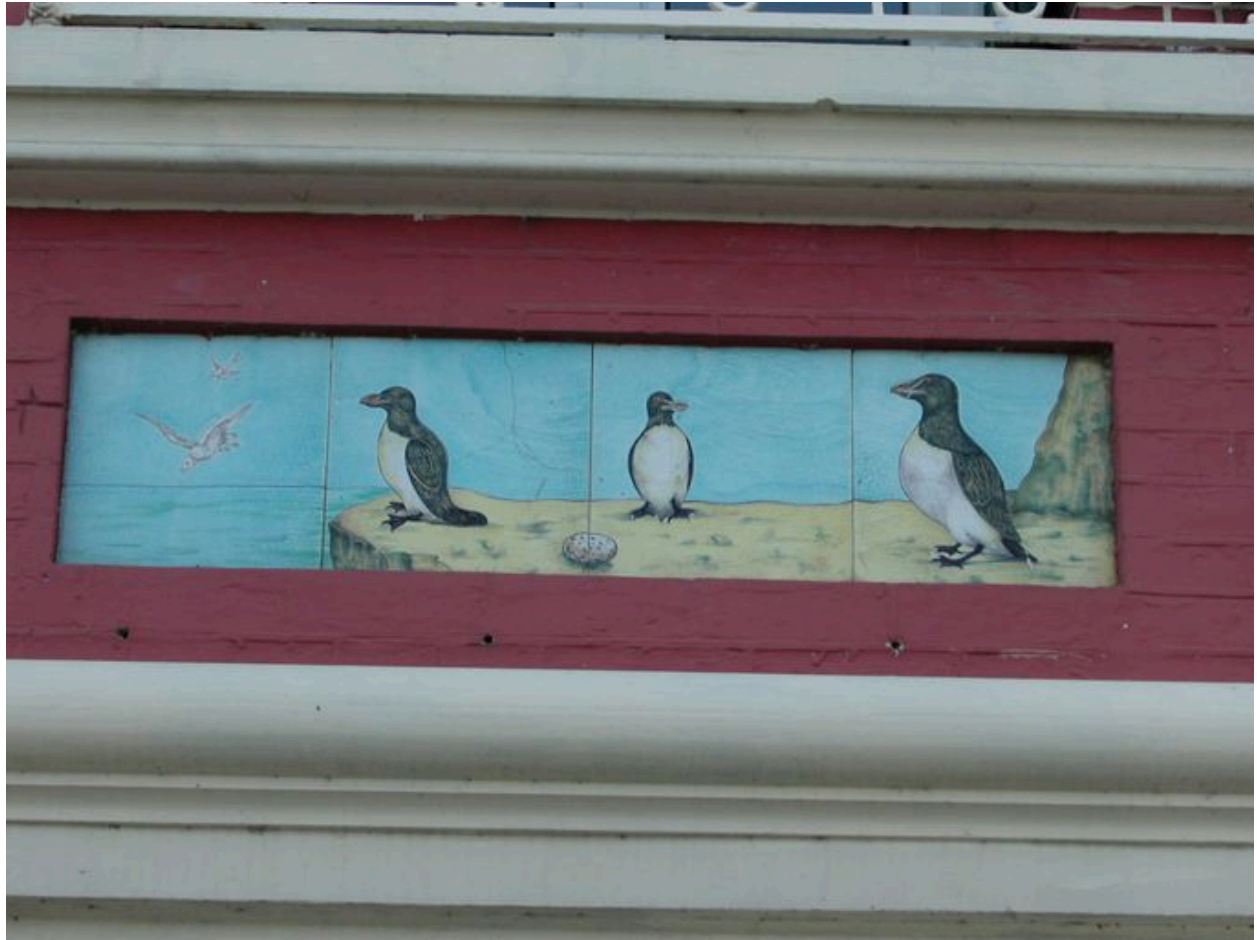
Détail des carreaux de céramique récents (quatrième panneau en partant de gauche).