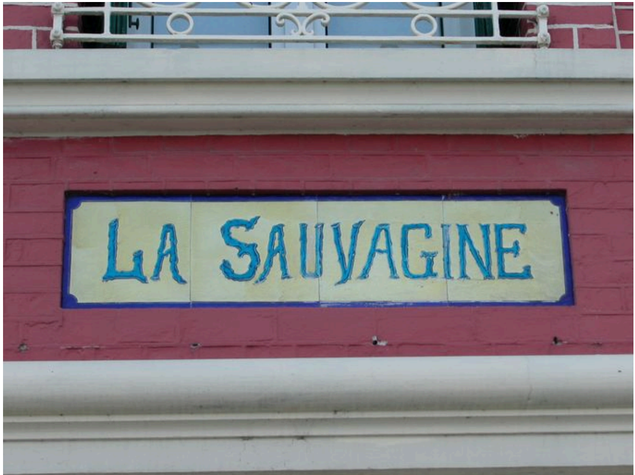
Détail des carreaux de céramique portant appellation (troisième panneau en partant de gauche).