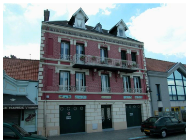
Vue d'ensemble. IVR22_20058002891NUCA