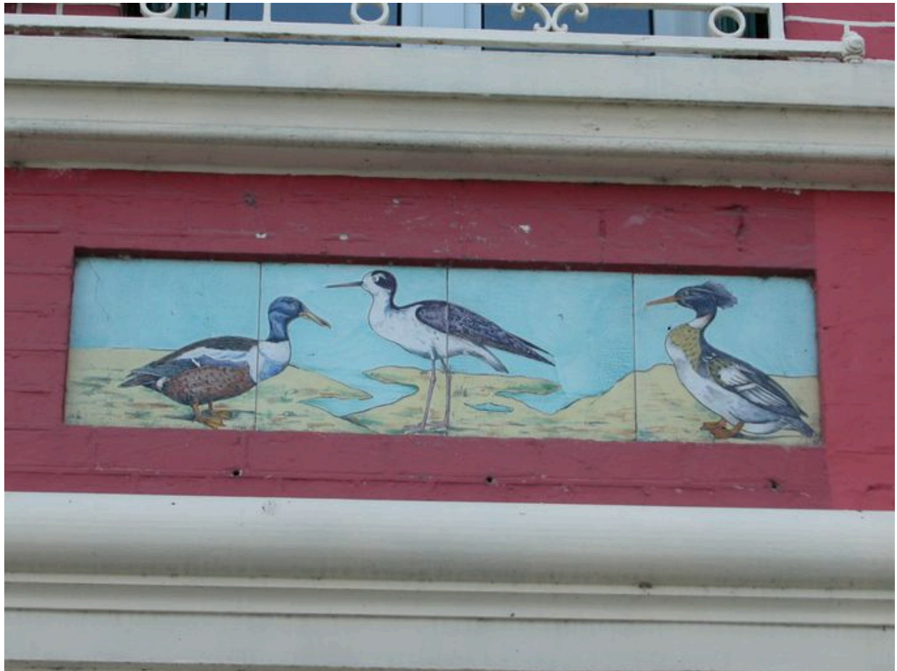
Détail des carreaux de céramique récents (cinquième panneau en partant de gauche).