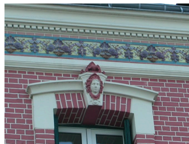
Détail de la tête de femme ornant la clé d'une baie.