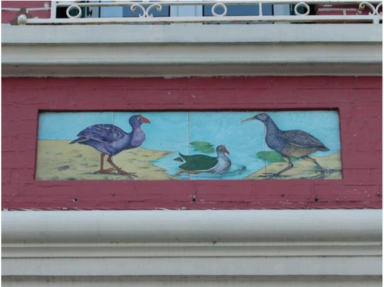
Détail des carreaux de céramique récents (premier panneau en partant de gauche).