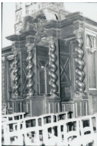
Vue générale, bas-côté nord