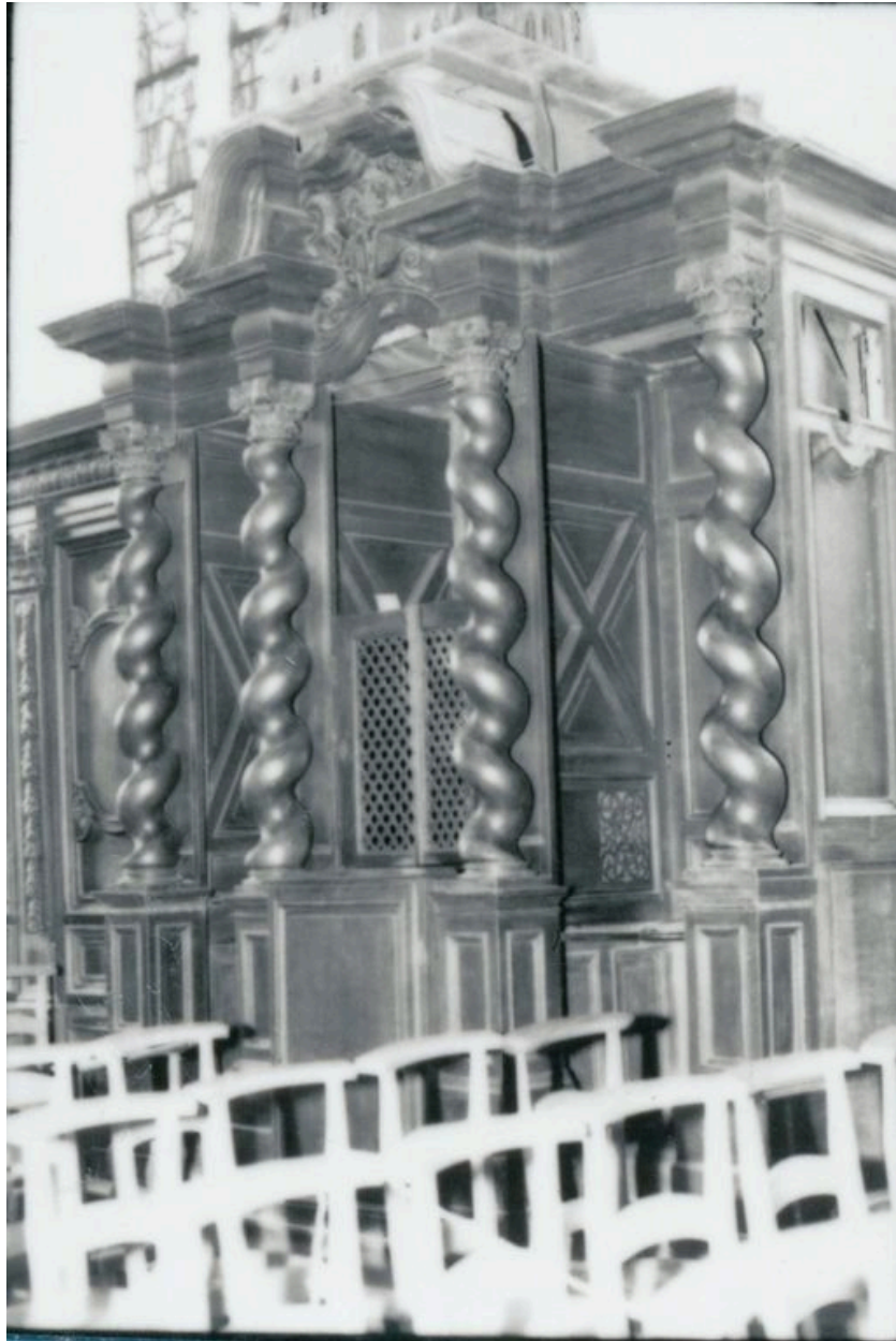
Vue générale, bas-côté nord