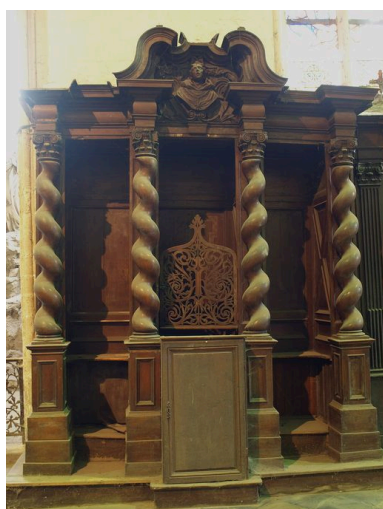
Confessionnal du bas-côté sud