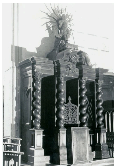
Vue générale, bas-côté-sud