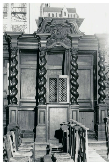
Vue générale, bas-côté nord IVR31_20106201846NUC