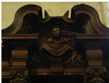
Vue de détail, saint Augustin IVR31_20106201839NUCA