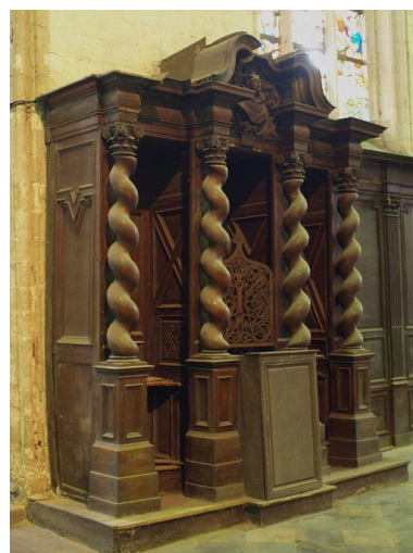
Vue latérale IVR31_20106201836NUCA