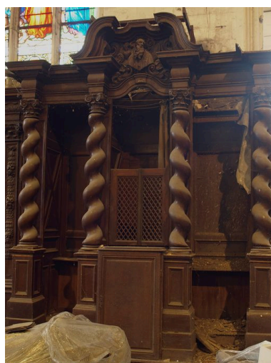
Confessionnal du bas-côté nord