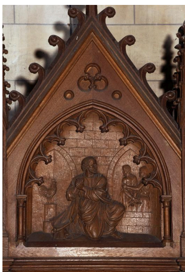
Bas-relief du fronton du confessionnal du bras nord : Reniement et repentir de saint Pierre.

Phot. Marie-Laure Monnehay-Vulliet IVR22_20138000305NUC2A