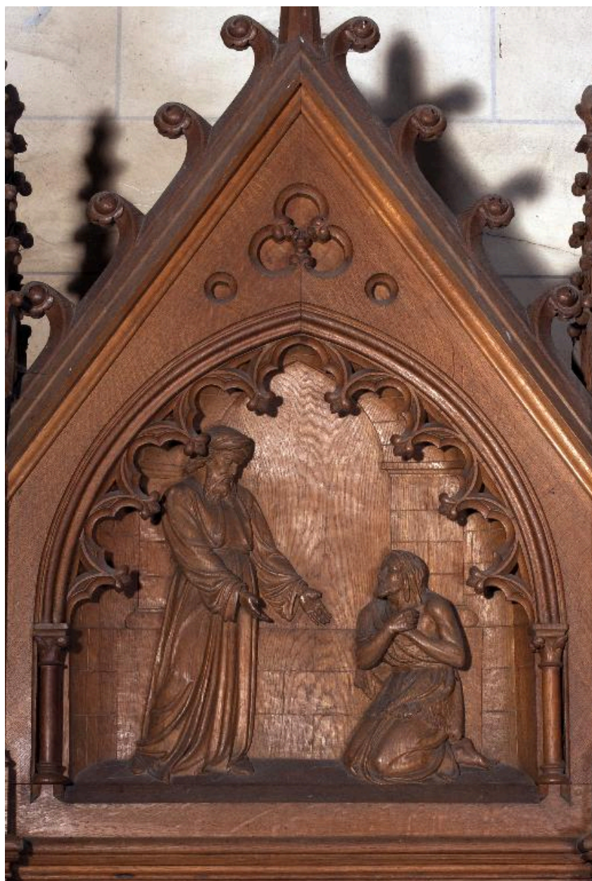
Bas-relief du fronton du confessionnal du bras sud : le Retour du fils prodigue.