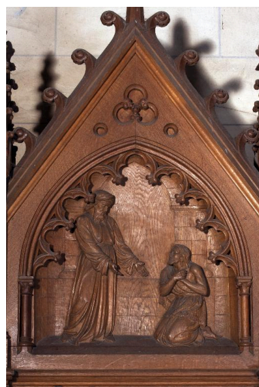
Bas-relief du fronton du confessionnal du bras sud : le Retour du fils prodigue.

Phot. Marie-Laure Monnehay-Vulliet IVR22_20138000321NUC2A