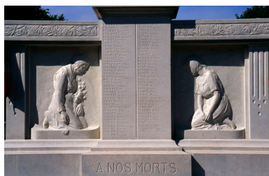
Vue des deux bas-reliefs de la face antérieure : La mère et l'épouse du soldat mort.