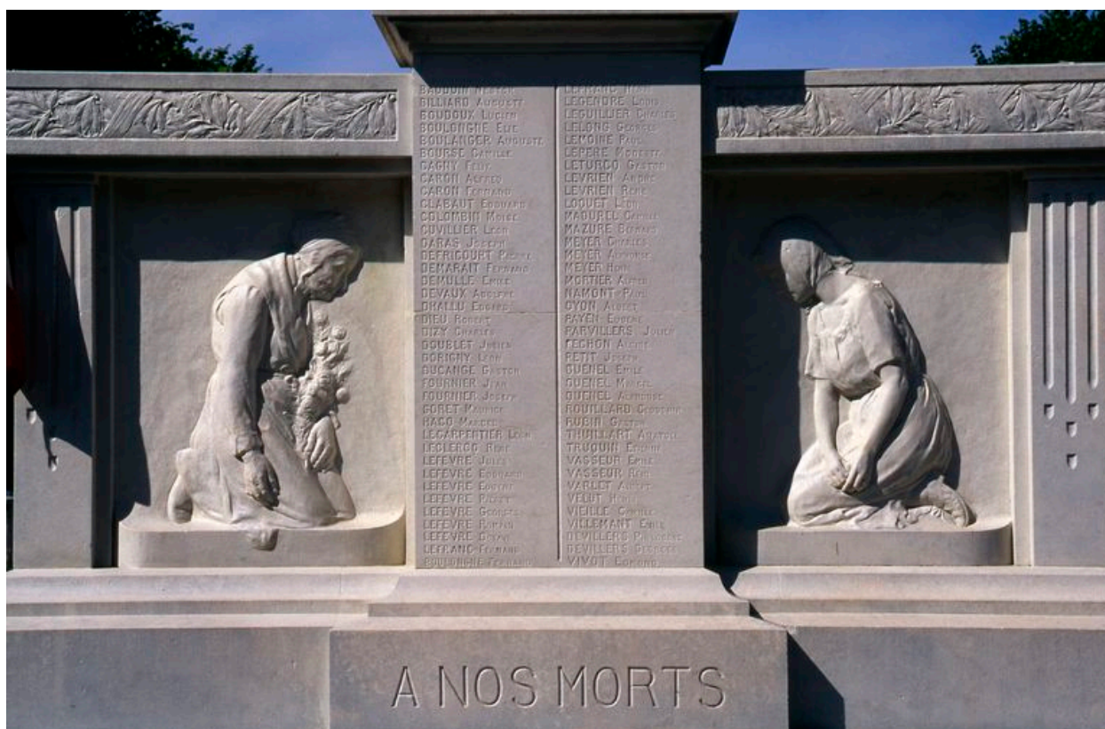
Vue des deux bas-reliefs de la face antérieure : La mère et l'épouse du soldat mort.