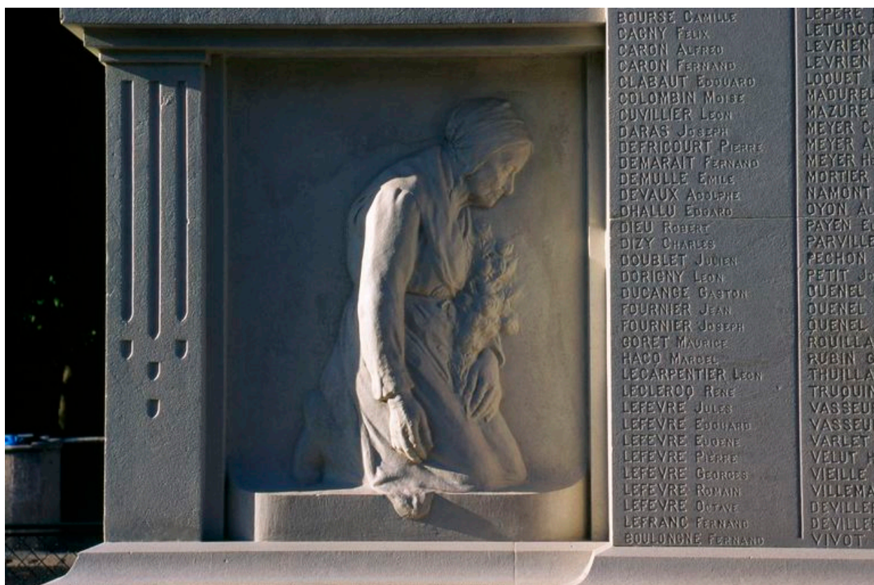
Vue du bas-relief représentant la mère du soldat mort.