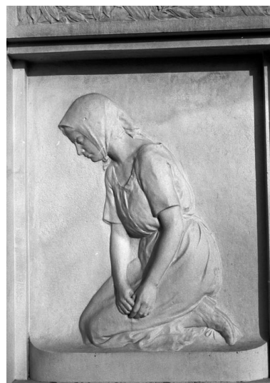
Vue du bas-relief représentant la mère du soldat mort.