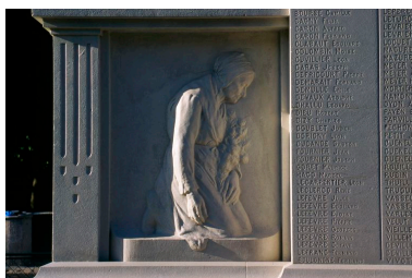
Vue du bas-relief représentant la mère du soldat mort.