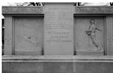
Vue des deux bas-reliefs de la face postérieure : La tombe du soldat. Le semeur.