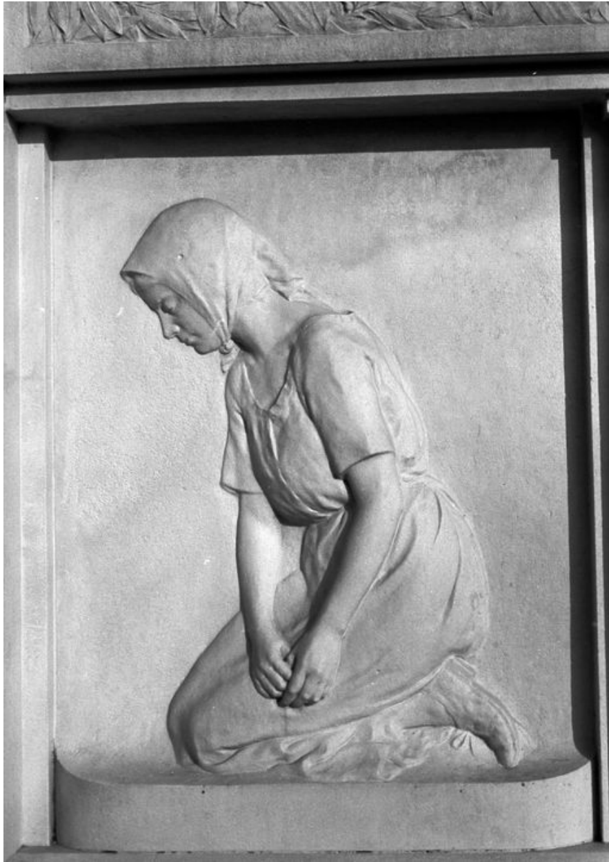
Vue du bas-relief représentant la mère du soldat mort.