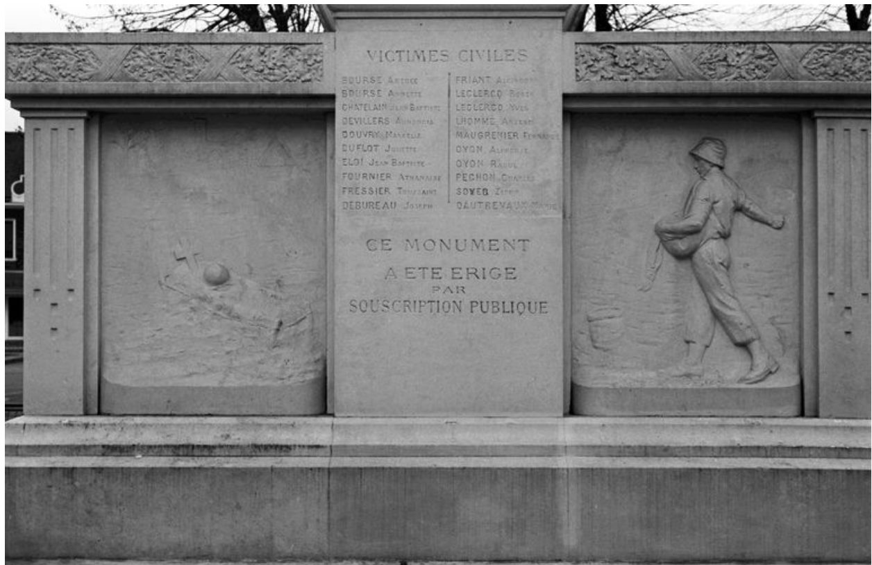
Vue des deux bas-reliefs de la face postérieure : La tombe du soldat. Le semeur.