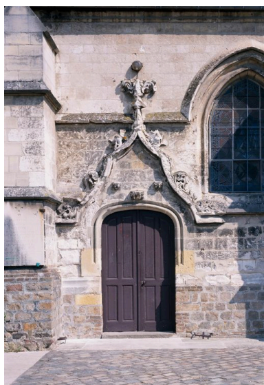
Détail sur le portail. IVR22_20038000465XA