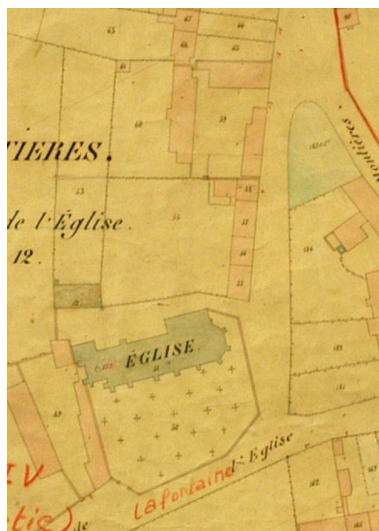
Extrait du cadastre de 1852 (DGI). IVR22_20038010909NUCA