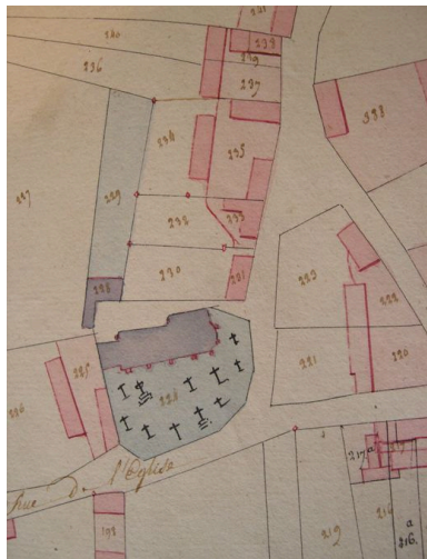
Extrait du cadastre de 1813. IVR22_20058010428NUCA