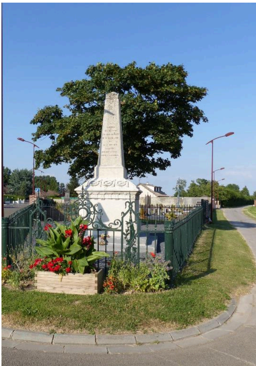
Le monument aux morts de Cachy.