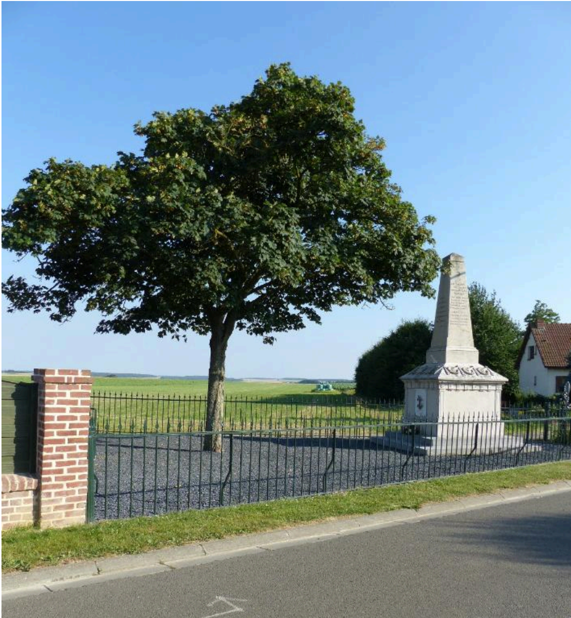
Vue de situation depuis le nord-est.