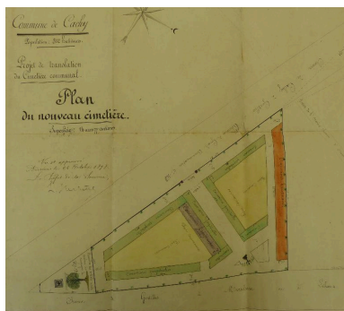
Cachy. Plan du nouveau cimetière, 1878 (AD Somme ; 99 O 879).