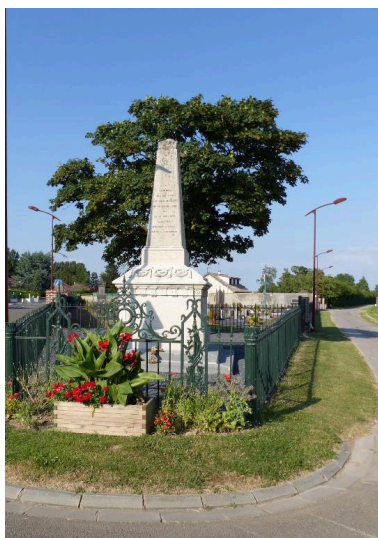
Le monument aux morts de Cachy.