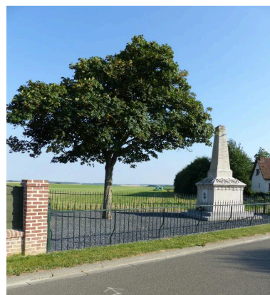
Vue de situation depuis le nord-est.