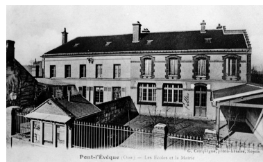
Élévation antérieure, avant 1914 (AP). IVR22_19856000262XB