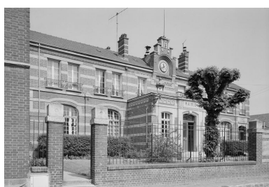
Vue générale. IVR22_19856000890X