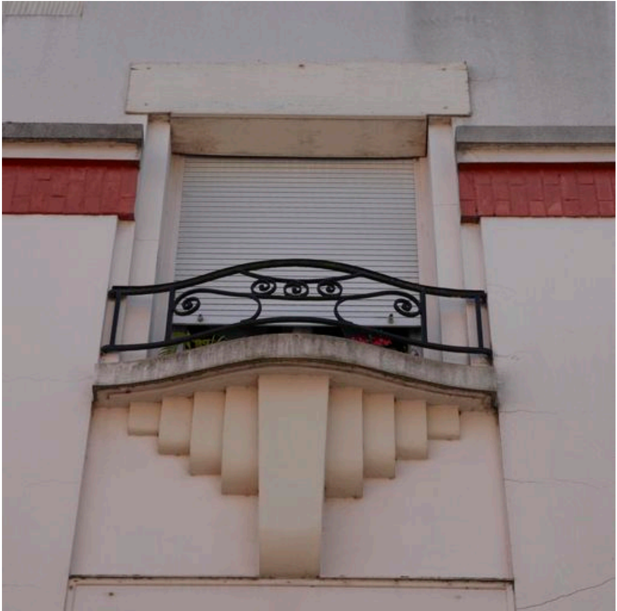
Appui de baie pyramidal.