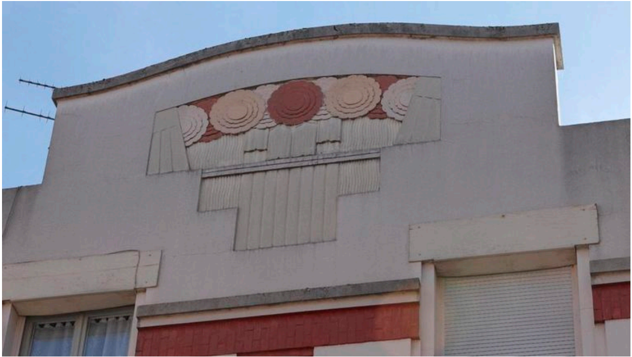
Fronton central aux motifs géométriques.