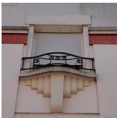
Appui de baie pyramidal.