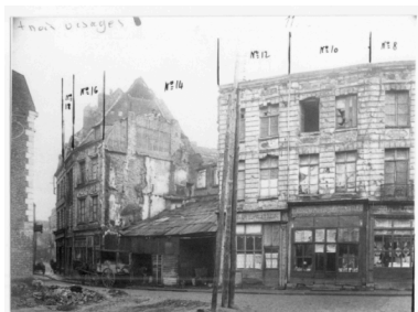
Arras. Rue des Trois-Visages. Photographie, 1922. IVR31_20096200311NUCB