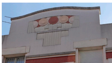
Fronton central aux motifs géométriques. IVR31_20096200207NUCA