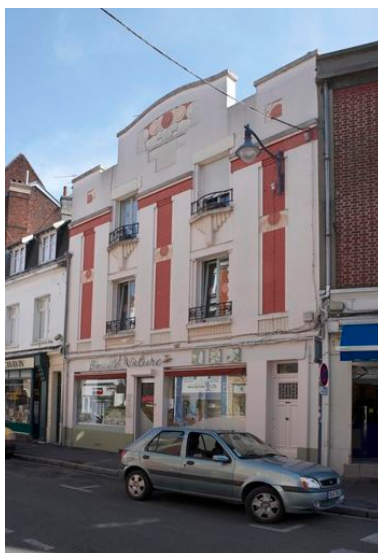
Vue générale. IVR31_20086200164NUCA