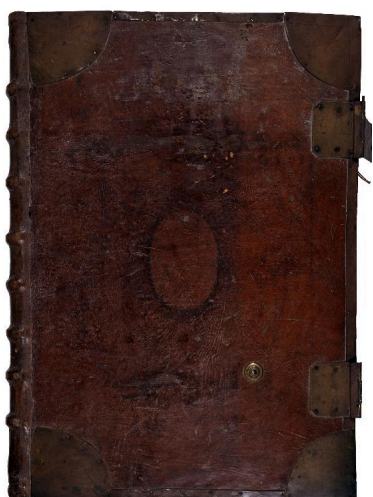
Vue de la reliure. IVR22_19966002475XA