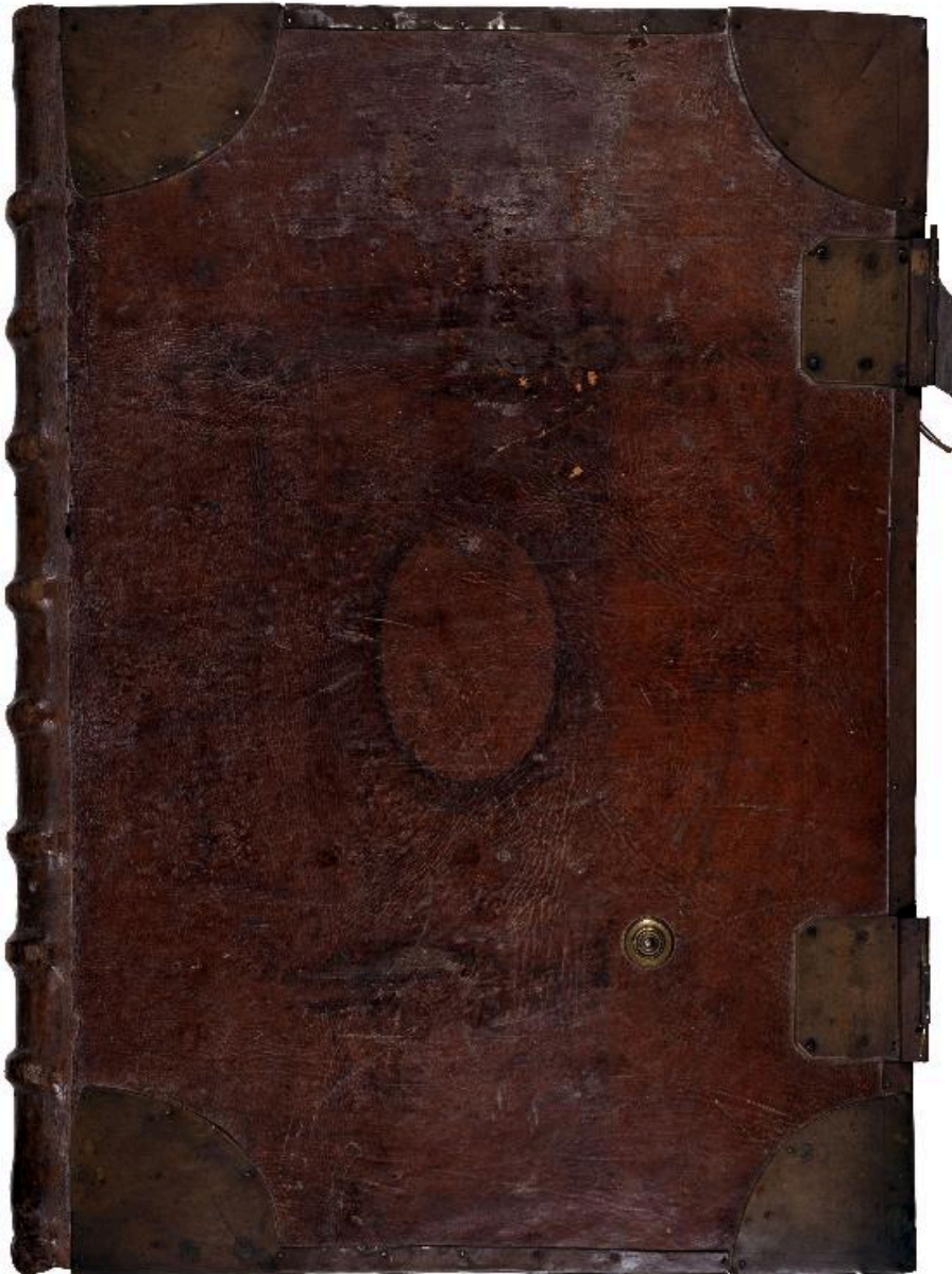
Vue de la reliure.