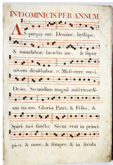
Vue de la première page. IVR22_19966002479XA