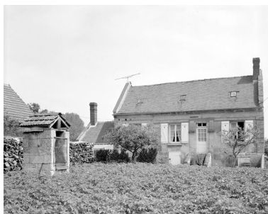
Vue générale. IVR22_19856000823V