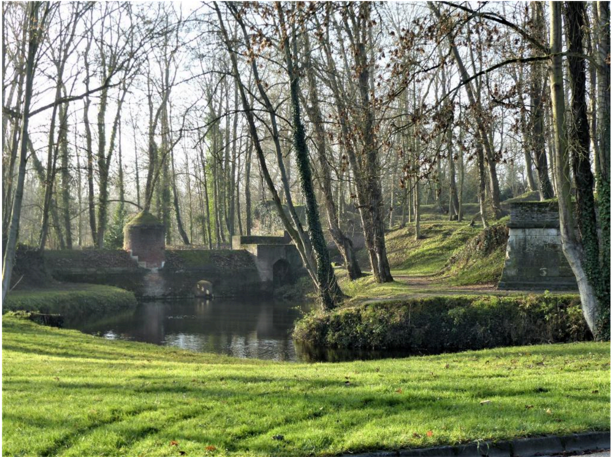
Les anciennes fortifications, au sud du boulevard Caraby.