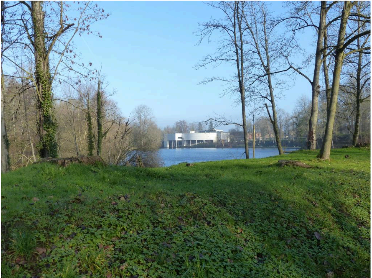
Vue de l'étang.