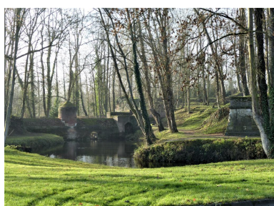
Les anciennes fortifications, au sud du boulevard Caraby.