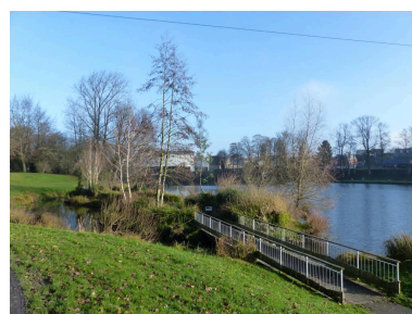
L'étang et l'île.