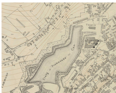
La promenade du Cam sur le plan de 1941 (AD Somme ; 70W_CP_80/1).