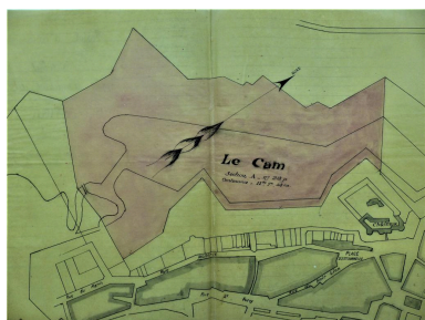
Plan des terrains à acquérir pour l'aménagement de la promenade du Cam, 1921 (AD Somme ; 99O 2996). IVR32_20228005161NUCA