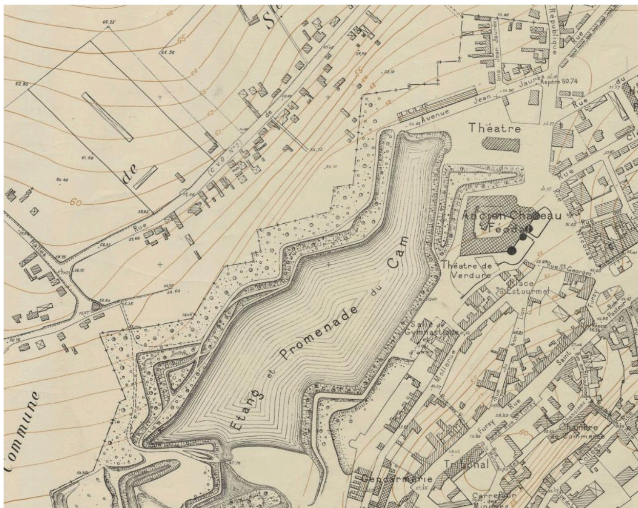
La promenade du Cam sur le plan de 1941 (AD Somme ; 70W_CP_80/1).