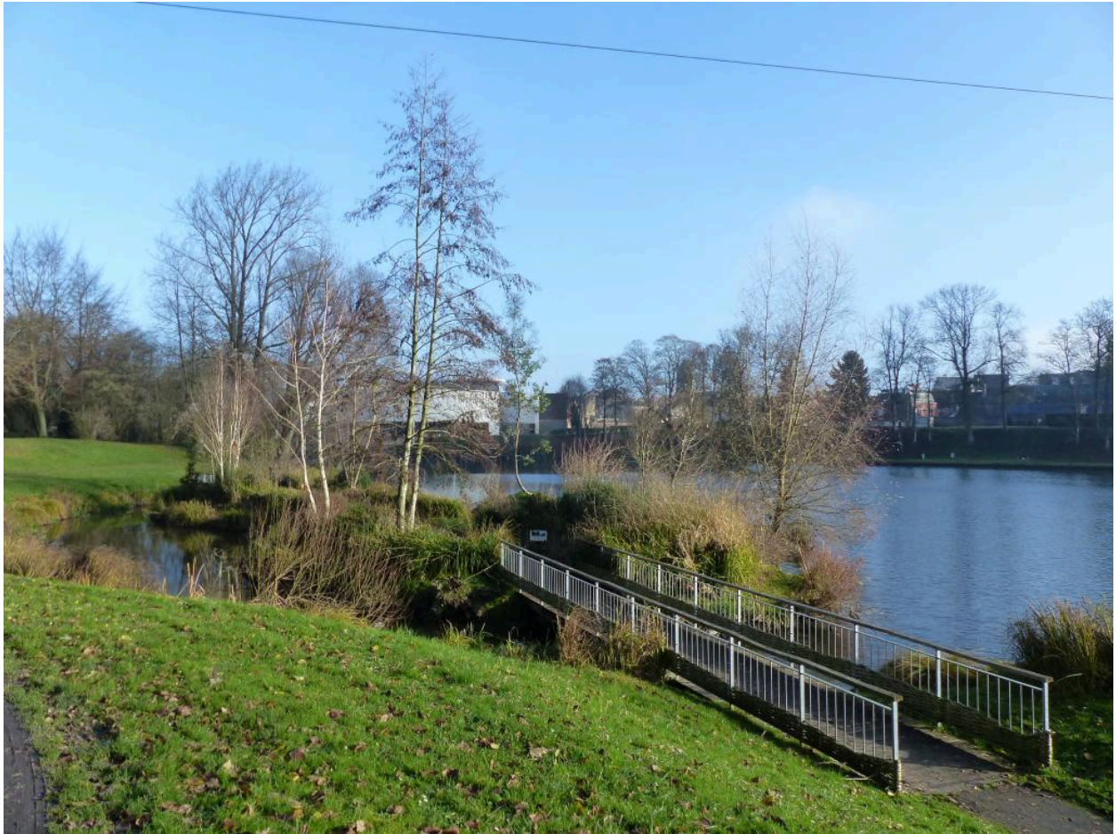
L'étang et l'île.