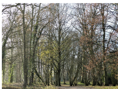
La promenade, au nord de l'étang.