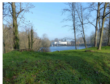
Vue de l'étang. IVR32_20218005258NUCA