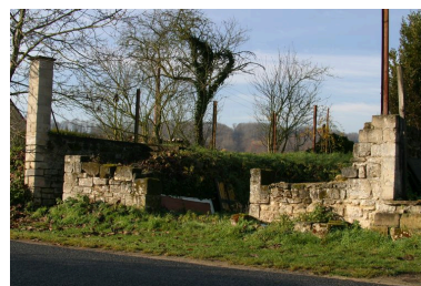
Vue de fondations d'une maison non reconstruite.