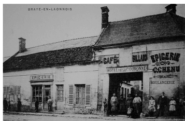
Vue ancienne d'un commerce de Bray-en-Laonnois (coll. part).