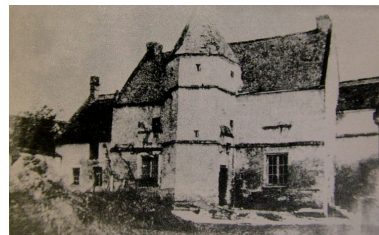
Vue de l'ancien château du 16e siècle.