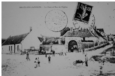
Vue ancienne de la place et de la rue de l'Eglise (coll. part).