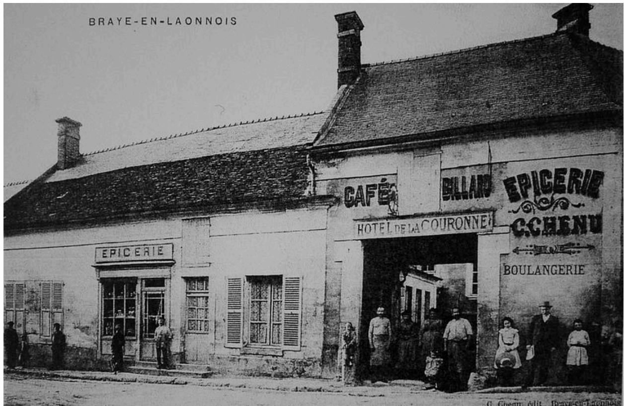
Vue ancienne d'un commerce de Braye-en-Laonnois (coll. part).