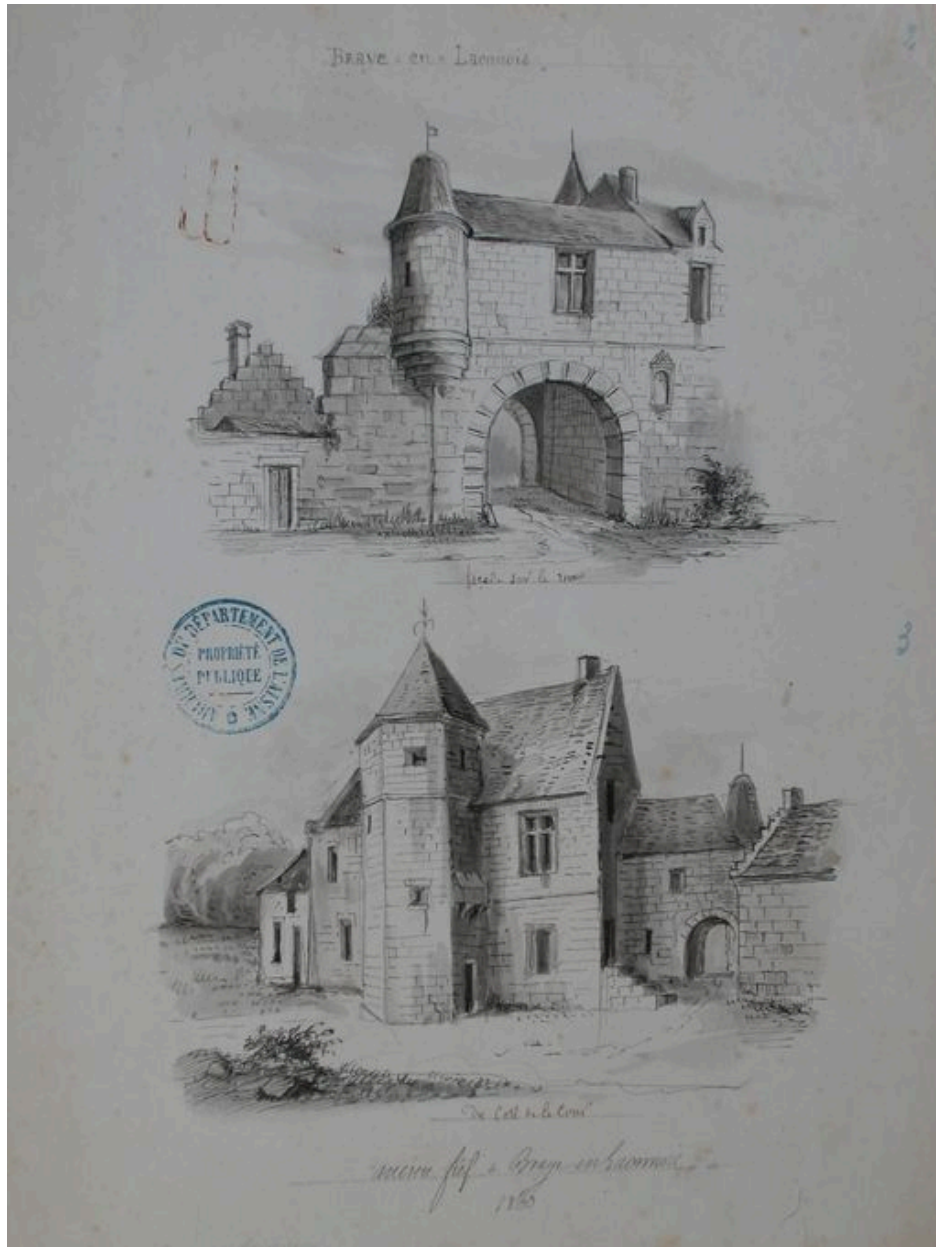
Dessin de l'ancien château du village par Amédée Piette (AD Aisne : 8 Fi Braye-en-Laonnois 2).