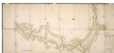
Plan de délimitation des marais de Ponthoile et de Noyelles au 19e siècle. IVR22_20078000039XAB