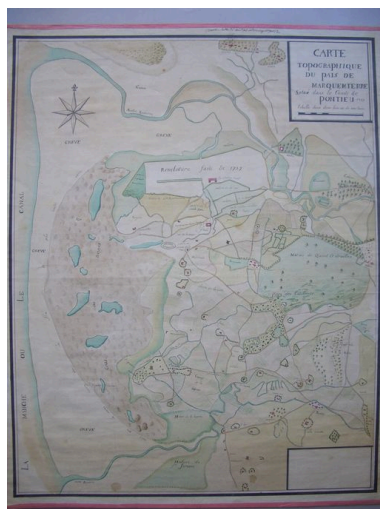
Carte topographique du pays de Marquenterre levée en 1737.