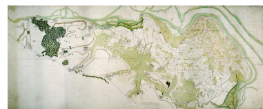
Plan du Marquenterre, de la baie de Somme à la baie d'Authie au 18e siècle.