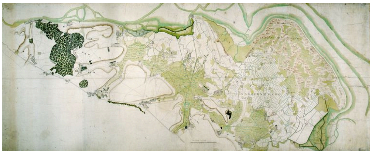
Plan du Marquenterre, de la baie de Somme à la baie d'Authie au 18e siècle.