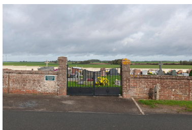
Entrée du cimetière.