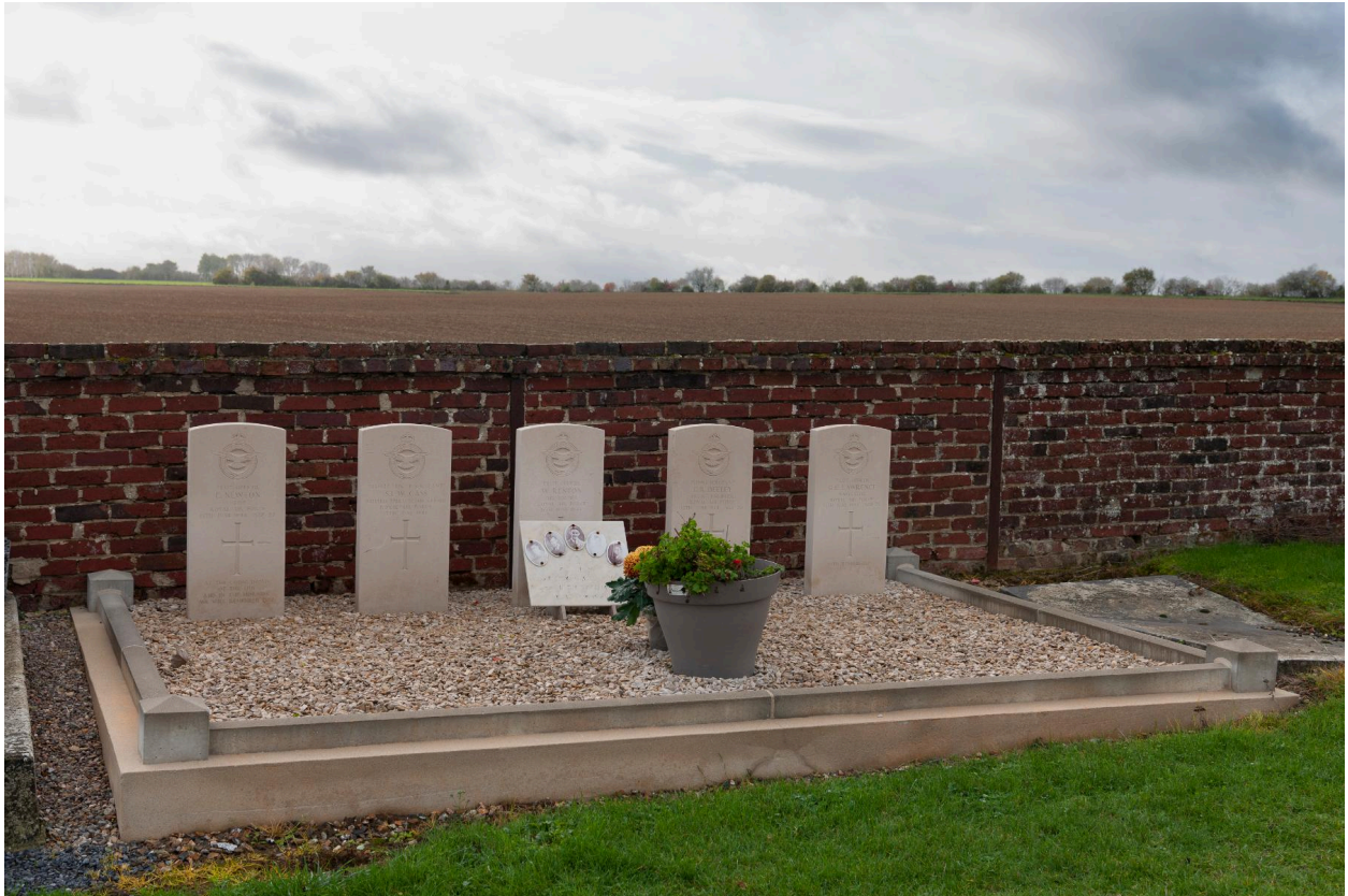
Stèle des aviateurs anglais morts epndant la Seconde Guerre mondiale.