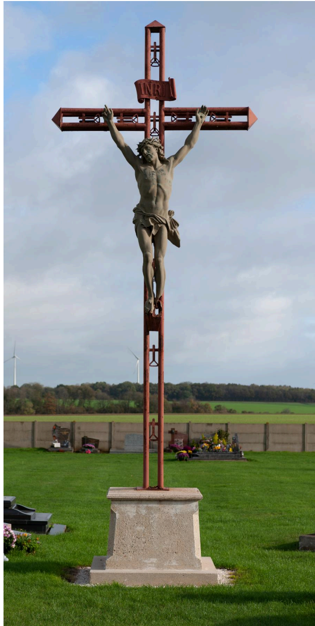
Croix du cimetière.