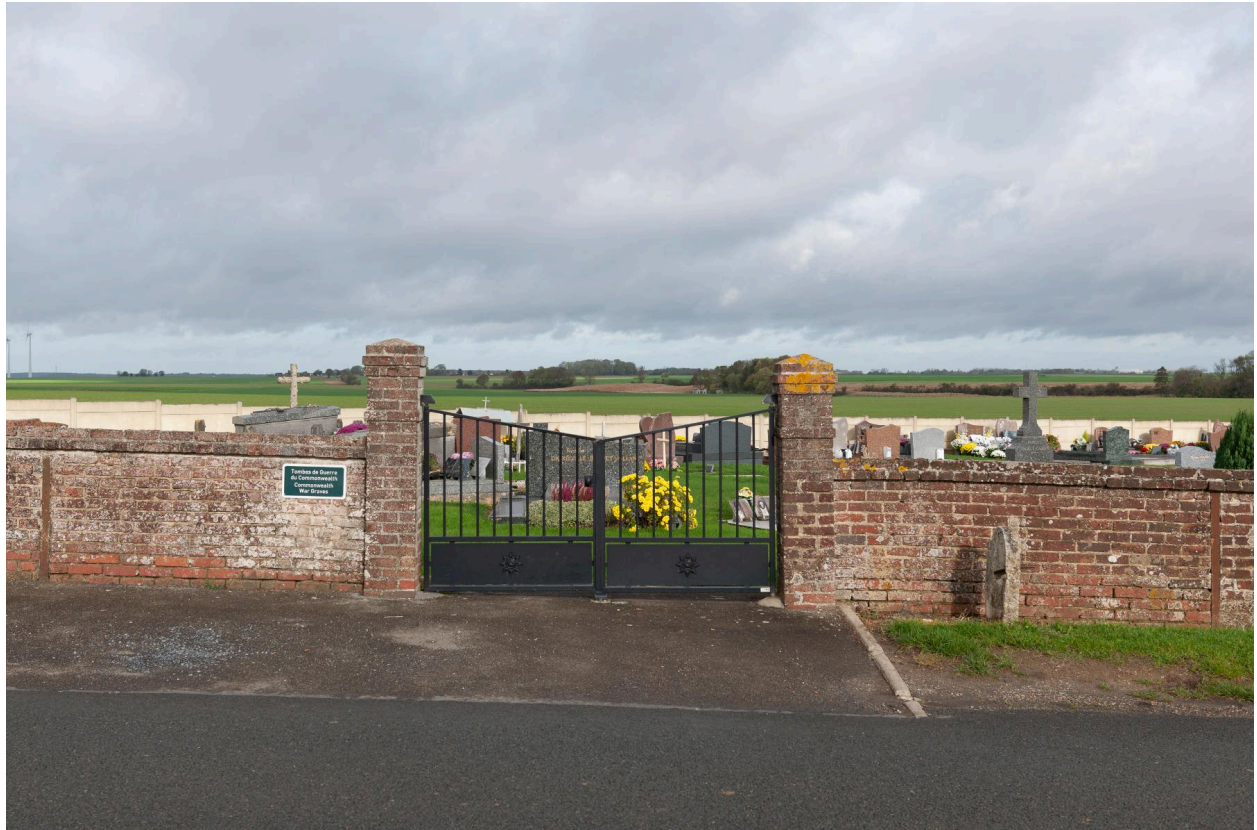
Entrée du cimetière.