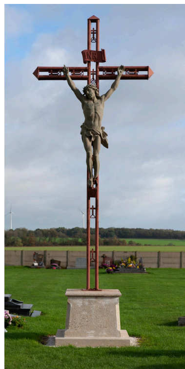
Croix du cimetière.