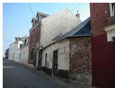
Rue Léon Parmentier et maison ancienne (1988 BC 41).