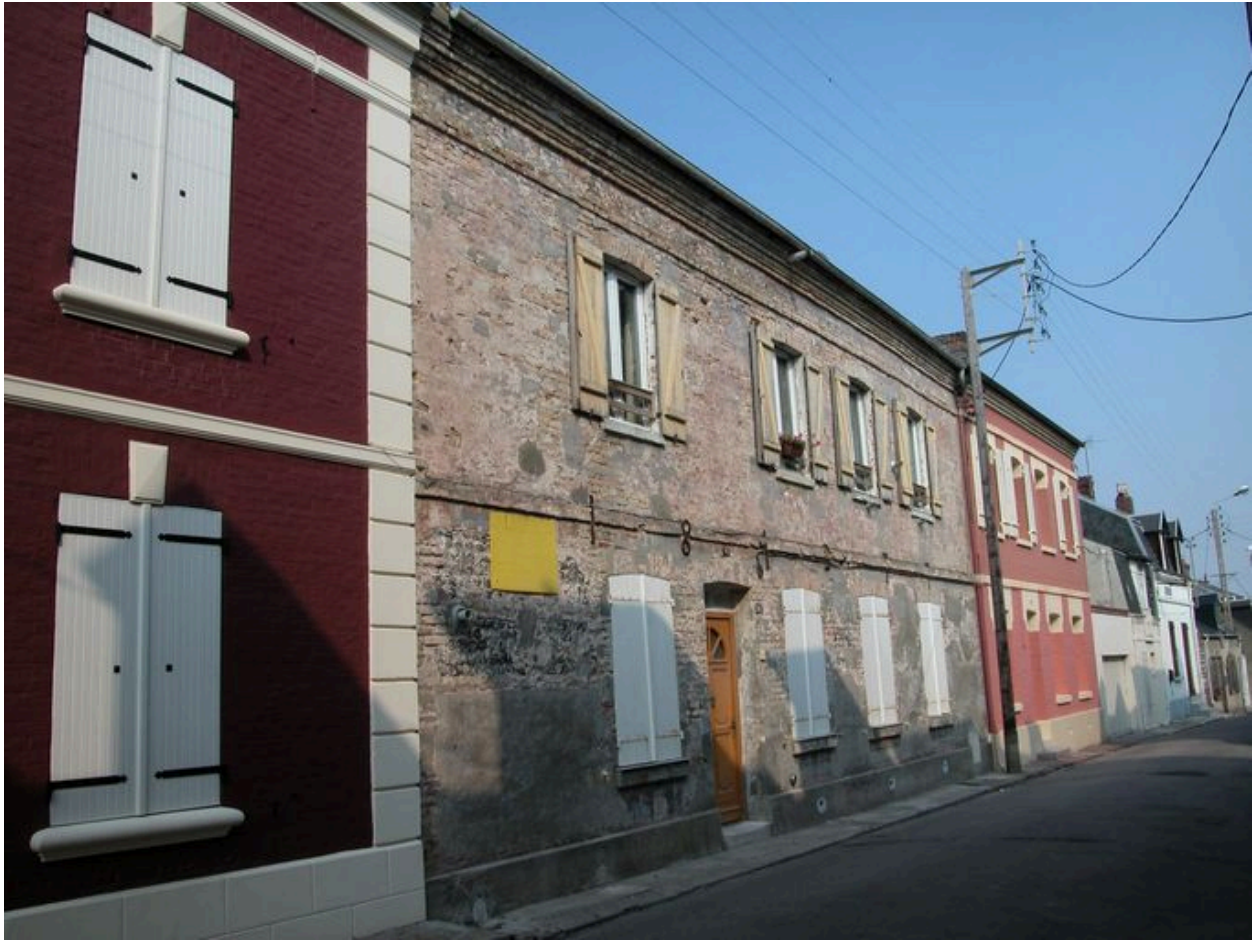
Maison, 11 rue Boyard (1988 BE 278), porte la date 1842.