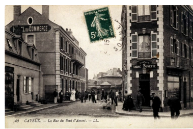
L'ancienne rue du Bout-d'Amont, actuelle rue Antoine-Sauvage, carte postale, 1er quart 20e siècle IVR22_20058000452XAB