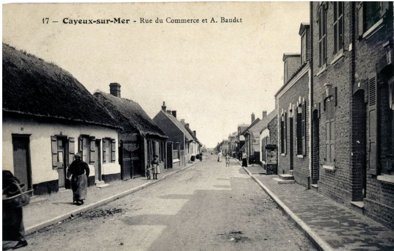
L'actuelle rue Mopin, carte postale, 1er quart 20e siècle.