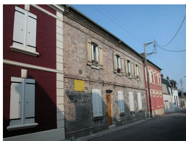
Maison, 11 rue Boyard (1988 BE 278), porte la date 1842. IVR22_20058003651NUCA