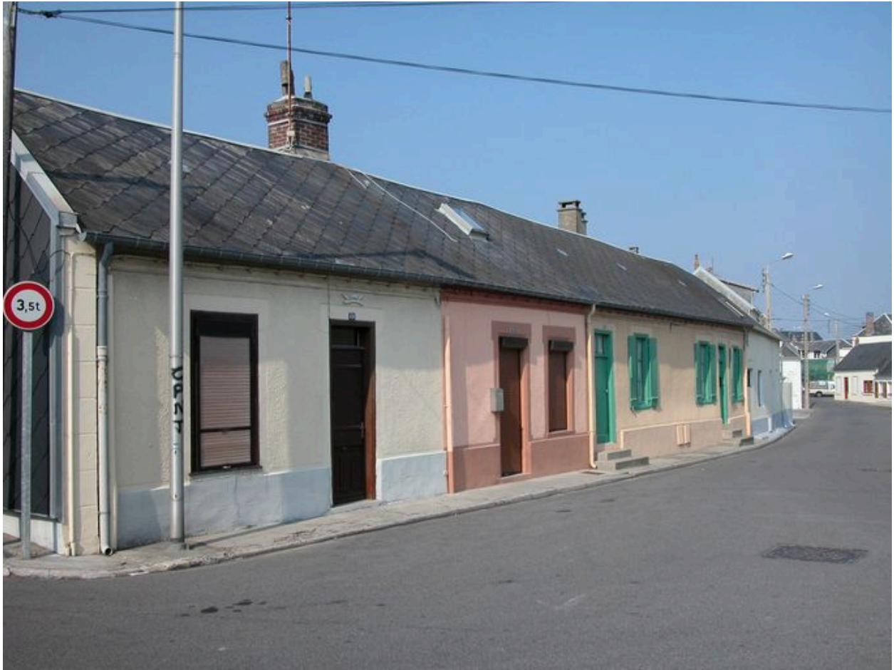
Ensemble de maisons anciennes (49 à 55 rue Parmentier).