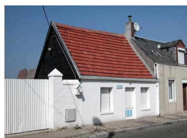
Maison ancienne, 63 rue Anatole-Mopin.