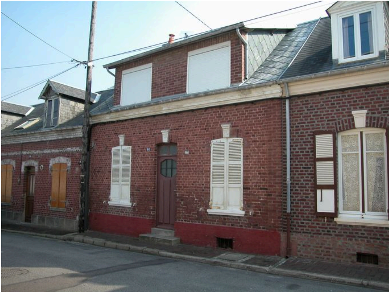
Maison (44 rue Parmentier) portant une plaque émaillée 'eau de source analysée et autorisée'.