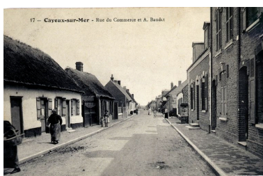
L'actuelle rue Mopin, carte postale, 1er quart 20e siècle (coll. part.).