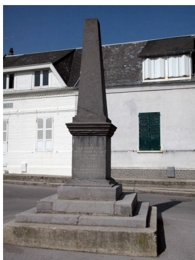
Le monument Parmentier, sur la place éponyme. IVR22_20058003662NUCA