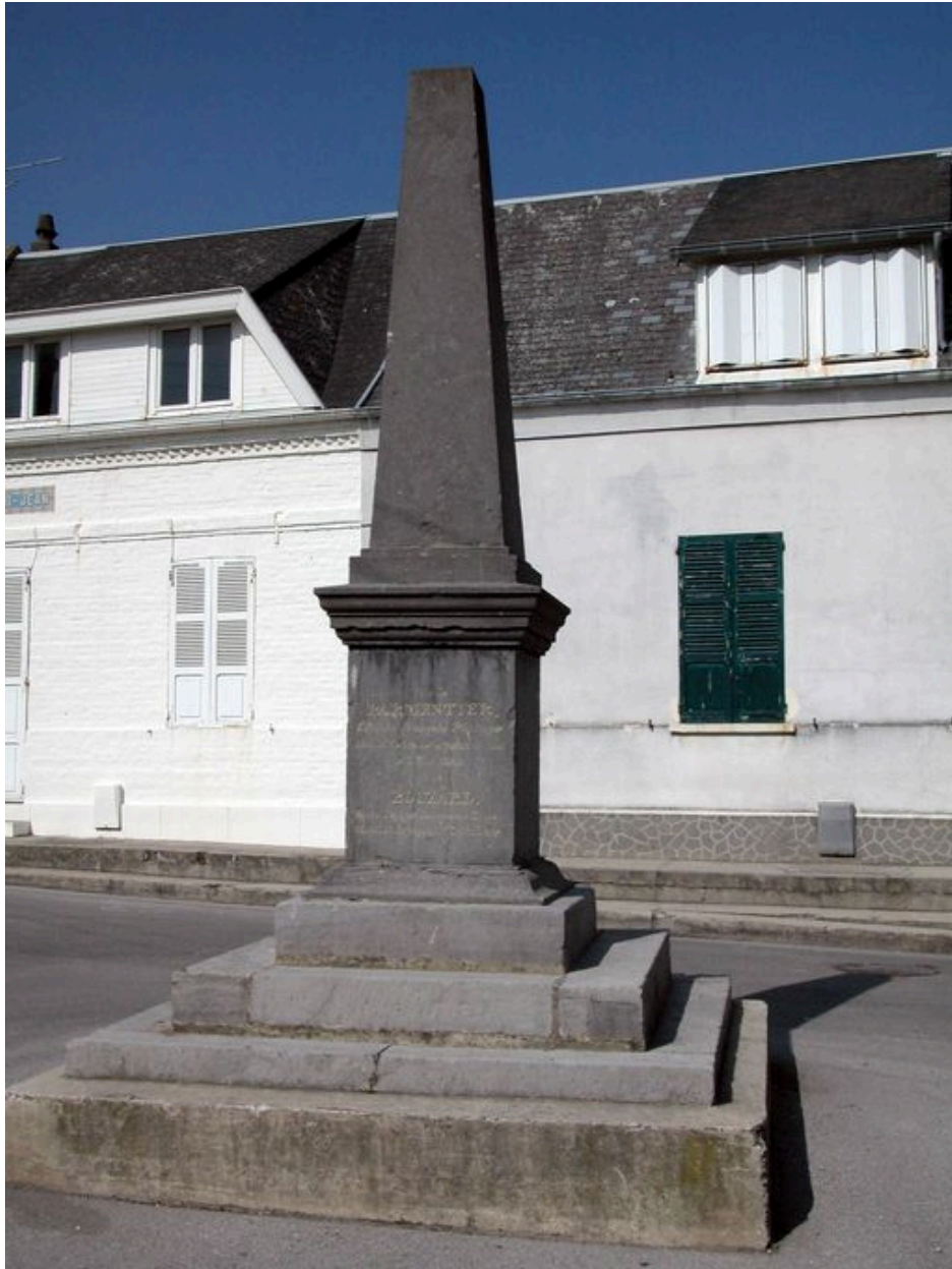
Le monument Parmentier, sur la place éponyme.