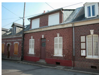
Maison (44 rue Parmentier) portant une plaque émaillée 'eau de source analysée et autorisée'. IVR22_20058003136NUCA