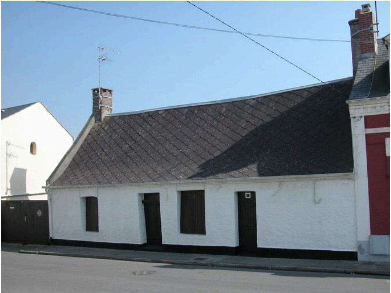
Une maison ancienne (58 rue Léon-Parmentier).