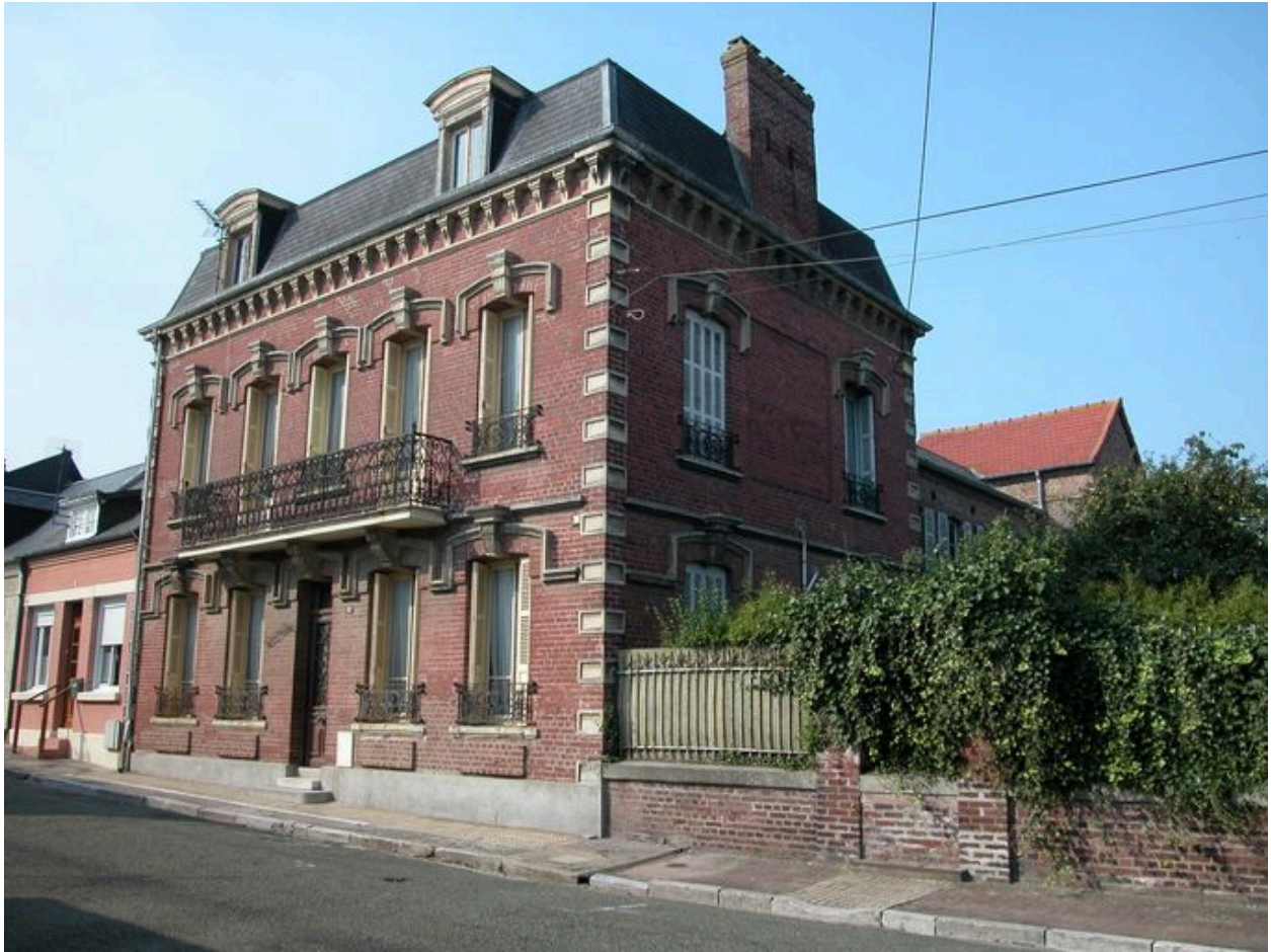
Maison dite Les Linettes, signée Léon Käppler, 17 rue Anatole Mopin (1988 BE 130).