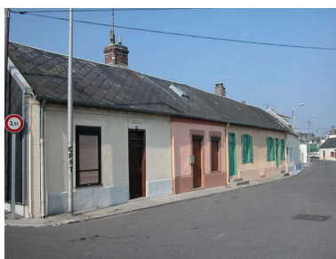
Ensemble de maisons anciennes (49 à 55 rue Parmentier). IVR22_20058003135NUCA