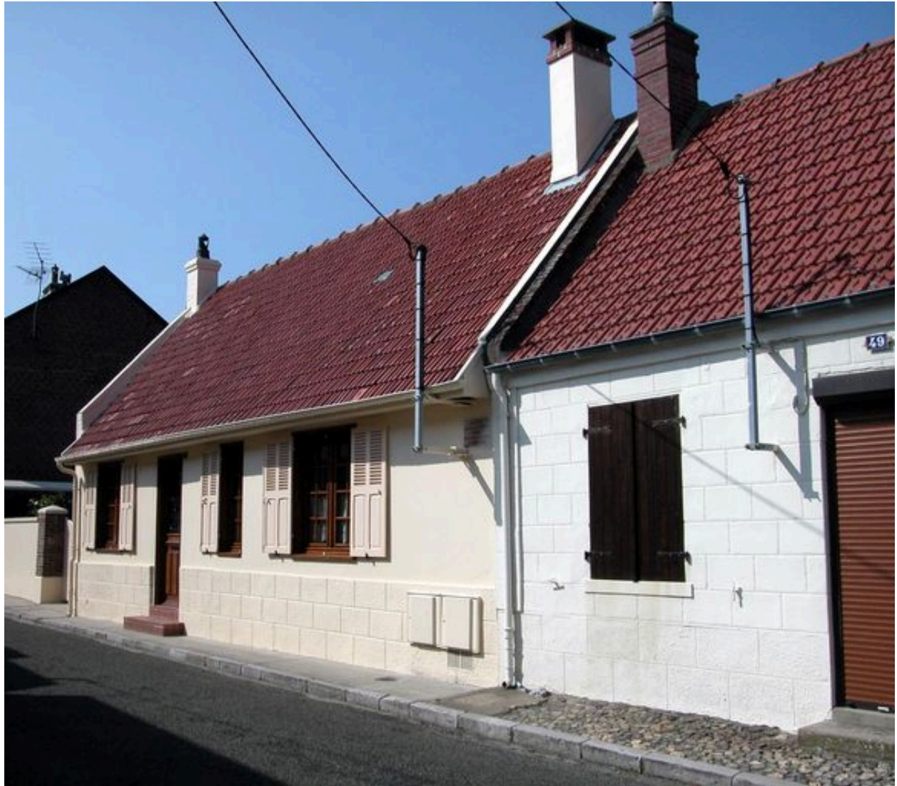
Maison natale d'Anatole-Mopin, maire de la commune entre 1908 et 1940 (47 rue Anatole-Mopin, 1988 BH 17).