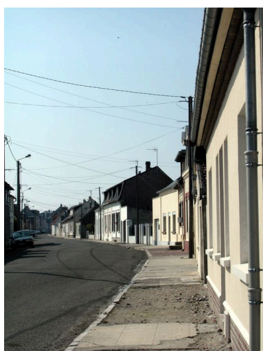
La rue Anatole-Mopin, ancienne rue à Baudet. IVR22_20058003663NUCA