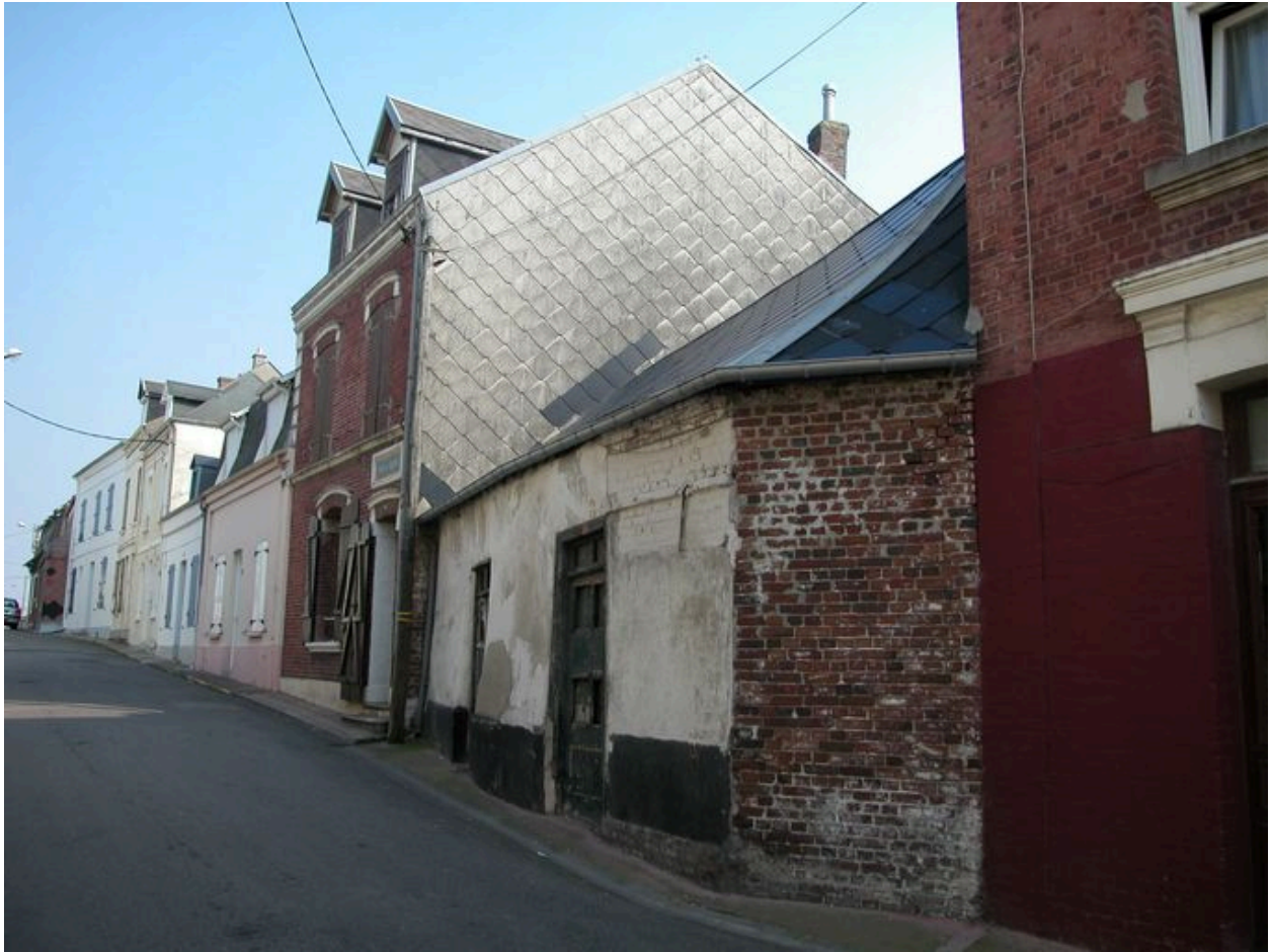
Rue Léon Parmentier et maison ancienne (1988 BC 41).