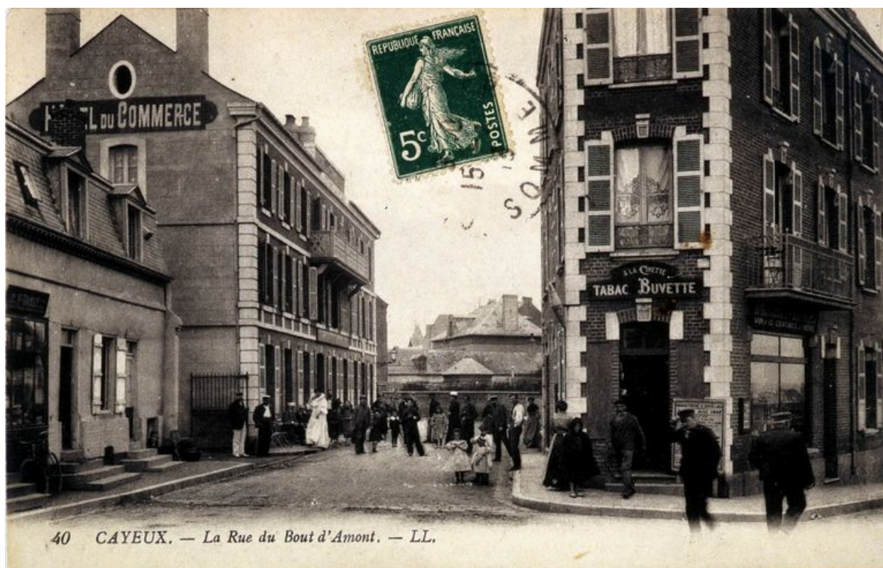
L'ancienne rue du Bout-d'Amont, actuelle rue Antoine-Sauvage, carte postale, 1er quart 20e siècle.