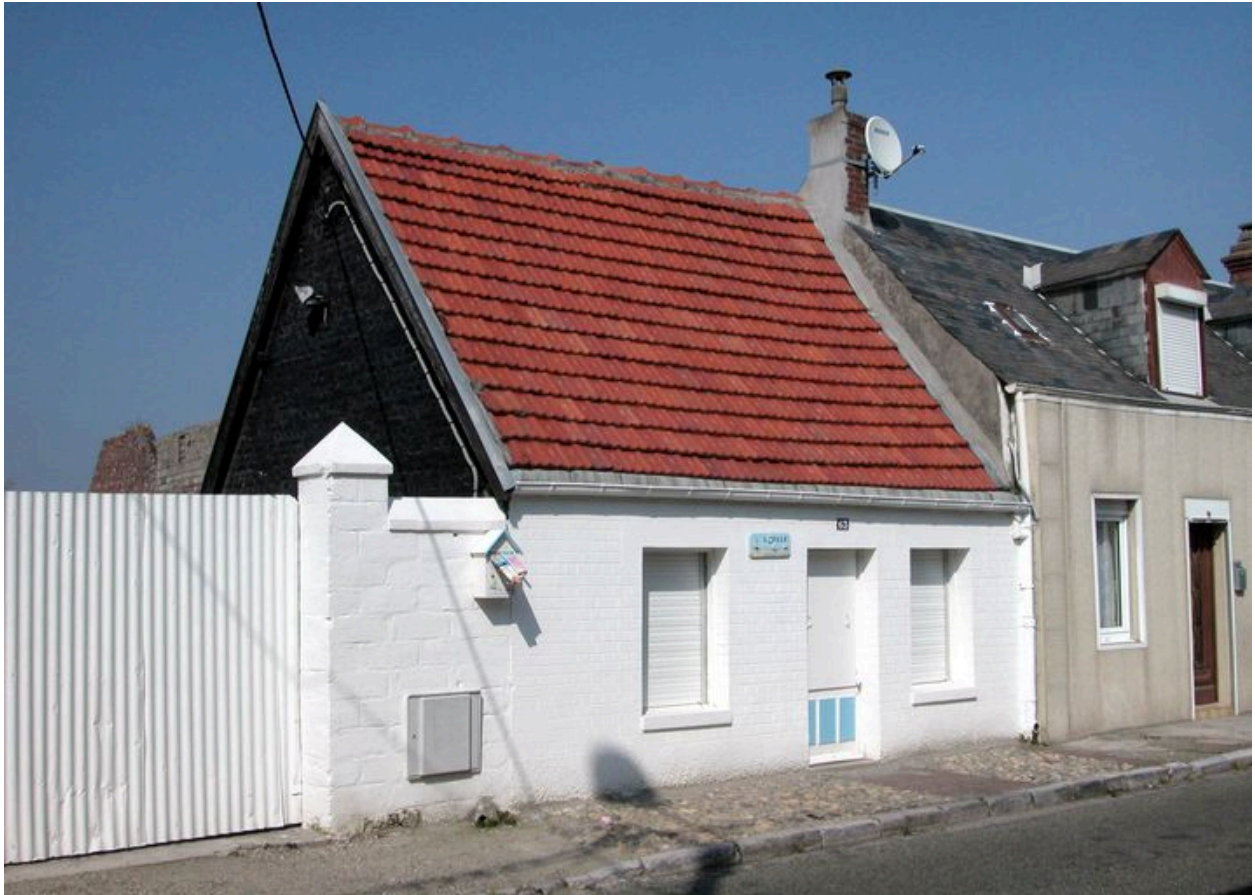
Maison ancienne, 63 rue Anatole-Mopin.