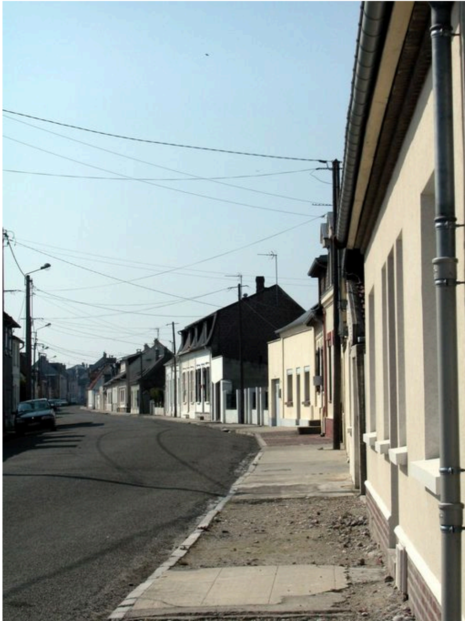
La rue Anatole-Mopin, ancienne rue à Baudet.