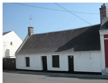
Une maison ancienne (58 rue Léon-Parmentier).