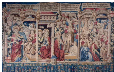
Vue d'ensemble. IVR22_19916000117VA