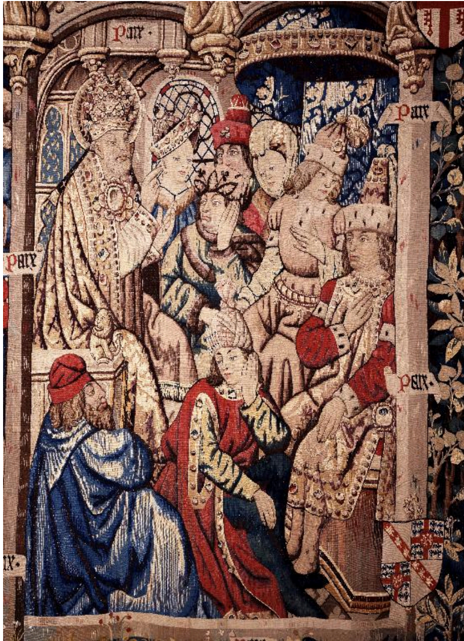
Vue de la scène représentant Théophile faisant prêcher saint Pierre.