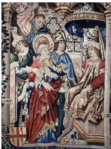
Vue de la scène représentant saint Pierre battu par les sbires de Théophile.