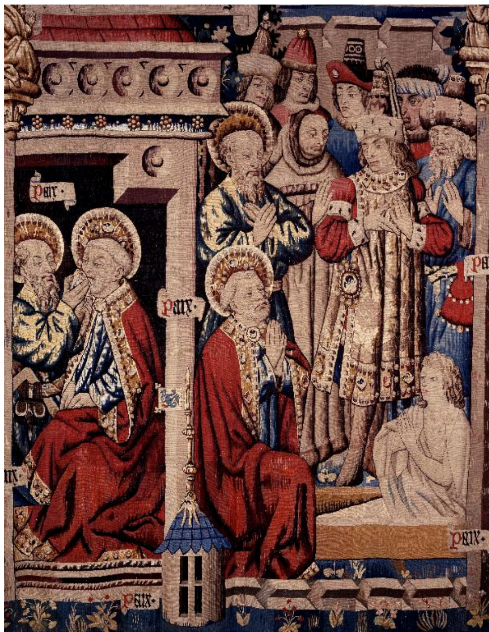
Vue des deux scènes centrales : saint Paul nourrissant saint Pierre et la résurrection du fils de Théophile.