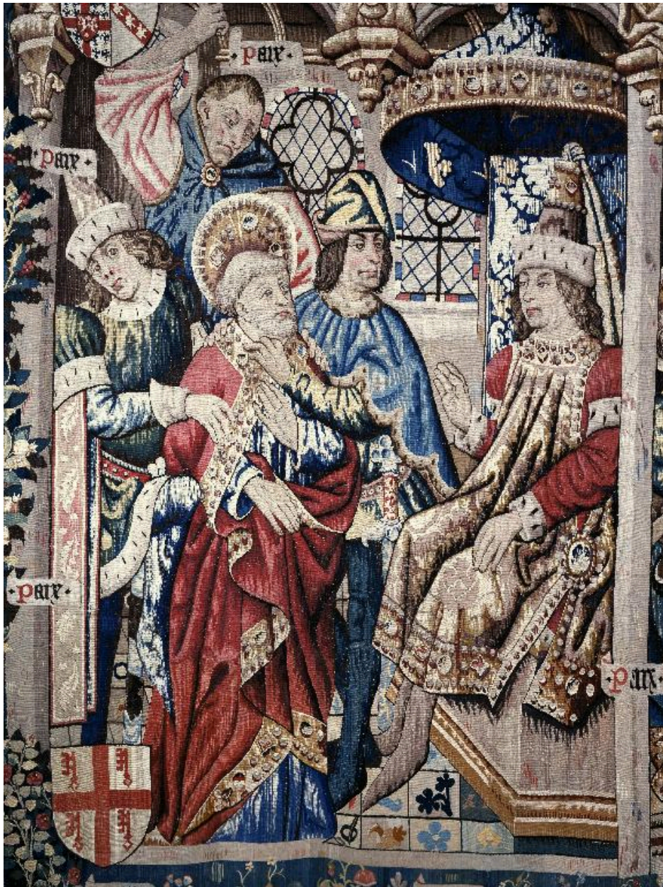
Vue de la scène représentant saint Pierre battu par les sbires de Théophile.