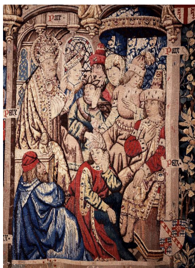
Vue de la scène représentant Théophile faisant prêcher saint Pierre. IVR22_19916000110VA