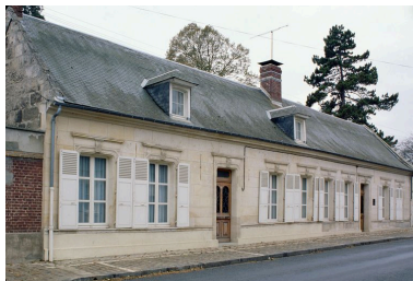
Elévation antérieure.