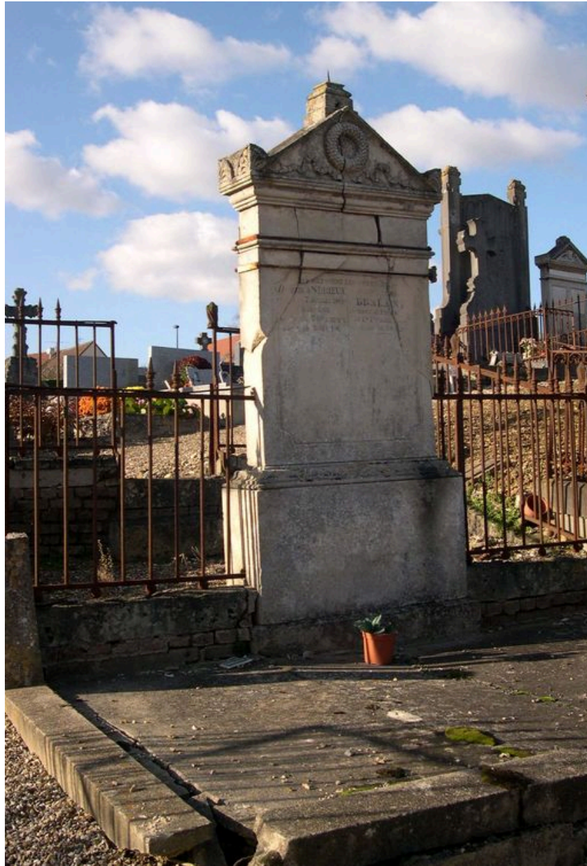
Vue générale depuis le sud-est.