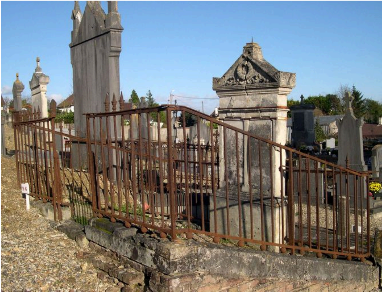
Vue générale depuis le sud-ouest.