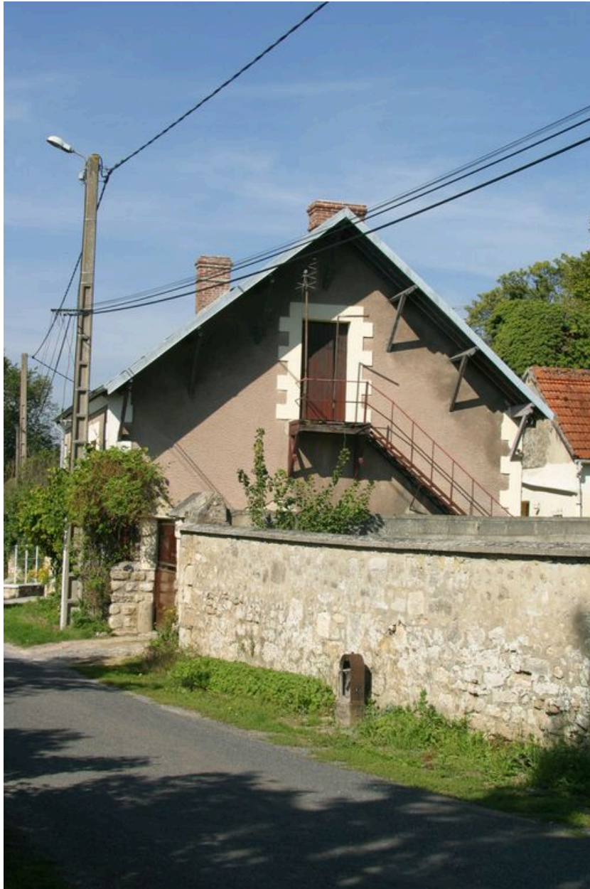
Vue du pignon droit.