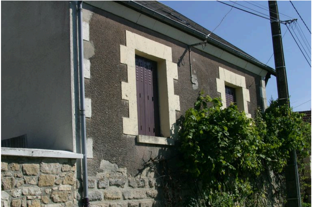
Vue générale de la façade principale.