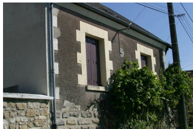
Vue générale de la façade principale. IVR22_20030202004NUCA