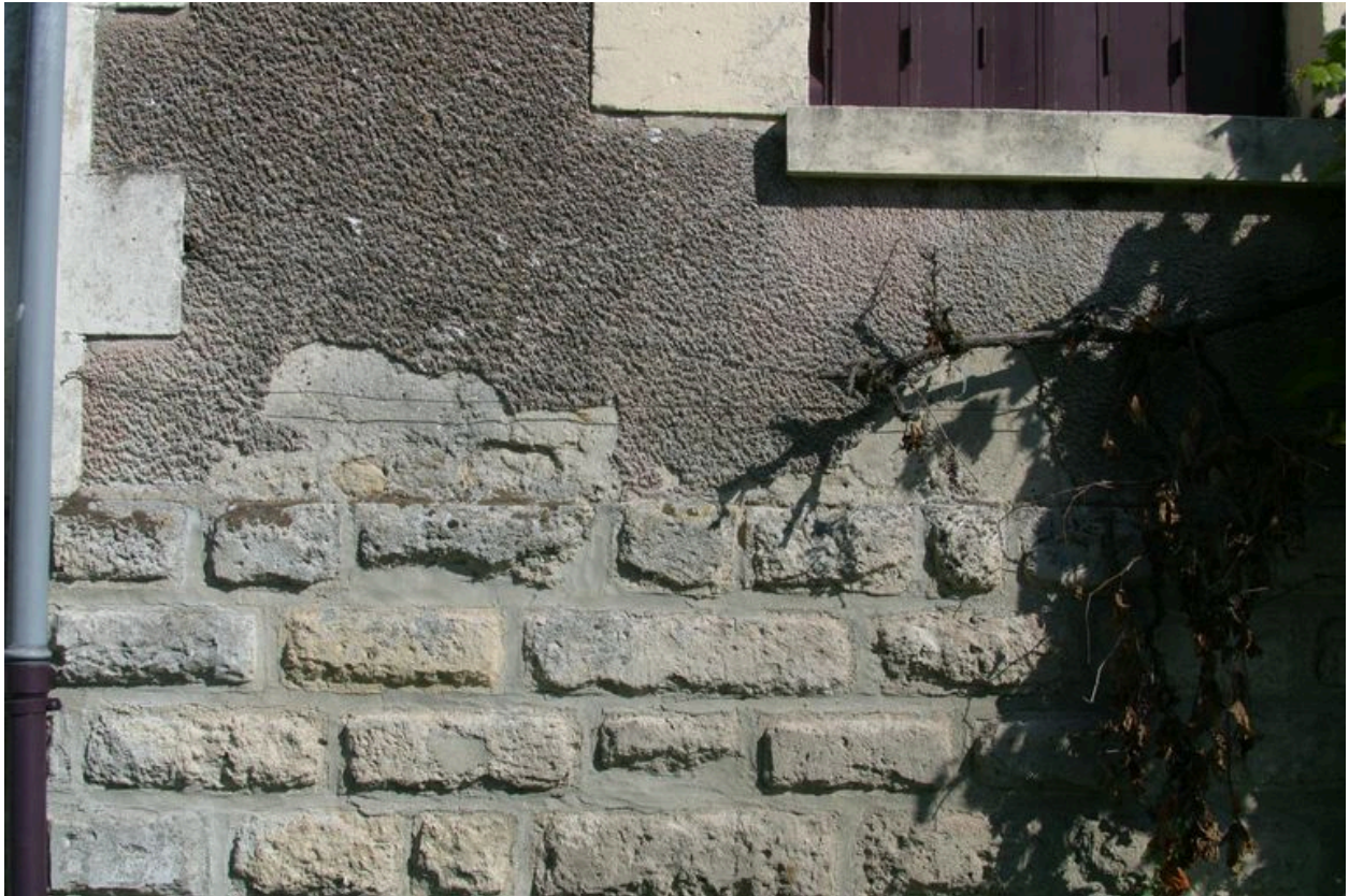
Détail du mur de façade.