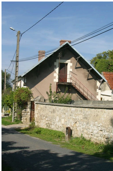
Vue du pignon droit. IVR22_20030202006NUCA