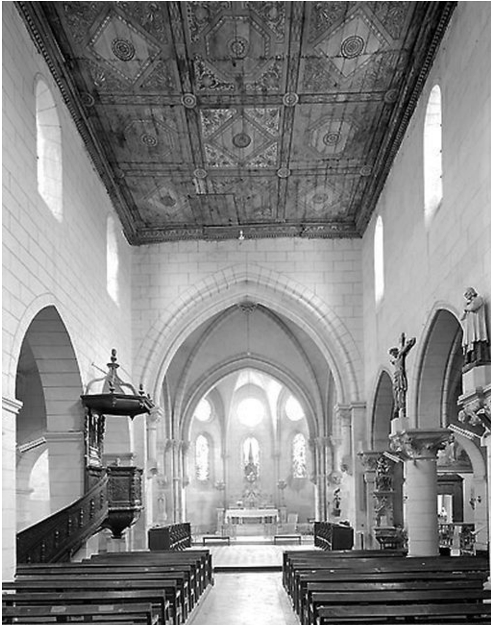
Vue intérieure de l'église.