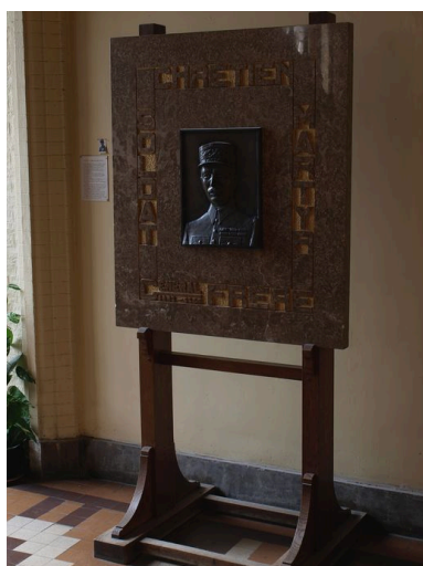
Vue générale. IVR31_20106204758NUCA