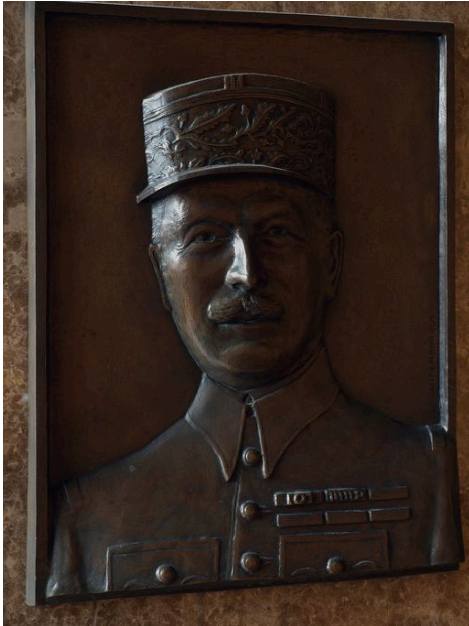
Vue de détail sur le portrait.