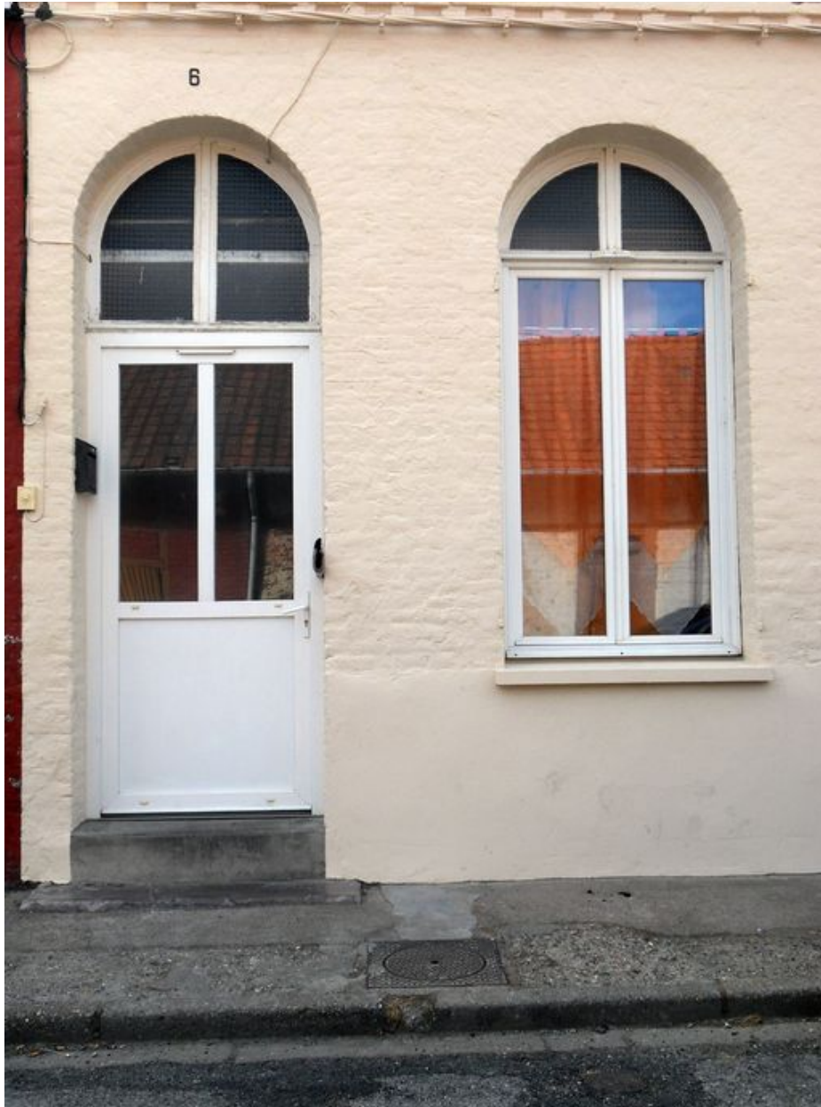
Logement, 6 rue Saint-Jules : détail de la façade.