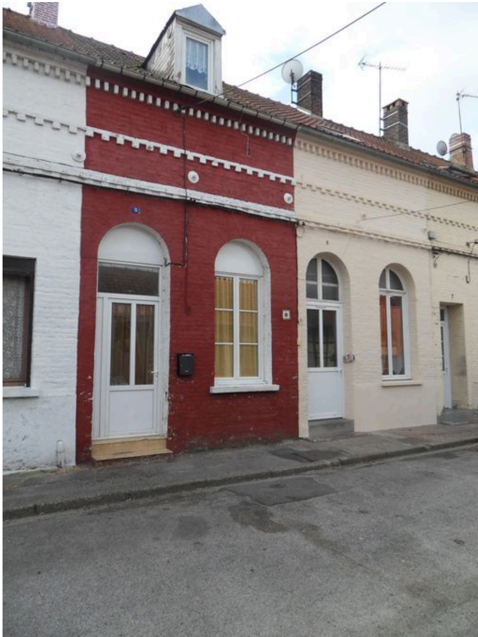
Logements, 5 et 6 rue Saint-Jules.