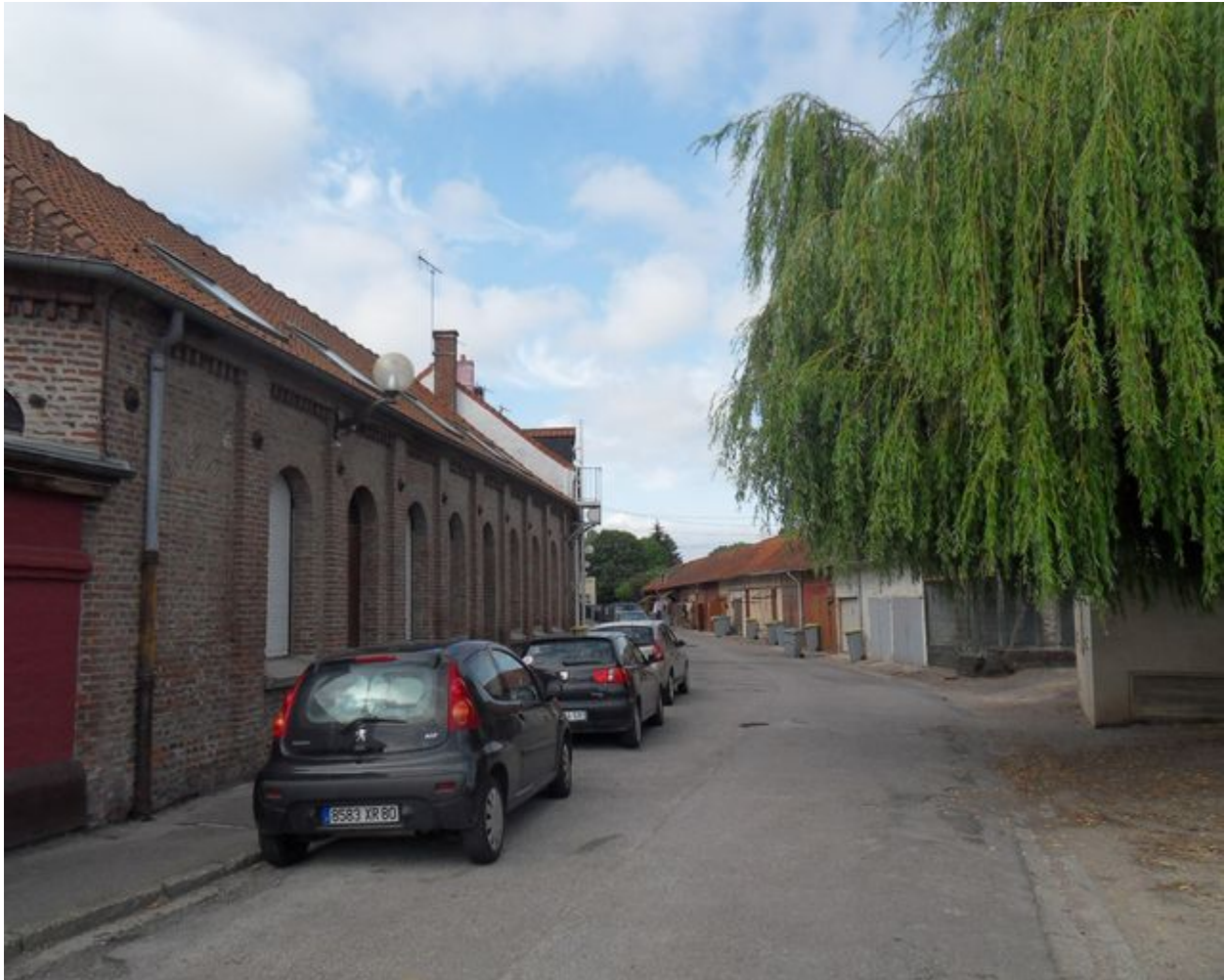
Vue générale. L'ancienne cantine au premier plan.