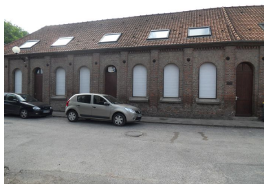
Vue de l'ancienne cantine en 2010. IVR22_20108001490NUCA