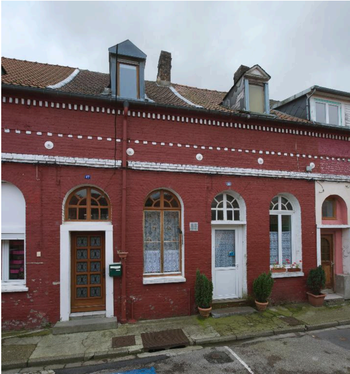
Façade sur rue des logements 17 et 18 de la cité Saint-Jules.