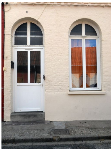
Logement, 6 rue Saint- Jules : détail de la façade. IVR22_20108001489NUCA