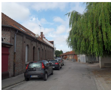
Vue générale. L'ancienne cantine au premier plan.