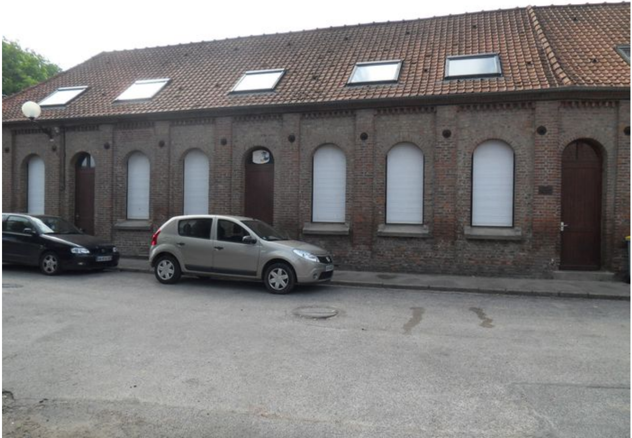
Vue de l'ancienne cantine en 2010.