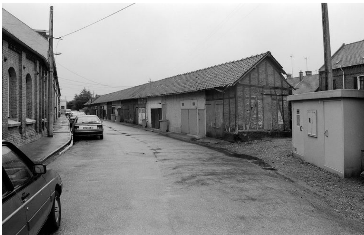
Vue des remises en regard des logements, en 1991.