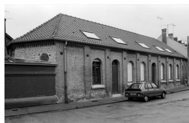
Vue de l'ancienne cantine, en 1991.