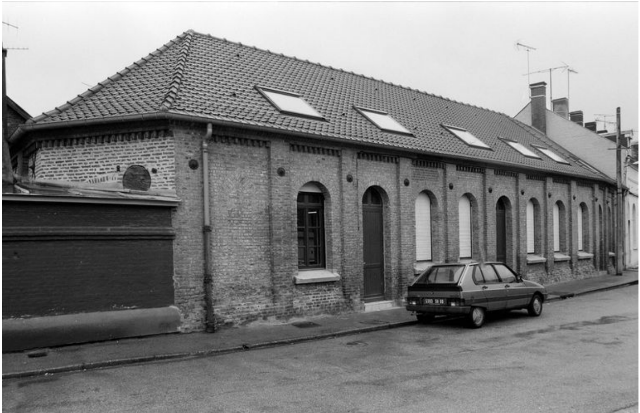
Vue de l'ancienne cantine, en 1991.