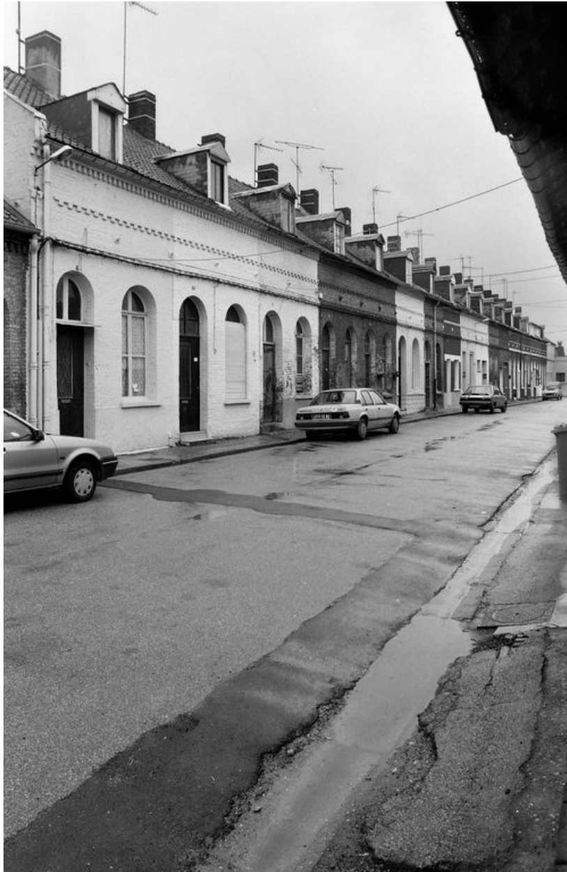
Vue générale, en 1991.