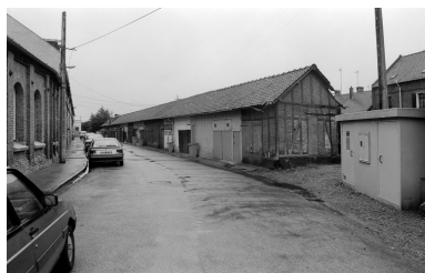
Vue des remises en regard des logements, en 1991.