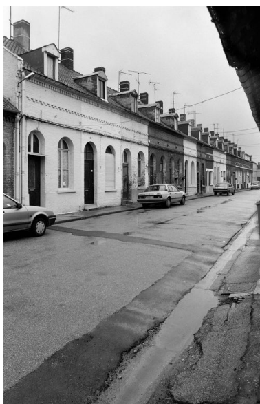
Vue générale, en 1991. IVR22_19918000272Z

IVR22_20128005324NUC2A