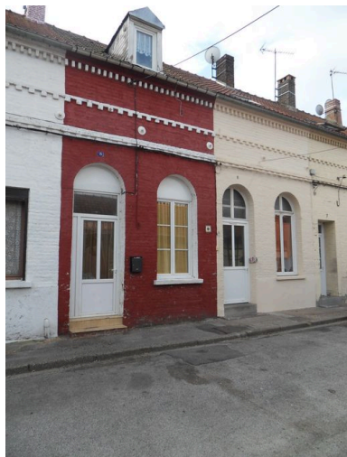
Logements, 5 et 6 rue Saint-Jules. IVR22_20108001488NUCA