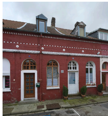
Façade sur rue des logements 17 et 18 de la cité Saint-Jules. IVR22_20128000862NUC2AQ