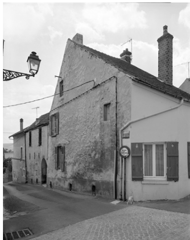
Vue de la façade sur la rue avec le passage voûté. IVR22_19960200497V