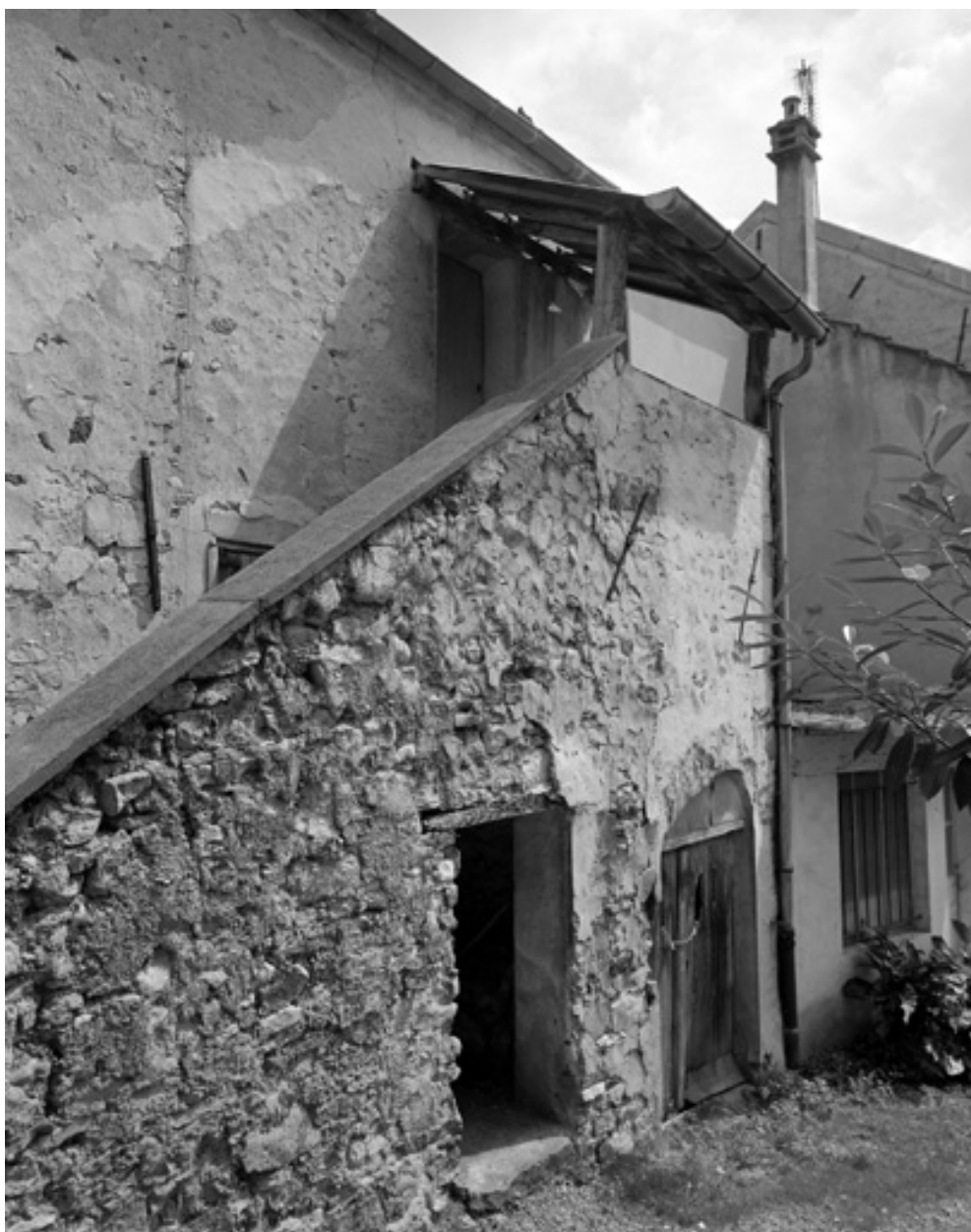
Vue de l'escalier extérieur du côté de la cour.