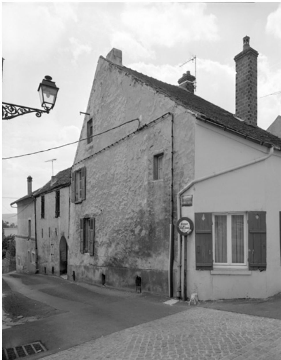
Vue de la façade sur la rue avec le passage voûté.