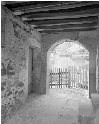
Vue du passage sous le bâtiment principal.