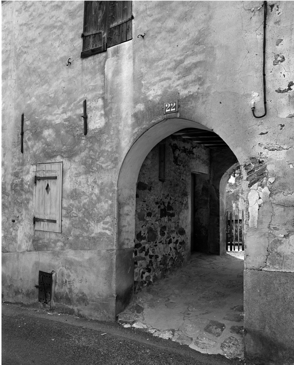
Détail du porche ouvrant sur la rue.