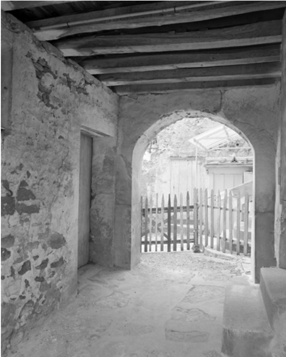
Vue du passage sous le bâtiment principal.