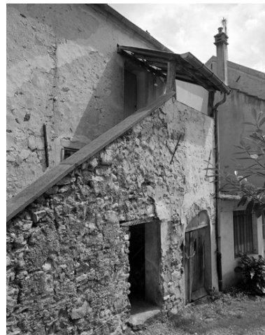
Vue de l'escalier extérieur du côté de la cour.