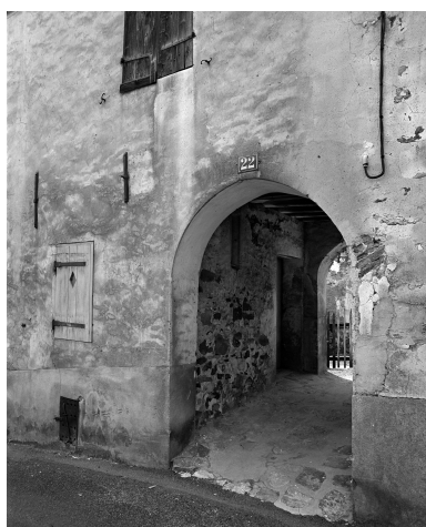
Détail du porche ouvrant sur la rue. IVR22_19960201107X