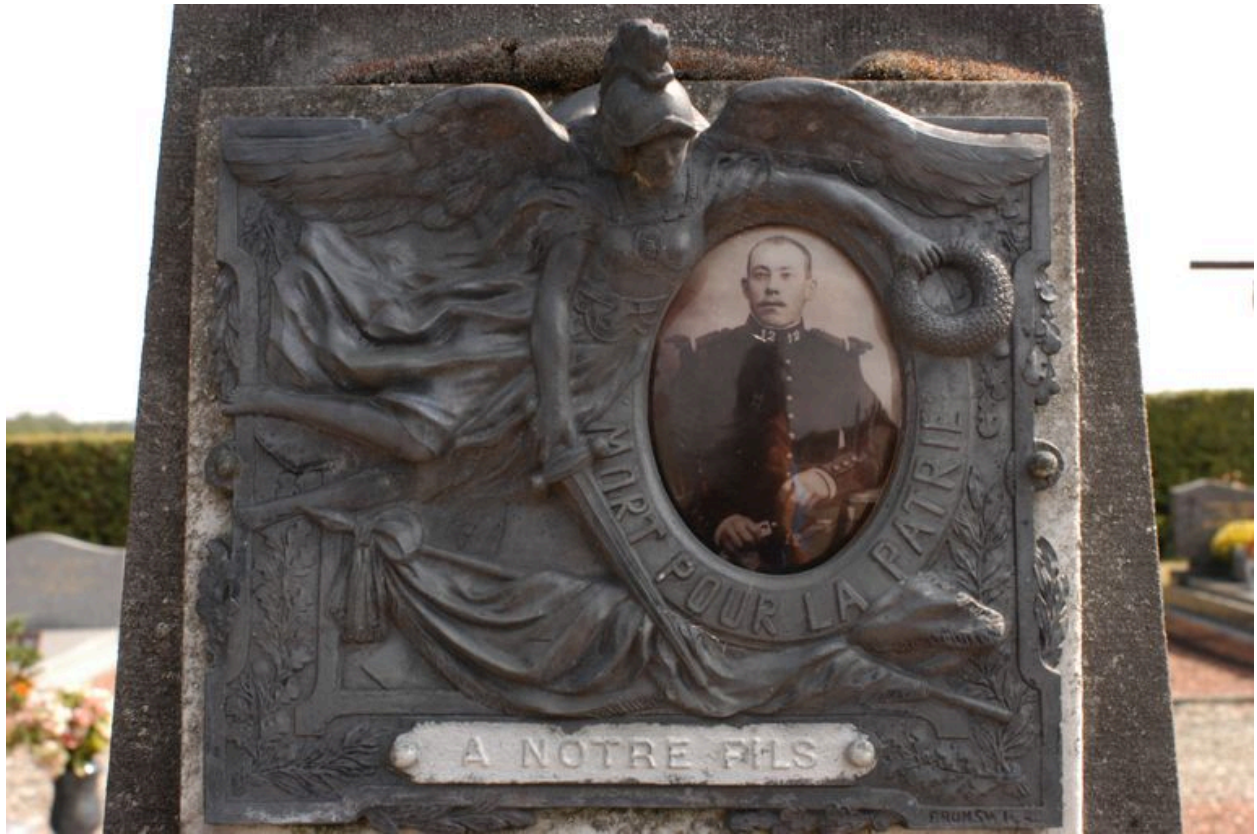
Détail sur le cadre orné et la photographie.