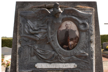
Détail sur le cadre orné et la photographie. IVR22_20038000856NUCA