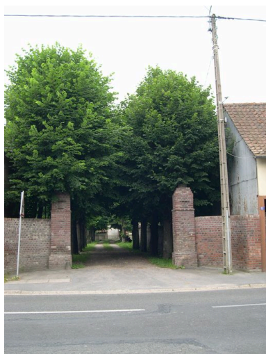
Allée d'accès depuis la rue de Conty.