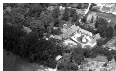
Vue aérienne.