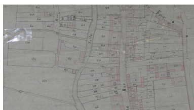
Extrait du cadastre napoléonien. IVR22_20048010418NUCA