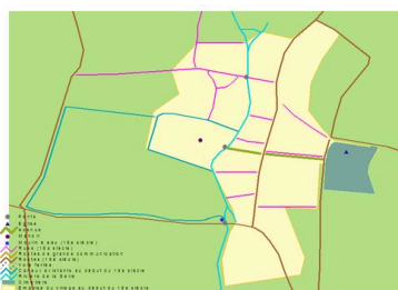
Plan schématique des circulations entre le manoir et l'église.