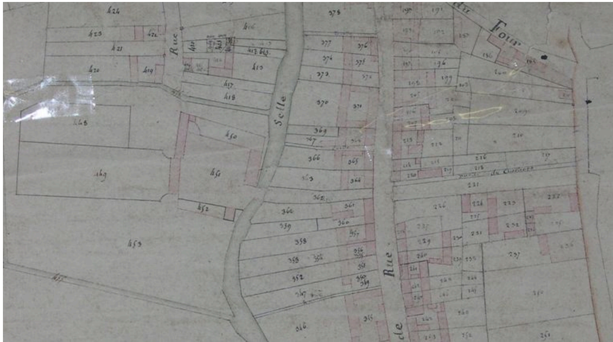
Extrait du cadastre napoléonien.

IVR22_20048010418NUCA Auteur de l'illustration : Isabelle Barbedor (c) Région Hauts-de-France - Inventaire général reproduction soumise à autorisation du titulaire des droits d'exploitation