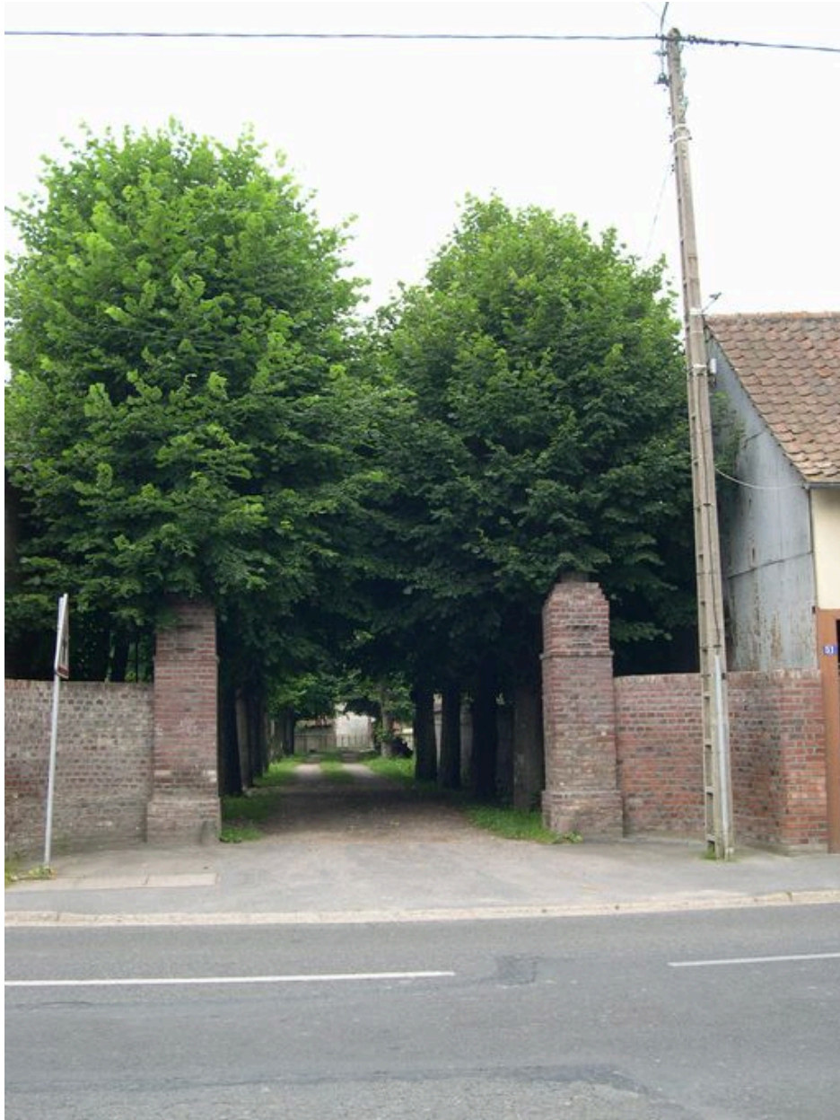
Allée d'accès depuis la rue de Conty.