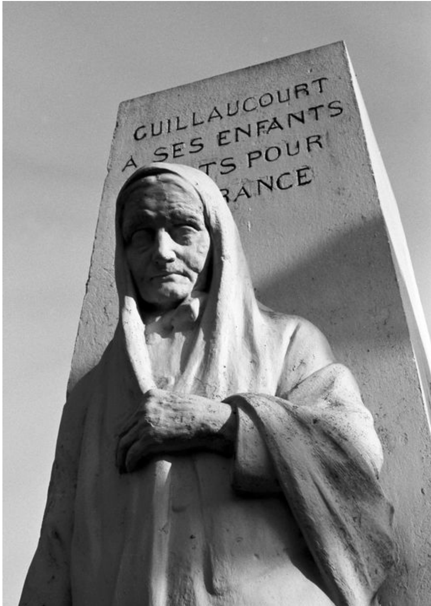
Détail de la statue.