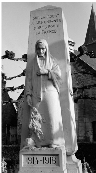
Vue générale. IVR22_19968000036Z