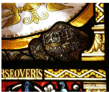
Détail : signature.

IVR22_20058001916NUCA