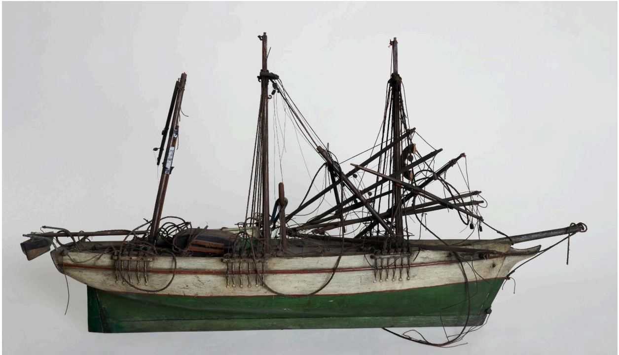
Vue générale, proue vers la droite.