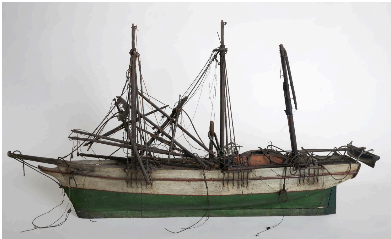
Vue générale, proue vers la gauche.