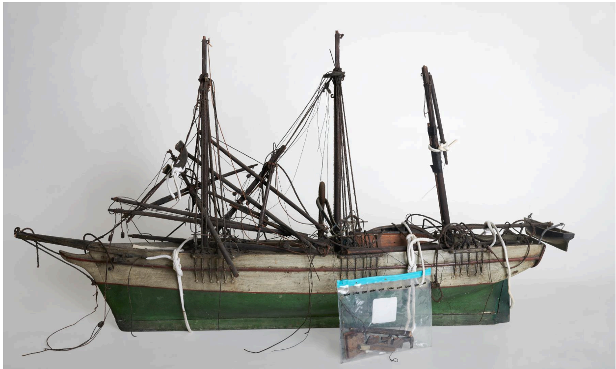
Vue générale avec les cordes retenant les parties fragilisées de la maquette.