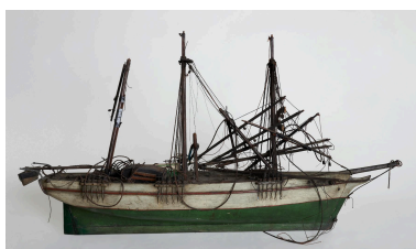
Vue générale, proue vers la droite.