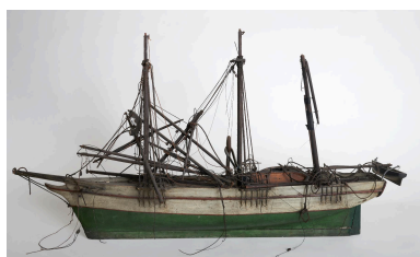
Vue générale, proue vers la gauche.