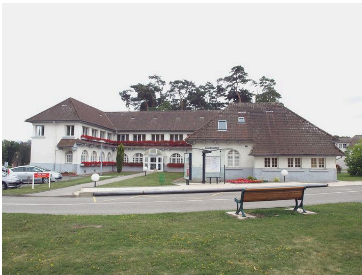
Bâtiments administratifs : architecture du début des années 1930