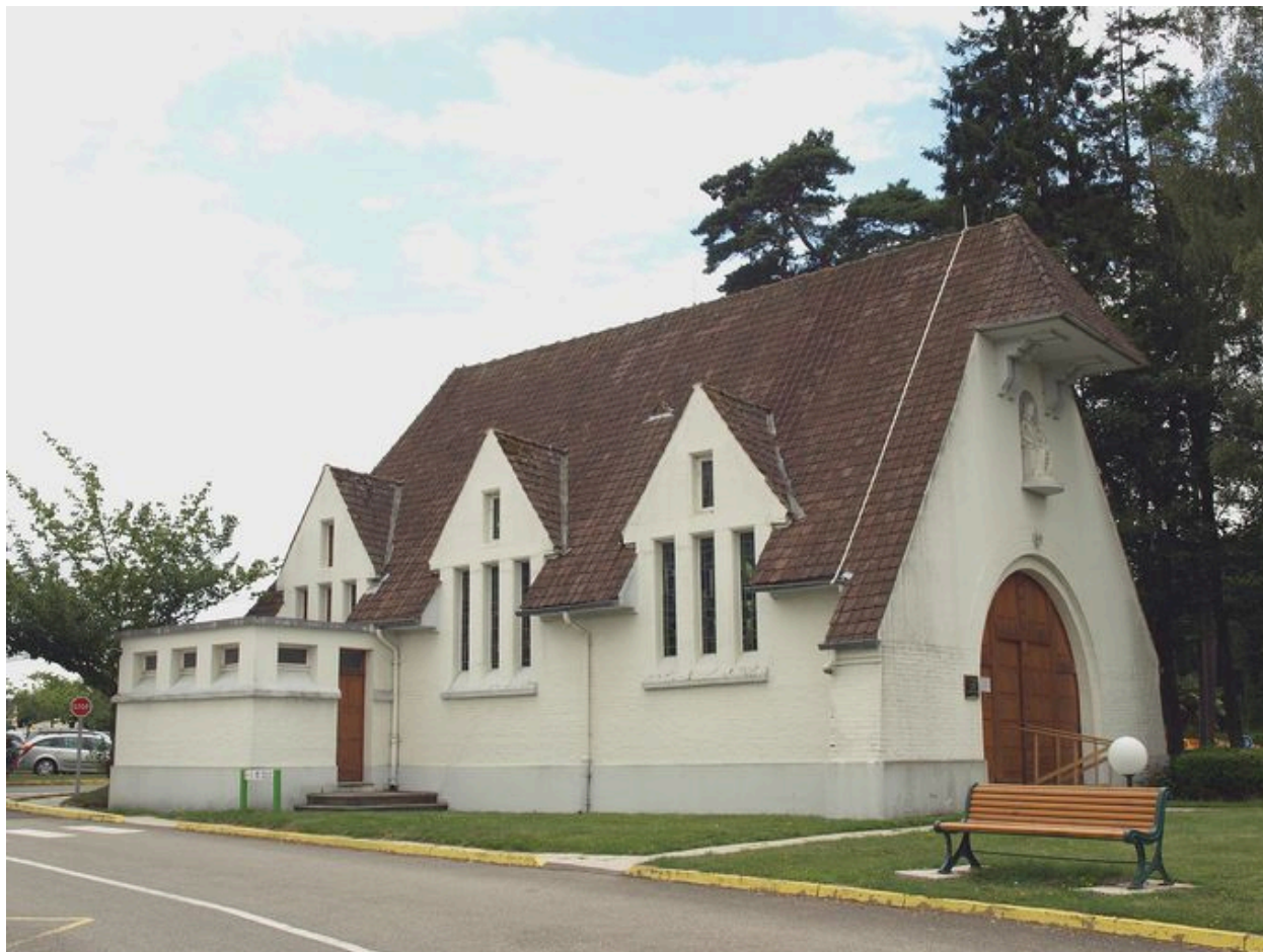
Chapelle, vue latérale