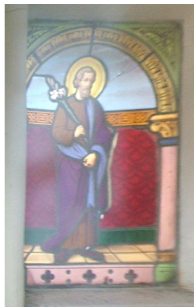
Verrière : Saint Joseph à la fleur de lys.