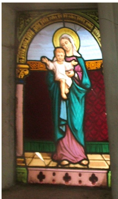
Verrière : Vierge à l'Enfant. IVR22_20108002091NUCA