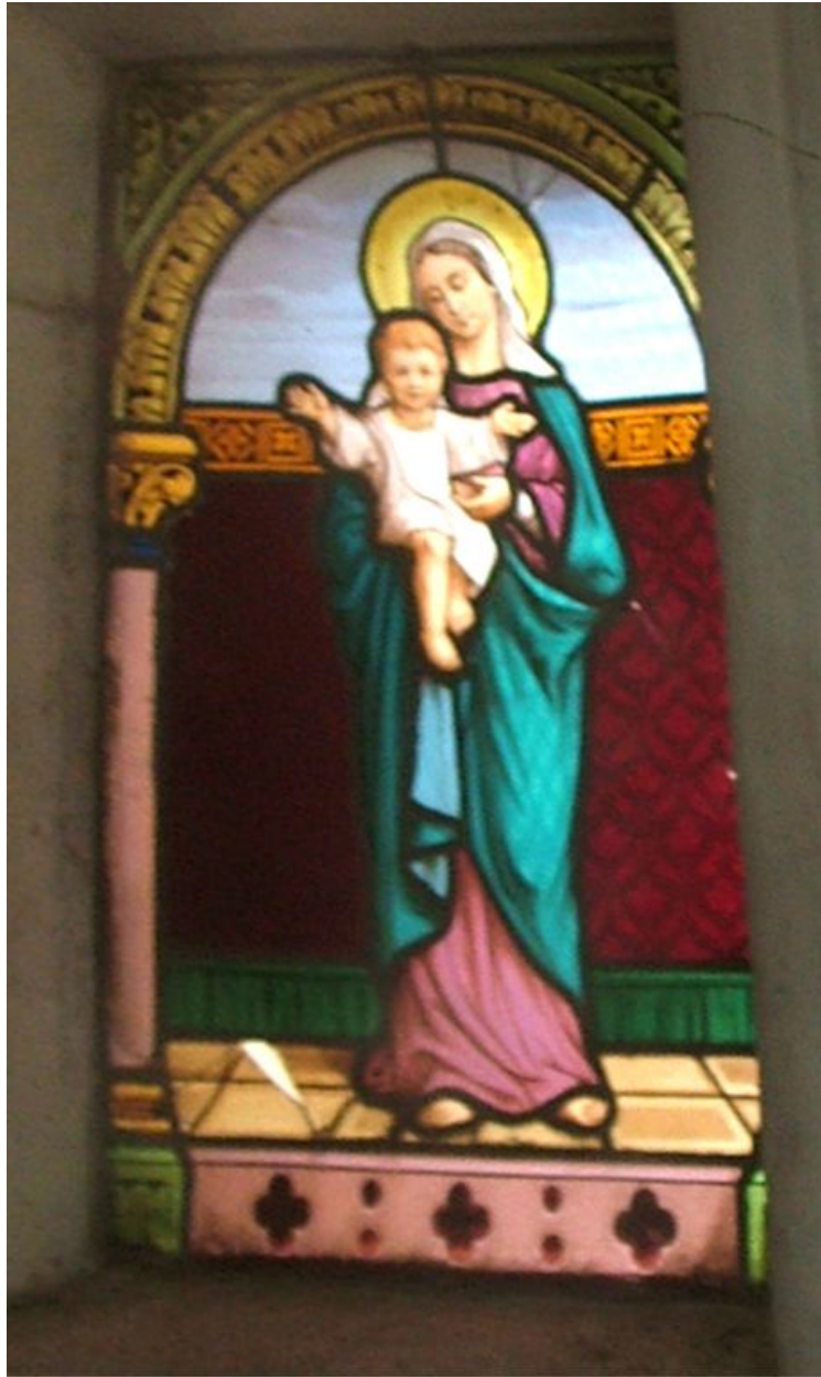
Verrière : Vierge à l'Enfant.