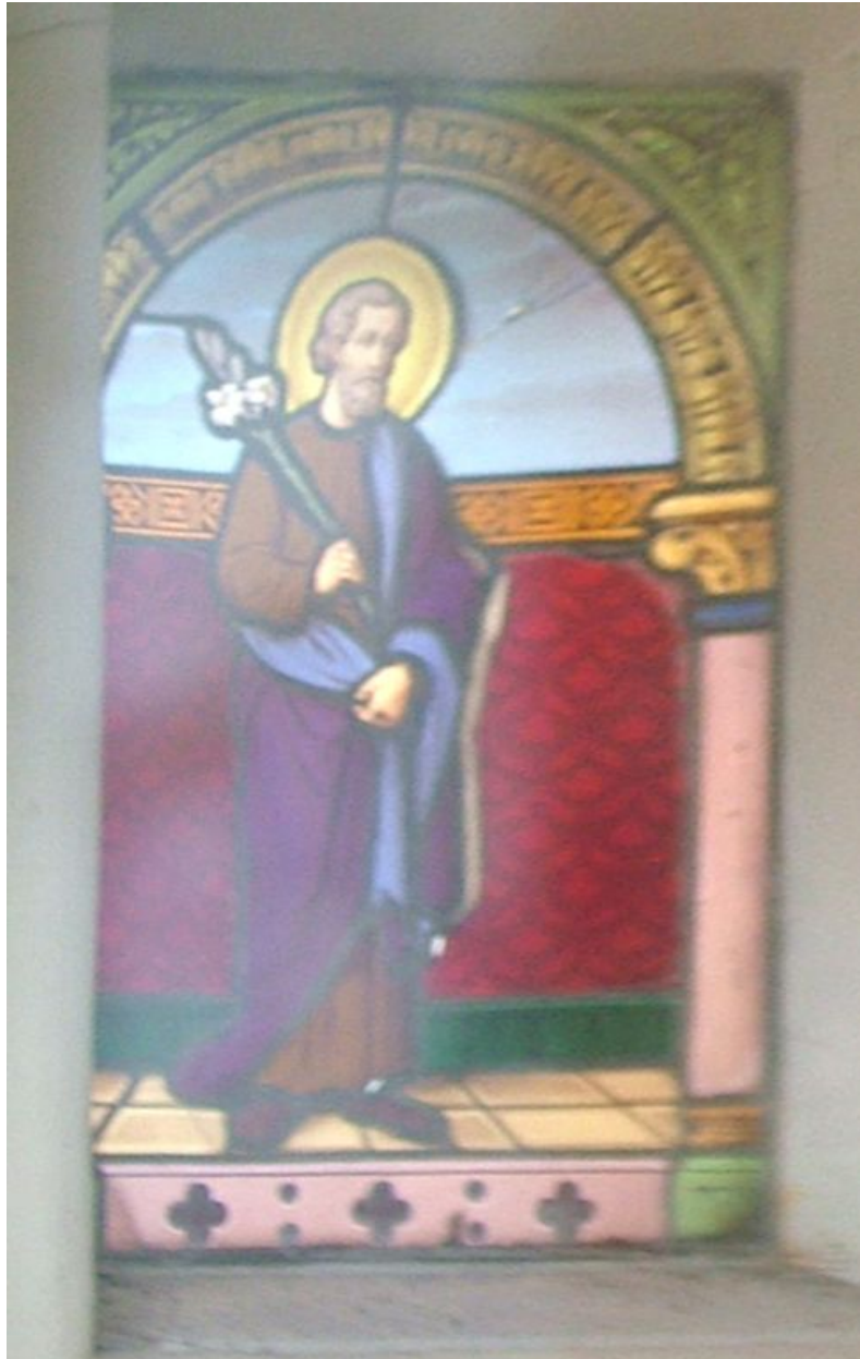
Verrière : Saint Joseph à la fleur de lys.