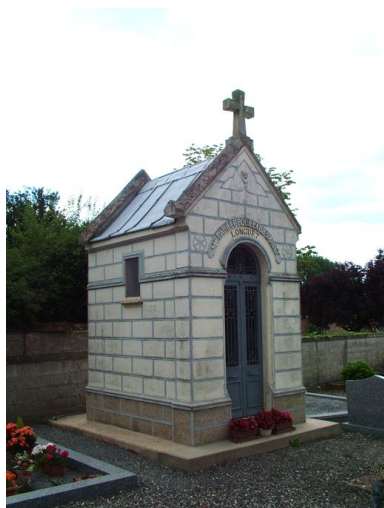
Vue générale. IVR22_20108002090NUCA