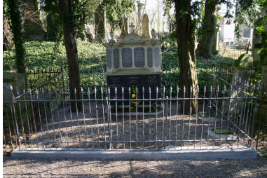
Vue générale. IVR22_20098000952NUCA