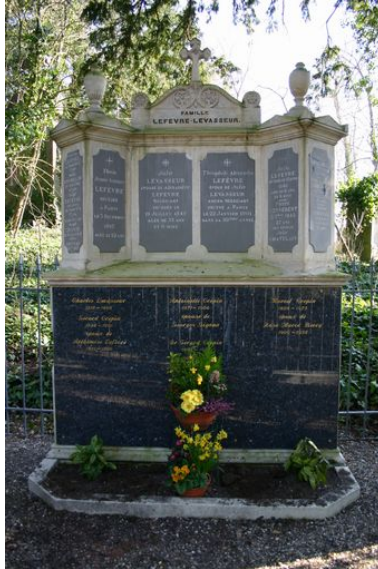
Stèle architecturée.