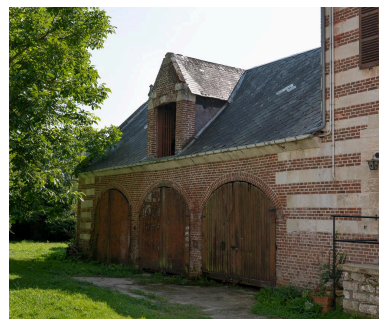
Remise agricole vue depuis l'ouest. IVR32_20216000983NUCA