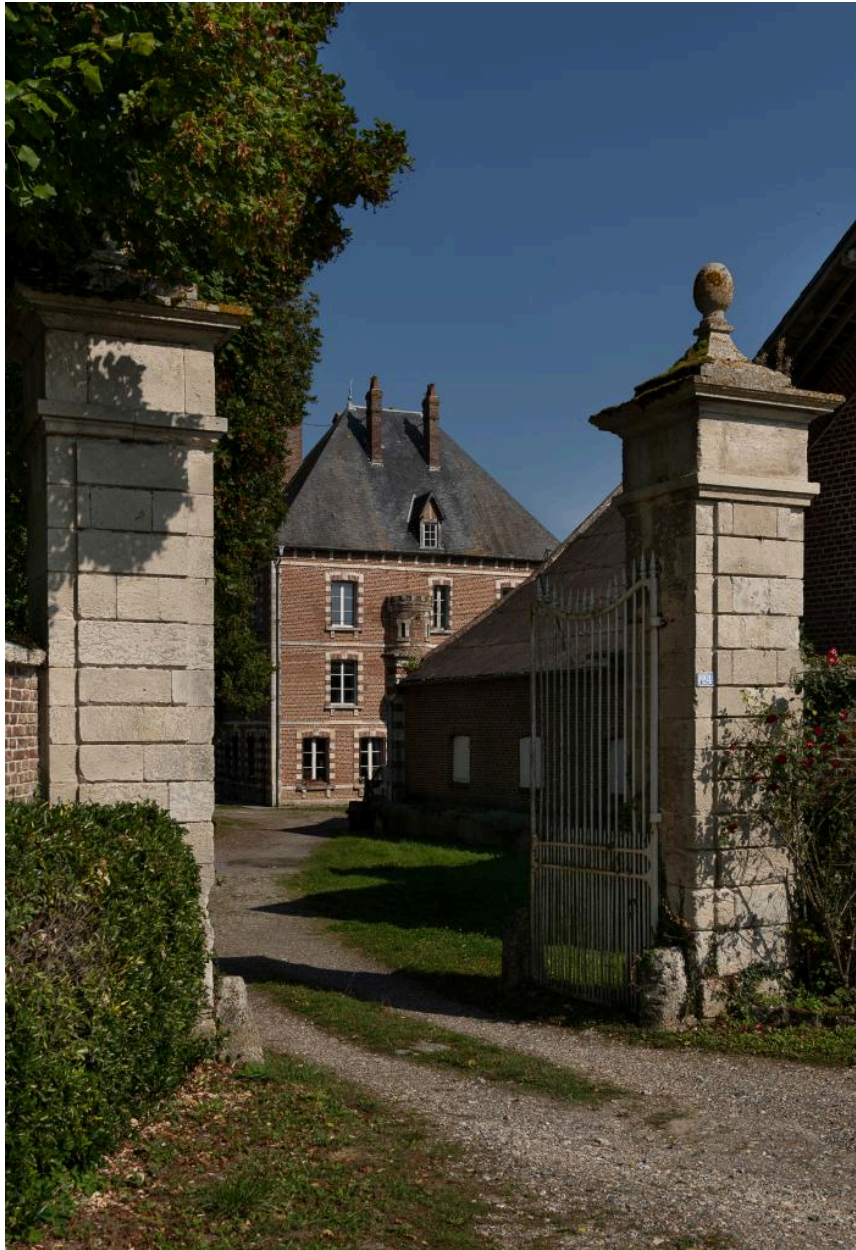
Portail d'entrée côté ferme, vue depuis le sud.