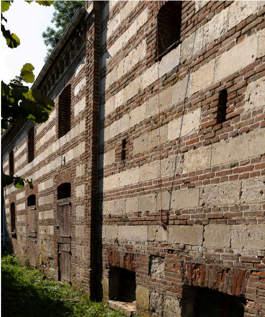
Anciennes étable et écurie vues depuis le nord-est.