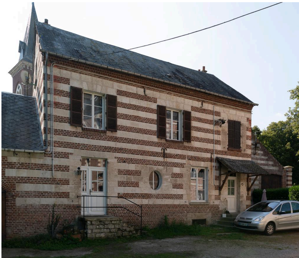
Ancien logement du responsable de ferme vu depuis le nord.