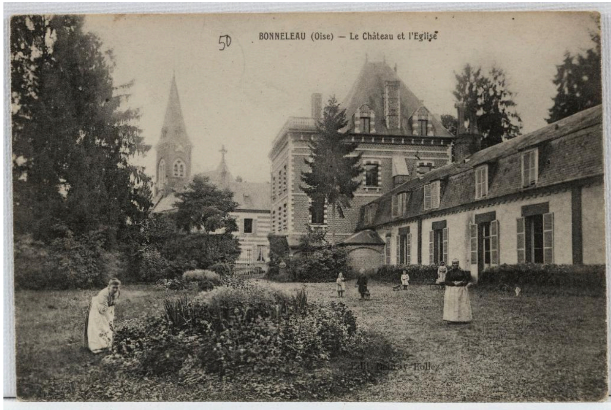
Bonneleau (Oise). Le château et l'église, carte postale, éd. Debray-Bollez, [1er quart du 20e siècle] (coll. part.).