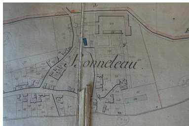
Bonneleau. Cadastre dit napoléonien, section A, feuille 2, 1833 (EDT 390/1 G 1). IVR32_20216005107NUCA