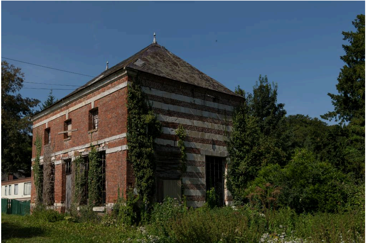
Orangerie vue depuis l'est.