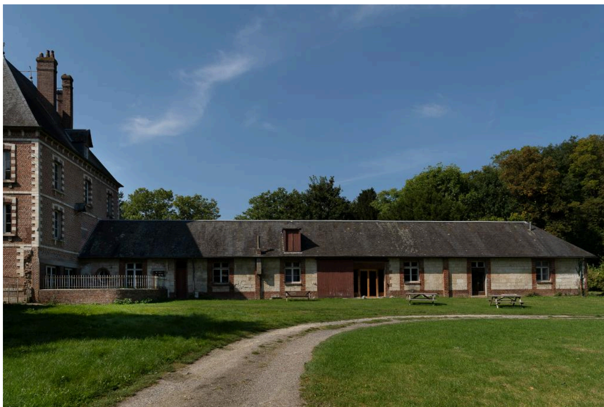
Vue du logis depuis l'est.