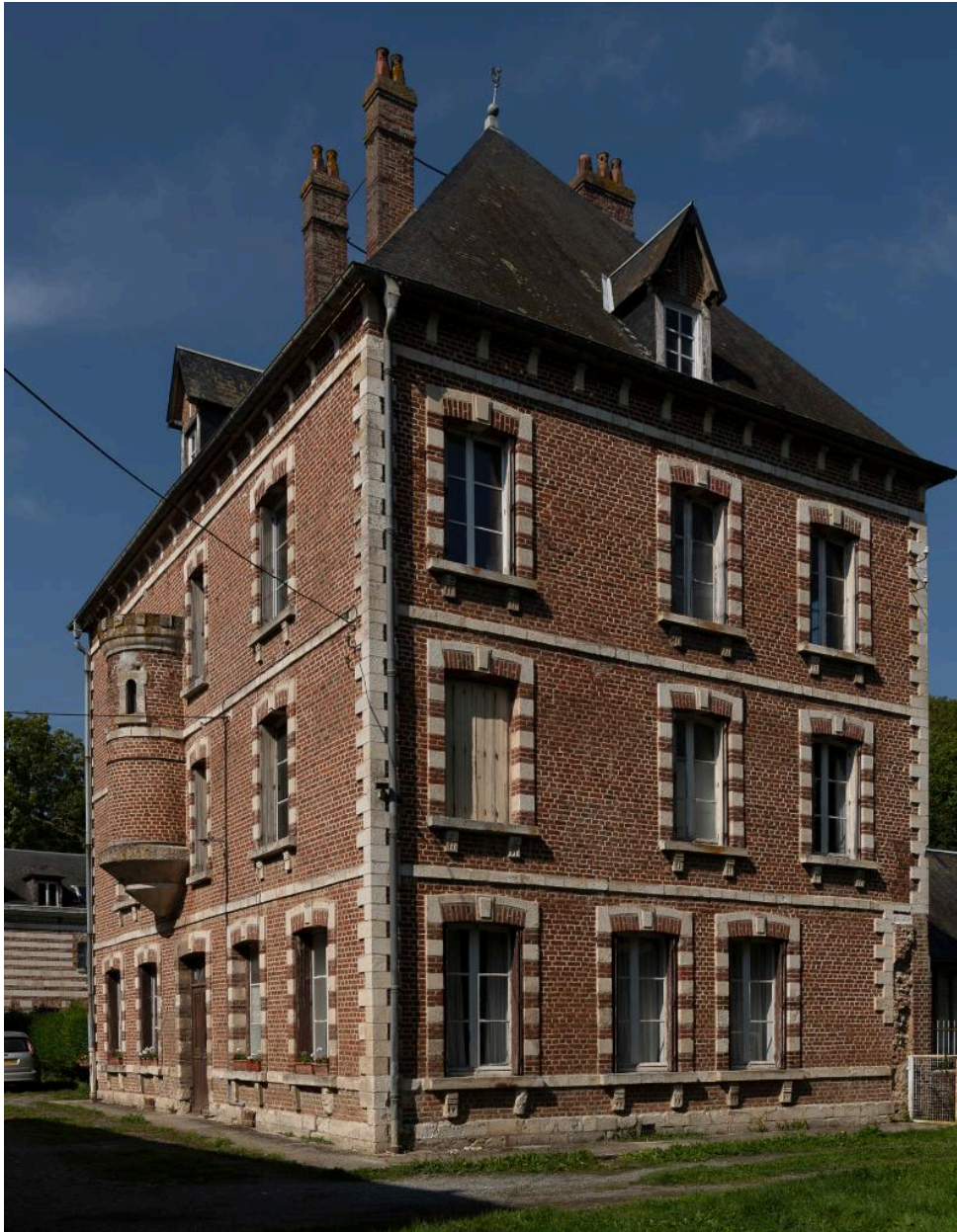
Vue du pavillon sud depuis l'est.