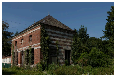
Orangerie vue depuis l'est.