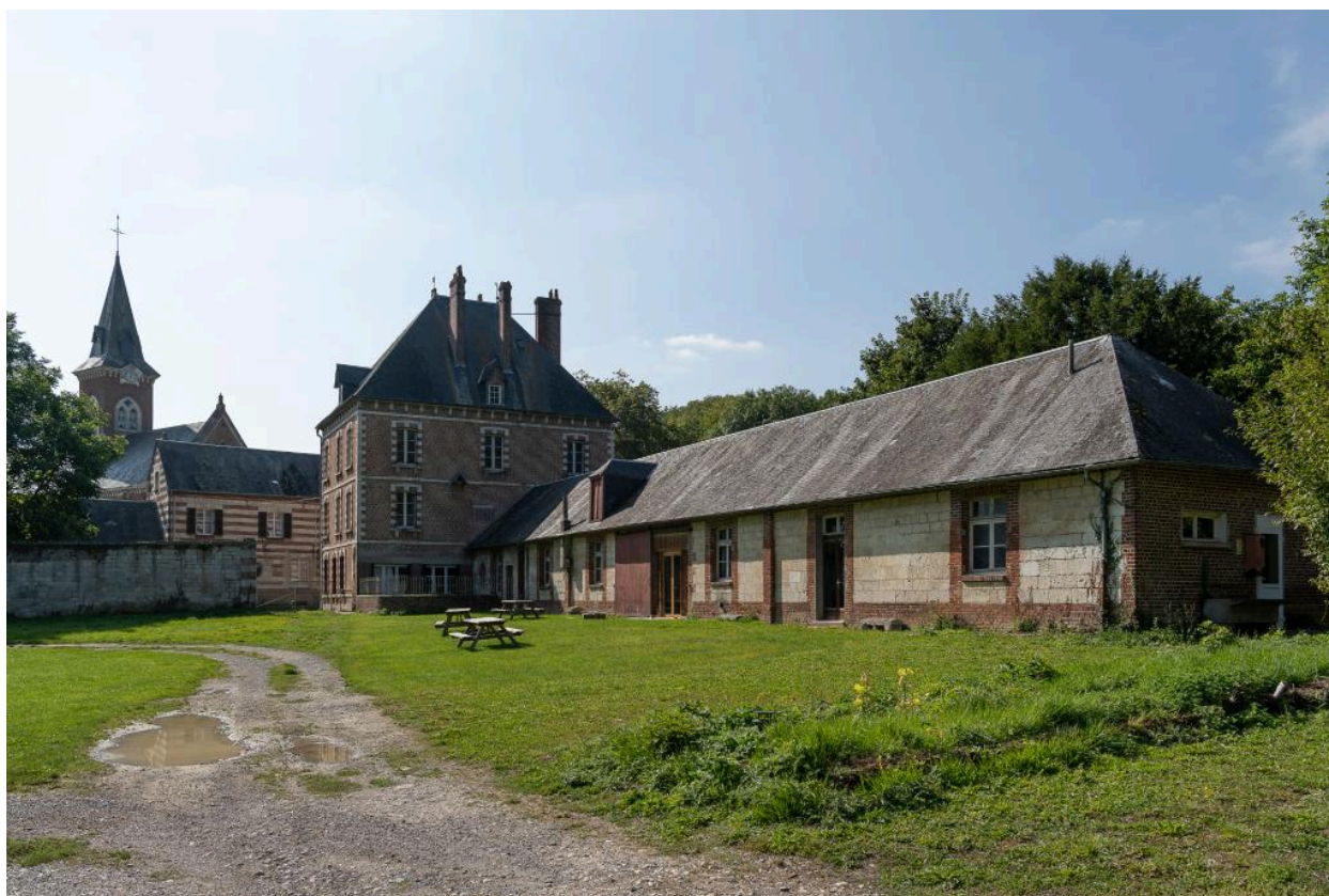
Vue générale du château et de l'église de Bonneleau en arrière-plan.