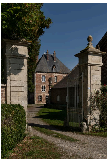
Portail d'entrée côté ferme, vue depuis le sud.