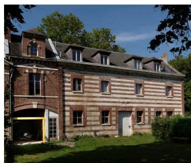
Ancien logement des domestiques vu depuis l'est.