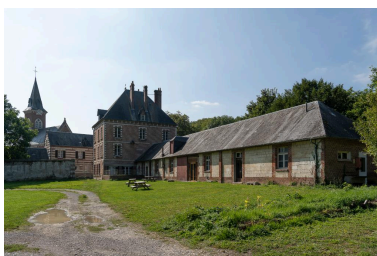
Vue générale du château et de l'église de Bonneleau en arrière-plan. IVR32_20216000989NUCA