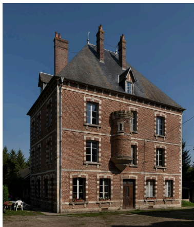
Vue du pavillon sud depuis le sud. IVR32_20216000981NUCA