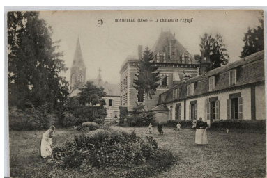
Bonneleau (Oise). Le château et l'église, carte postale, éd. Debray-Bollez, [1er quart du 20e siècle] (coll. part.). IVR32_20226000104NUCA