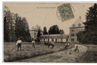
Bonneleau (Oise). Le château, carte postale, éd. inconnu, [vers 1906] (coll. part.). IVR32_20226000103NUCA