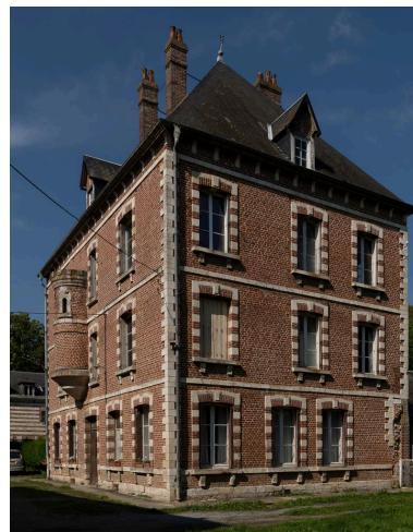
Vue du pavillon sud depuis l'est. IVR32_20216000984NUCA