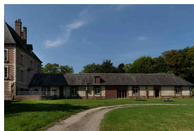
Vue du logis depuis l'est. IVR32_20216000985NUCA