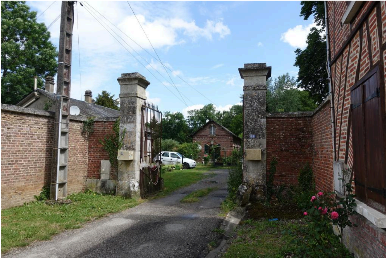
Entrée du château par le parc, vue depuis le sud.