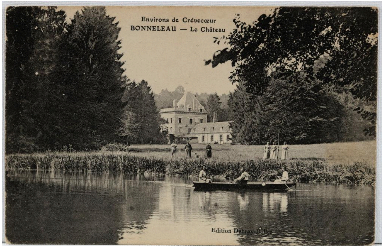
Bonneleau (Oise). Le château, carte postale, éd. Debray-Bollez, [1er quart du 20e siècle] (coll. part.).