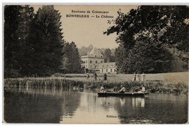
Bonneleau (Oise). Le château, carte postale, éd. Debray-Bollez, [1er quart du 20e siècle] (coll. part.). IVR32_20226000102NUCA