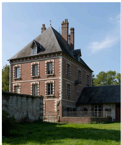
Pavillon sud vu depuis l'est. IVR32_20216000986NUCA