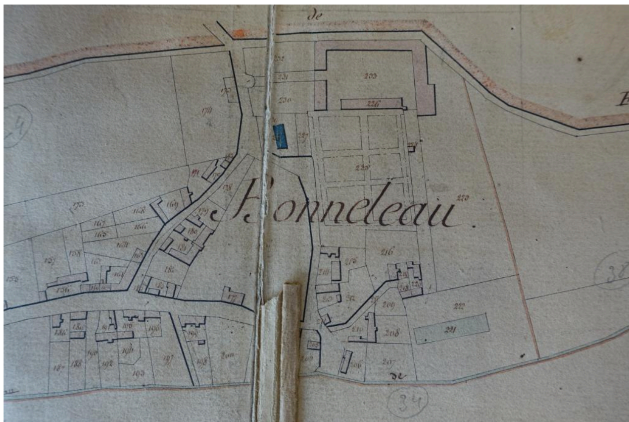
Bonneleau. Cadastre dit napoléonien, section A, feuille 2, 1833 (EDT 390/1 G 1).