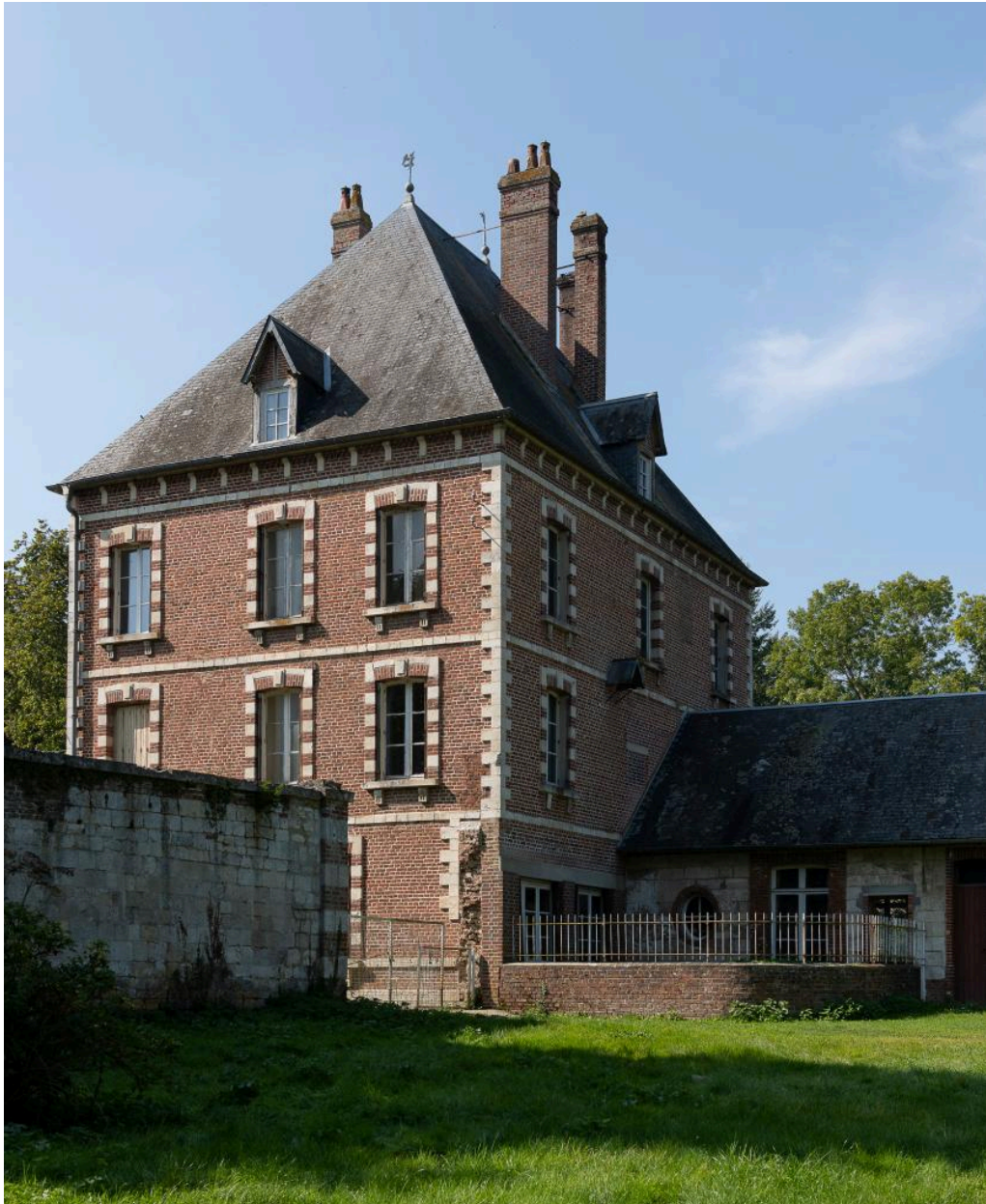
Pavillon sud vu depuis l'est.