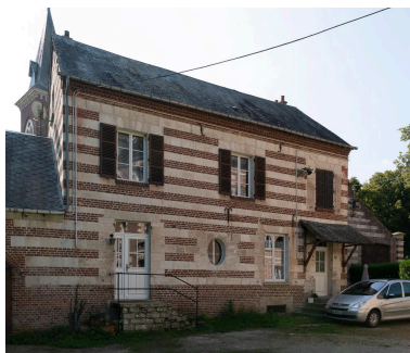
Ancien logement du responsable de ferme vu depuis le nord. IVR32_20216000982NUCA