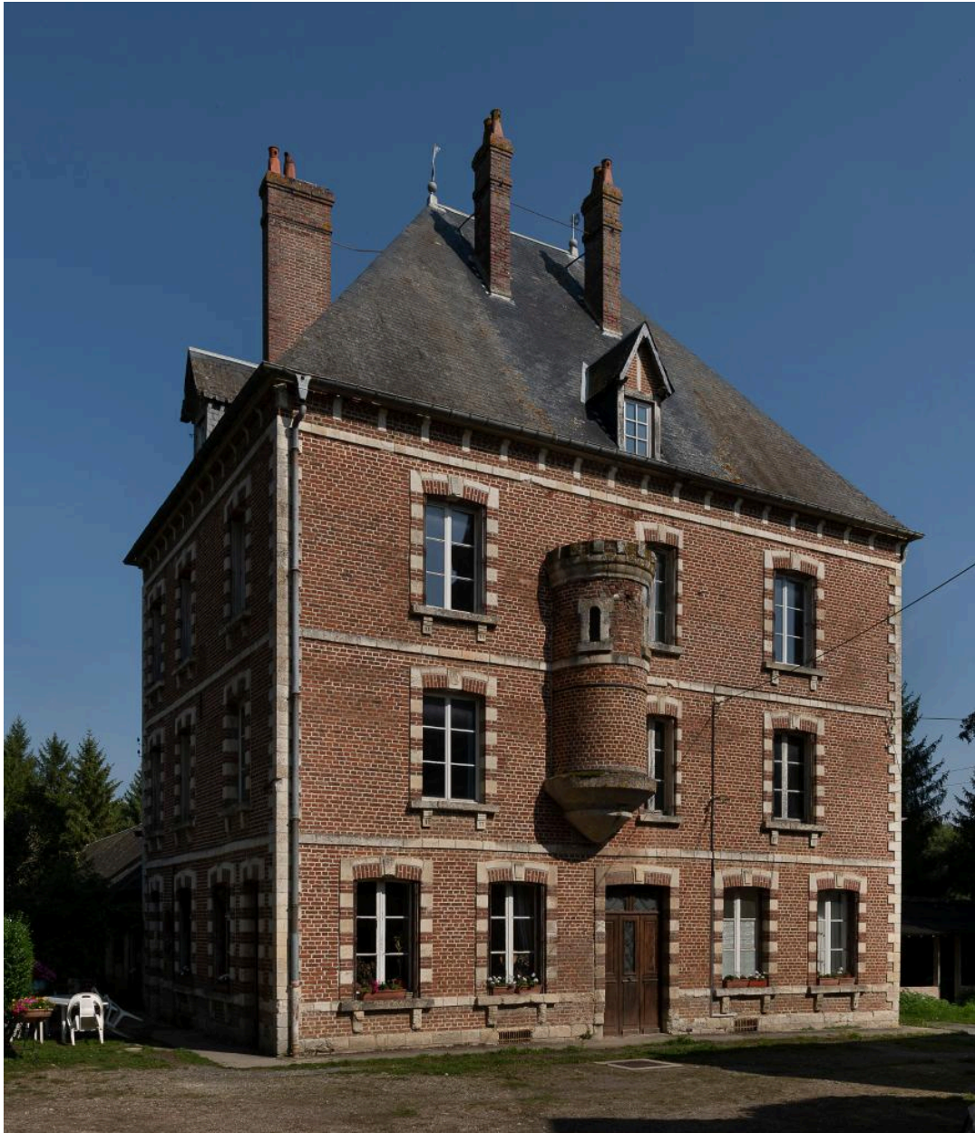
Vue du pavillon sud depuis le sud.