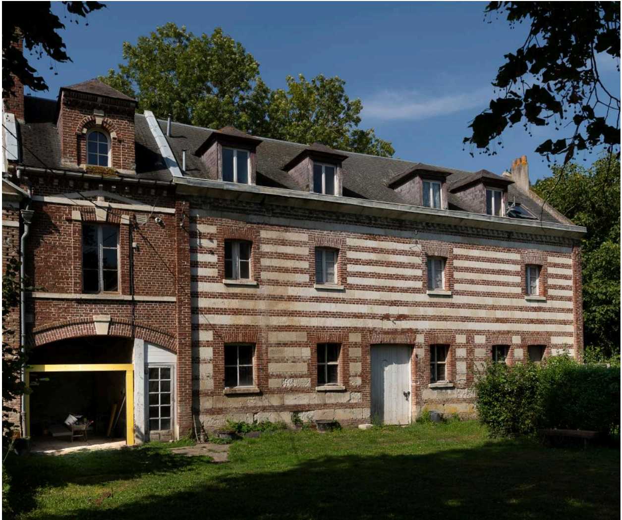
Ancien logement des domestiques vu depuis l'est.