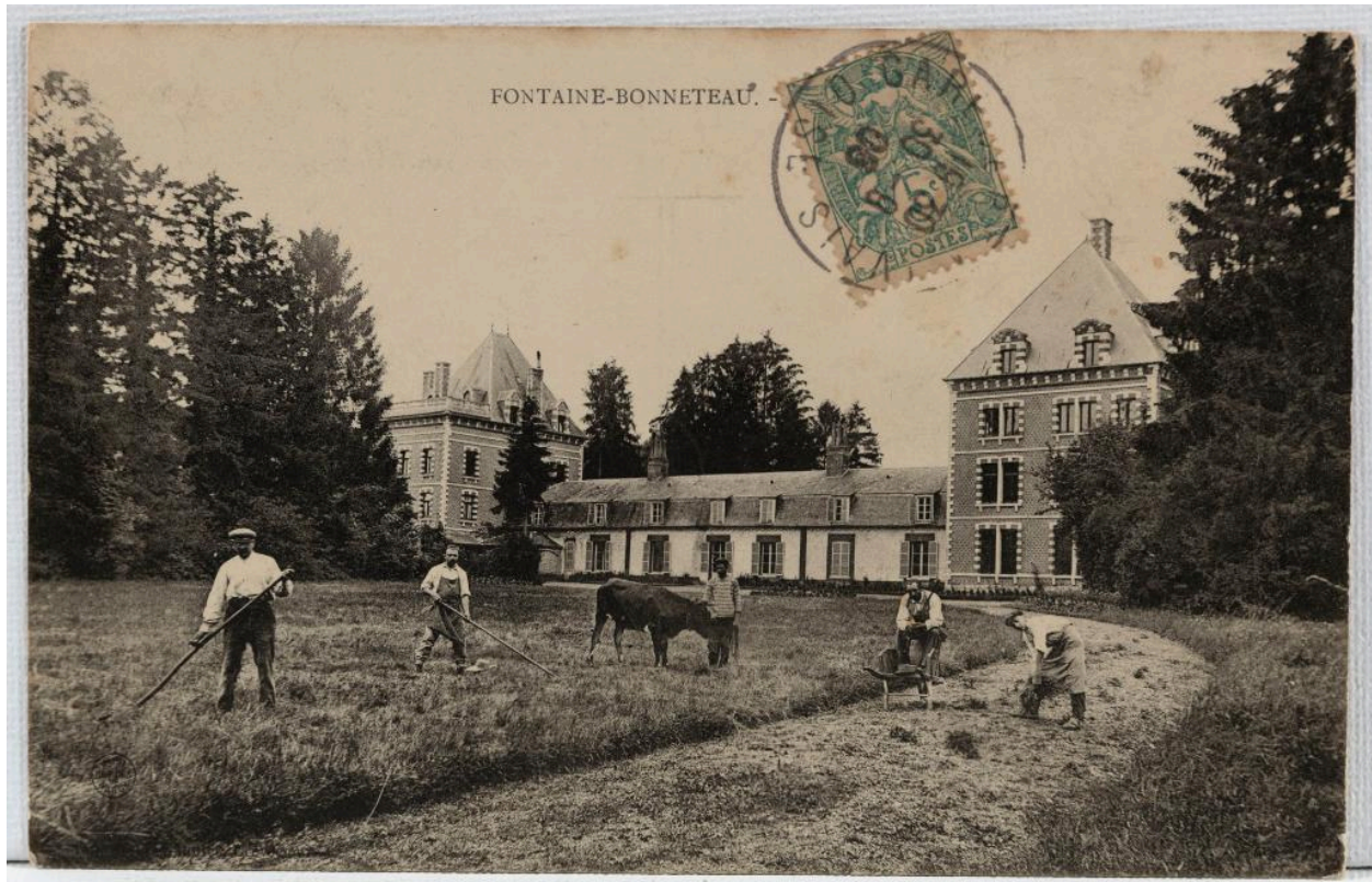
Bonneleau (Oise). Le château, carte postale, éd. inconnu, [vers 1906].