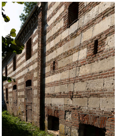
Anciennes étable et écurie vues depuis le nord-est. IVR32_20216000980NUCA