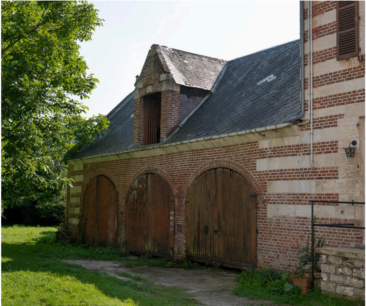
Remise agricole vue depuis l'ouest.