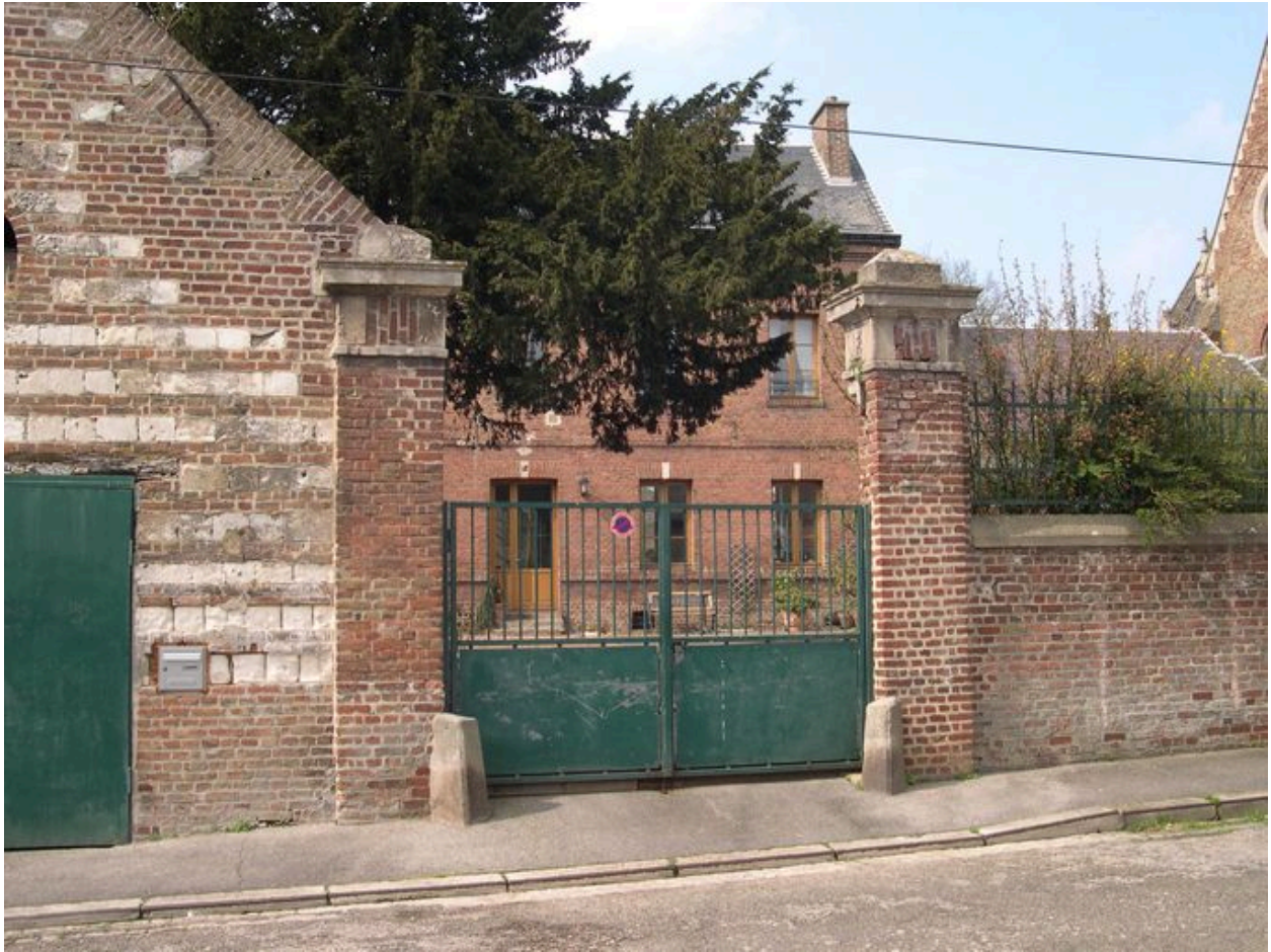
Vue depuis la place André-Battel.