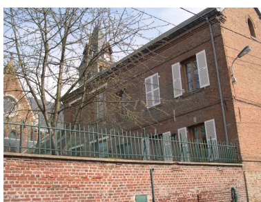
Vue de la façade ouest, depuis la rue des Écoles. IVR22_20058010260NUCA