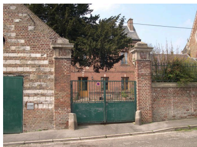
Vue depuis la place André-Battel.