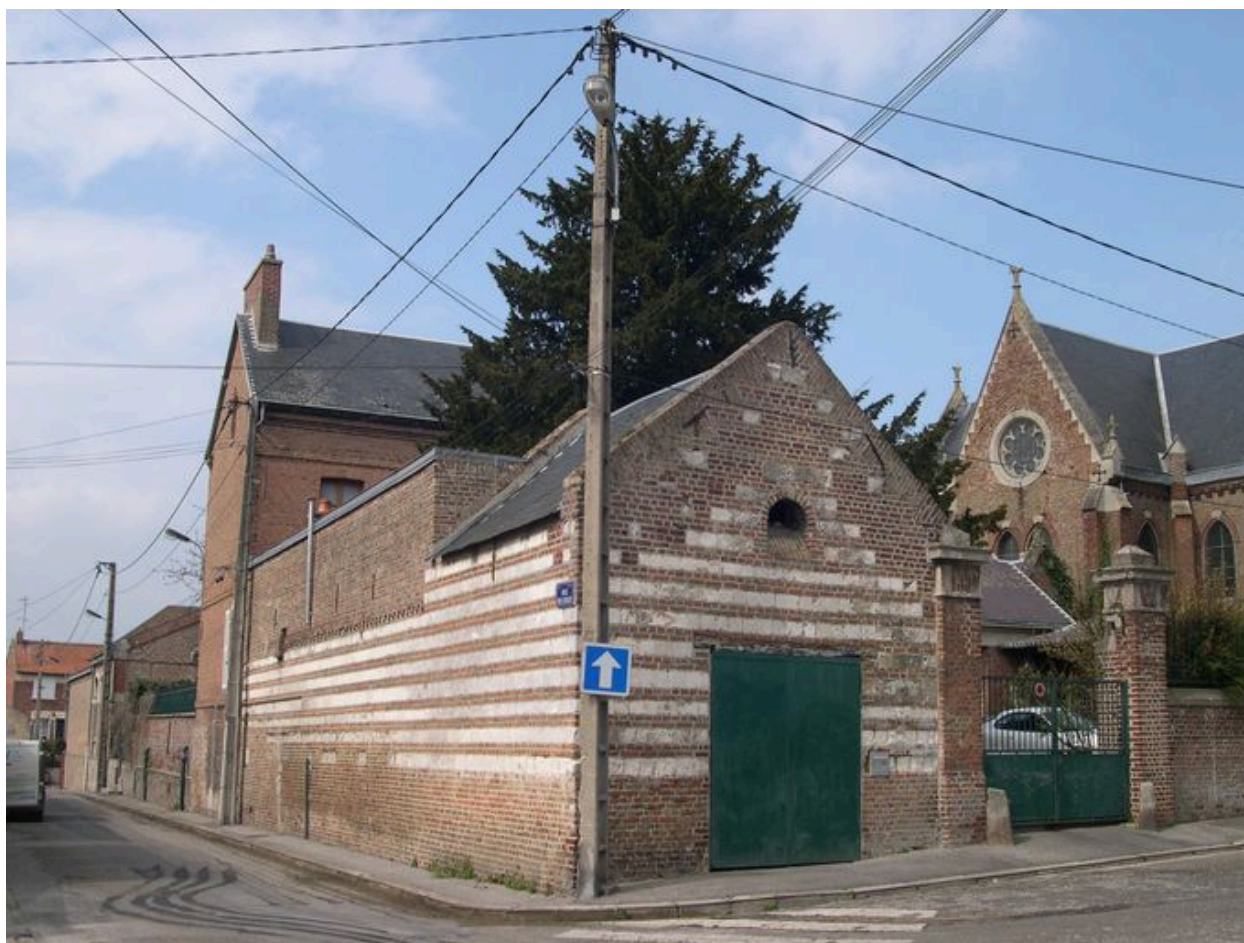
Vue générale, depuis le sud-est.