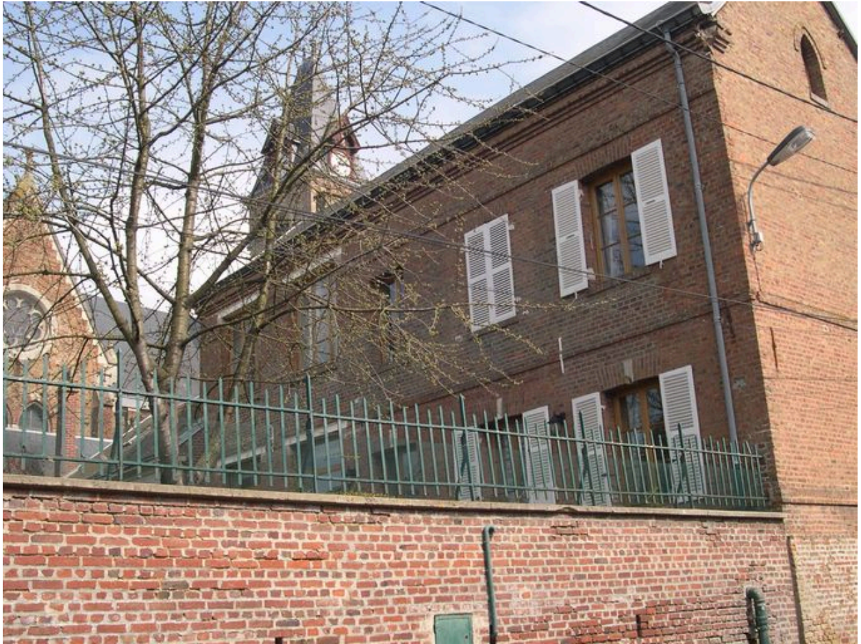
Vue de la façade ouest, depuis la rue des Écoles.