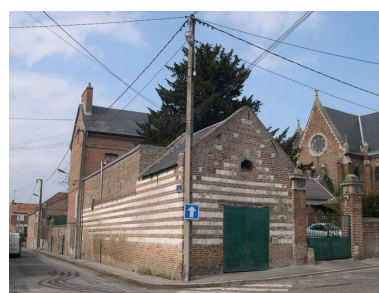
Vue générale, depuis le sud-est. IVR22_20058010258NUCA