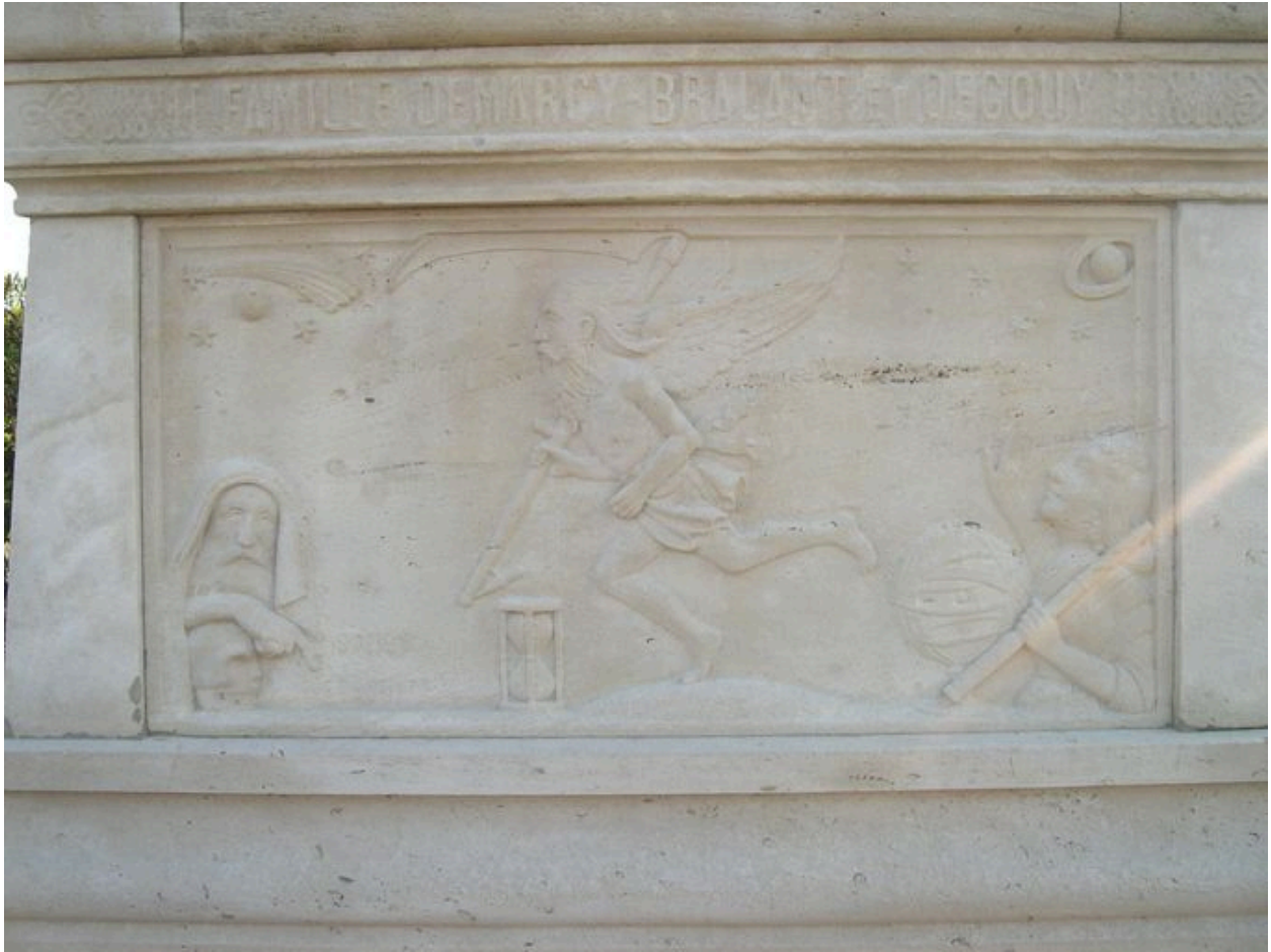
Vue de détail sur la face ouest.