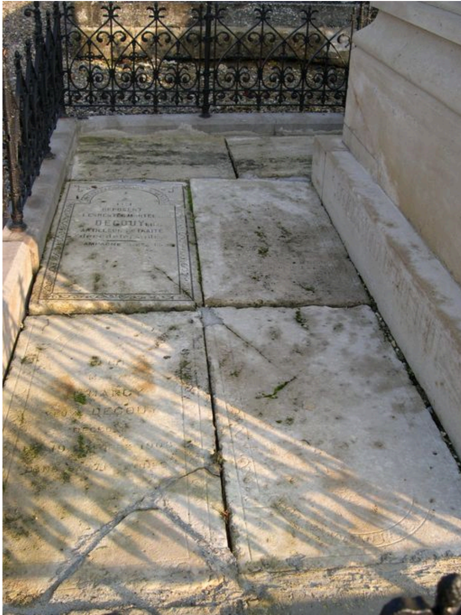
Vue de détail sur les dalles funéraires.