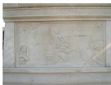
Vue de détail sur la face ouest.