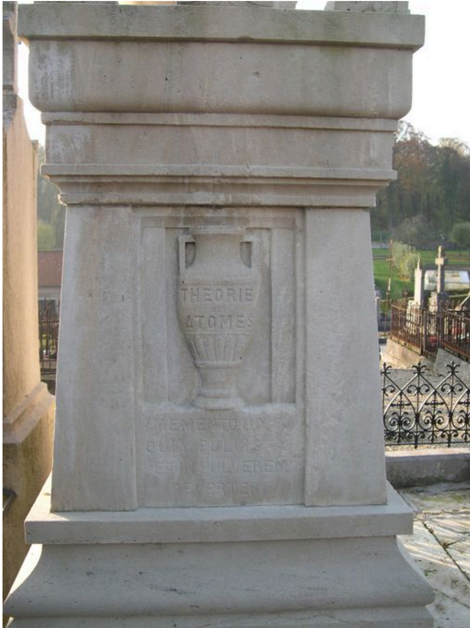
Vue de détail sur la face nord.