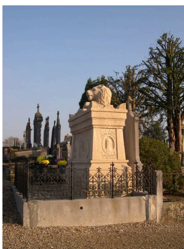
Vue générale, depuis le sud-ouest. IVR22_20048010808NUCA