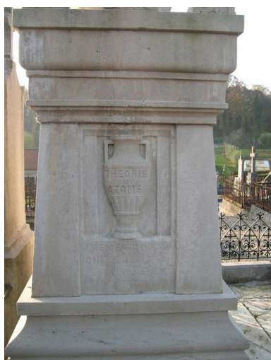
Vue de détail sur la face nord. IVR22_20048010565NUCA