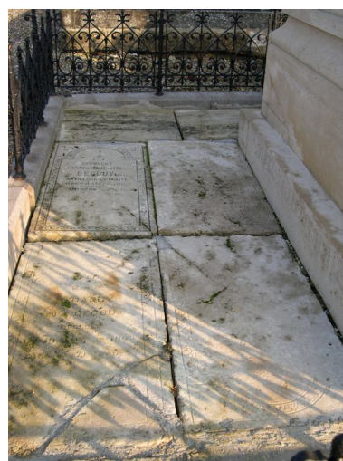
Vue de détail sur les dalles funéraires. IVR22_20048010566NUCA