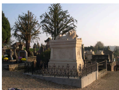
Vue générale. IVR22_20048010562NUCA