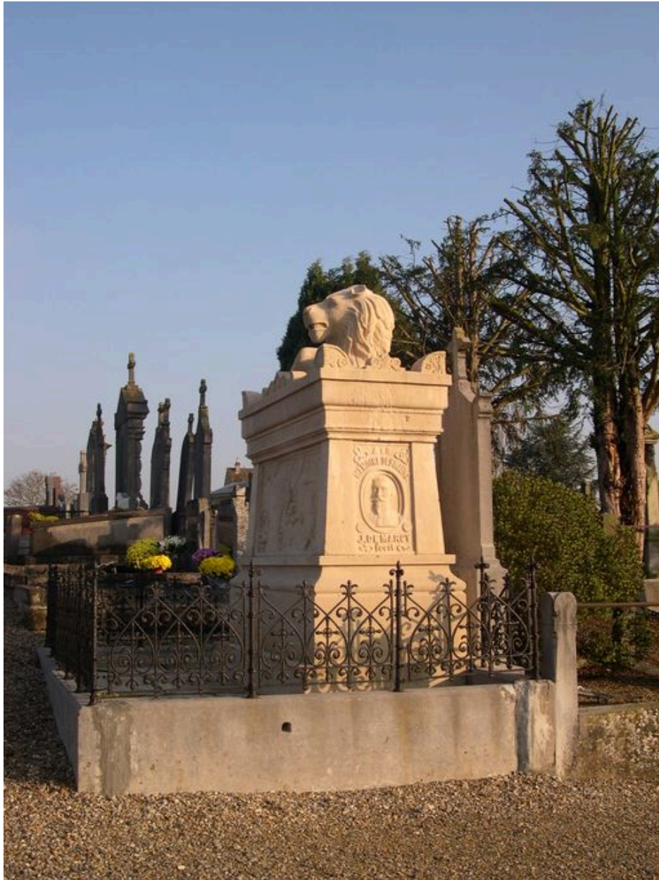
Vue générale, depuis le sud-ouest.