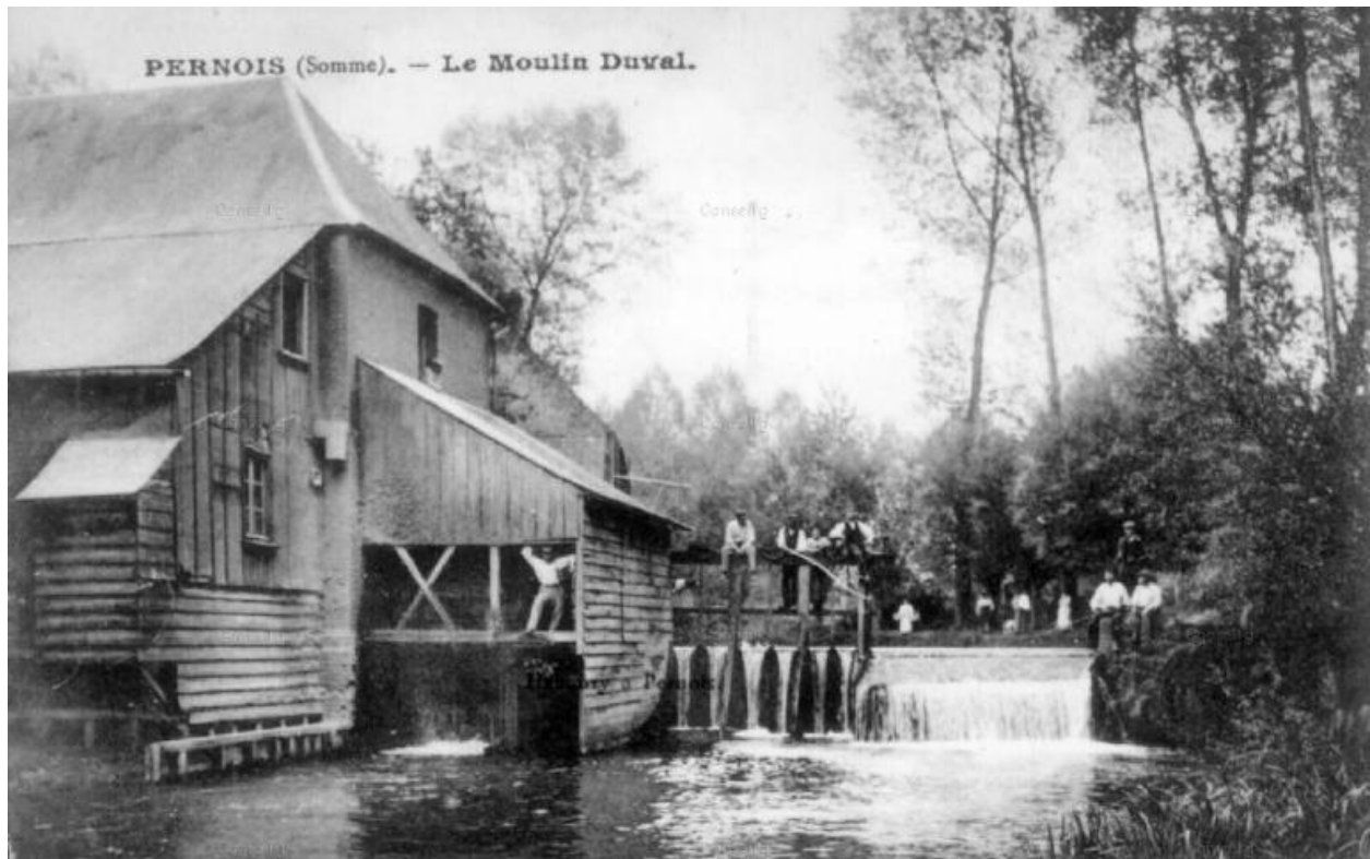
Le moulin et la chute d'eau, début du 20e siècle.