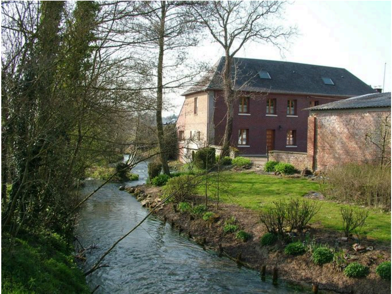
Vue générale des bâtiments de l'ancien moulin depuis la Nièvre.