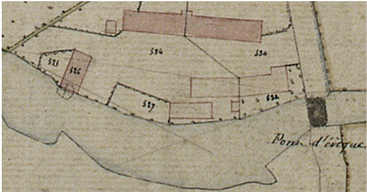
Extrait du cadastre napoléonien, section B, par Carette, 1832 (AD Somme ; 3 P 1447/4).