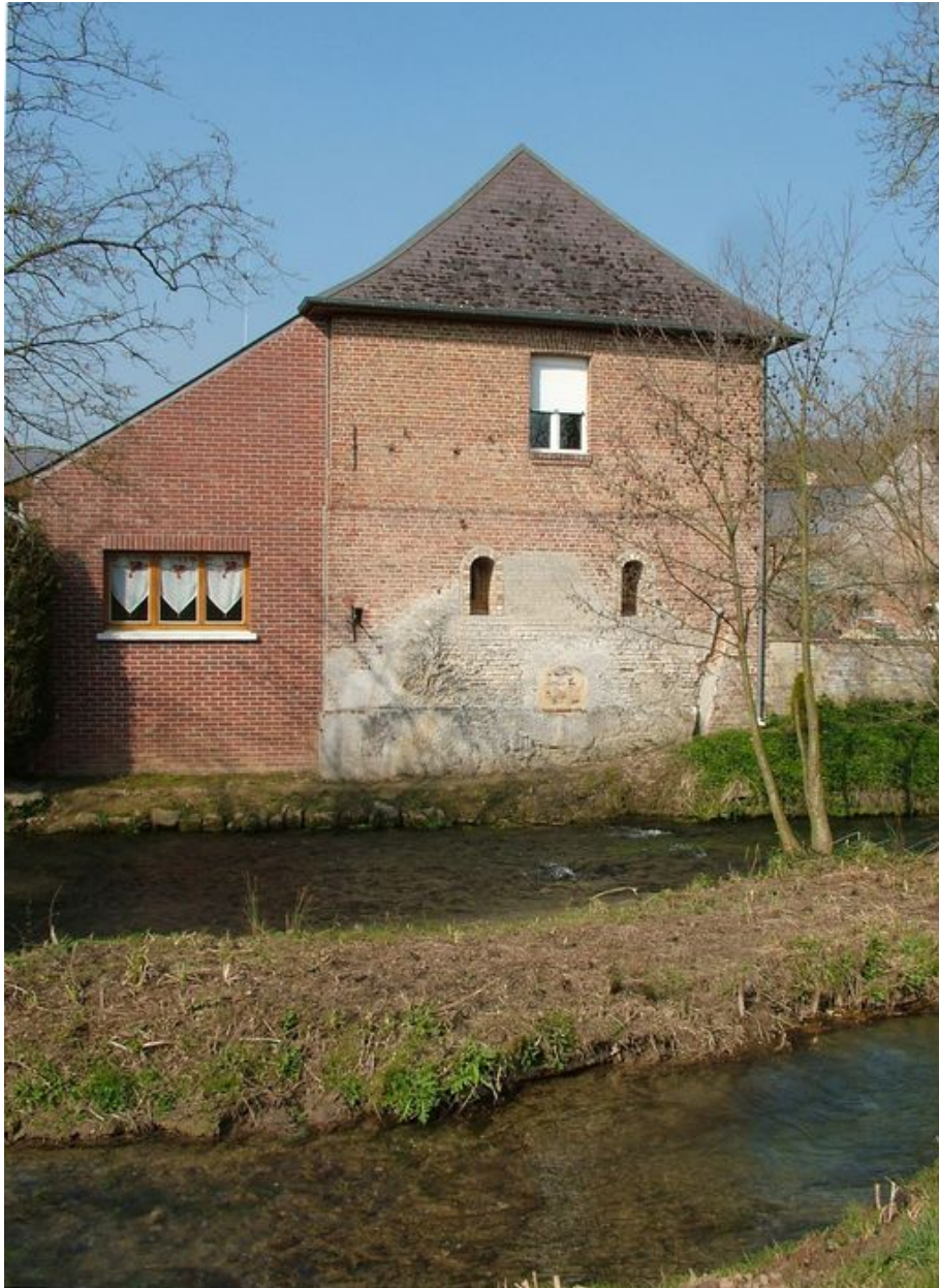
Mur de croupe de l'ancien moulin portant la trace de l'ancienne roue hydraulique.