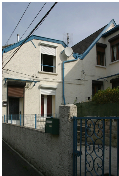
Deux logements de la cour. IVR22_20070205171NUCA