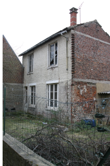
Le logement de la ruelle Sainte-Marguerite.