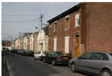
De gauche à droite : la ruelle Sainte-Marguerite, deux logements indépendants, l'entrée de la cour et les six logements en bordure de la rue Denfert-Rochereau.