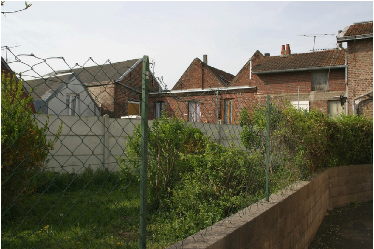
L'ancien jardin de la cour Corbizet (au fond, deux pignons de la cour Wavrans voisine).