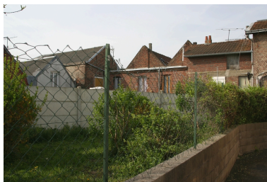
L'ancien jardin de la cour Corbizet (au fond, deux pignons de la cour Wavrans voisine). IVR22_20070205172NUCA