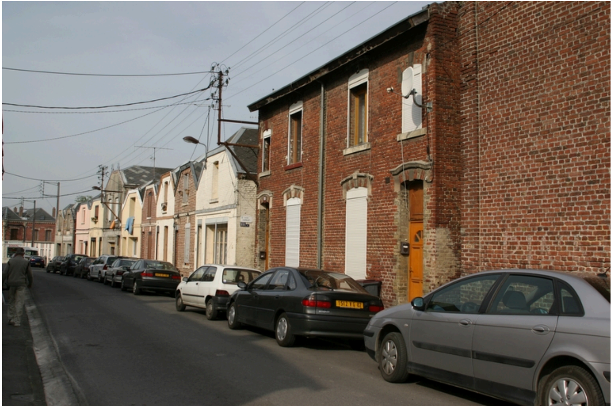
De gauche à droite : la ruelle Sainte-Marguerite, deux logements indépendants, l'entrée de la cour et les six logements en bordure de la rue Denfert-Rochereau.