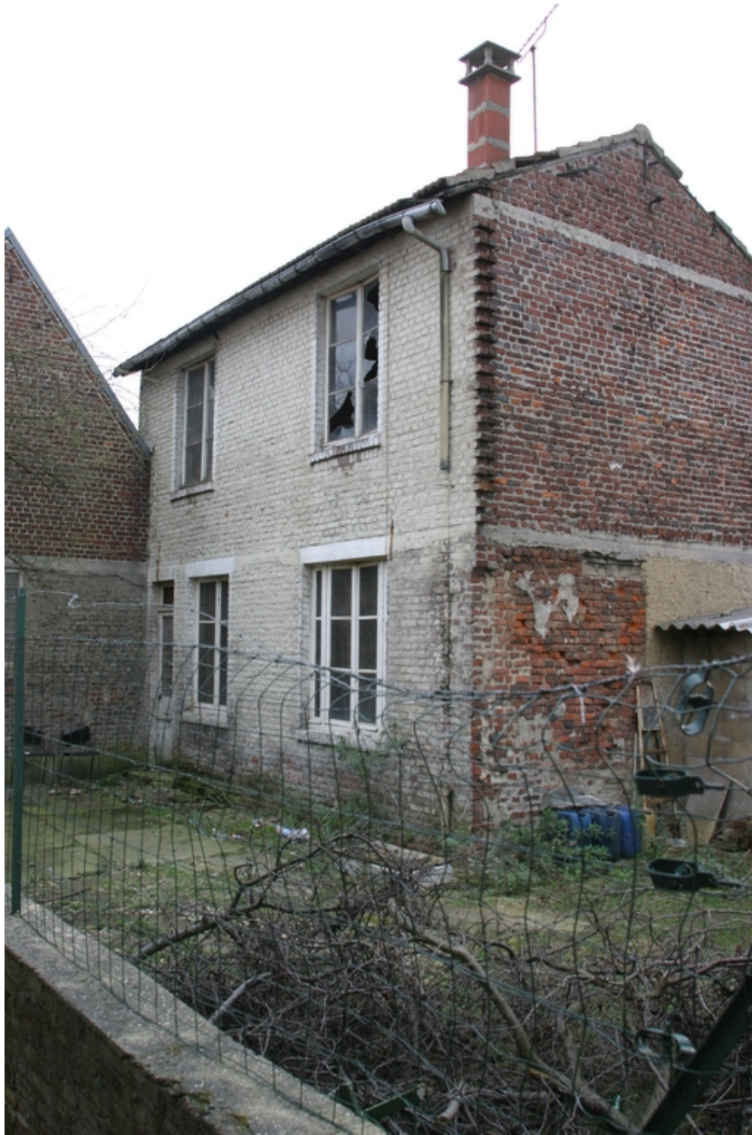
Le logement de la ruelle Sainte-Marguerite.