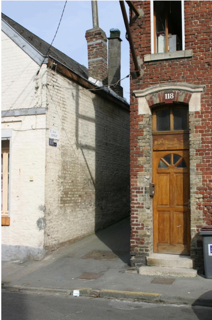
L'entrée de la cour.