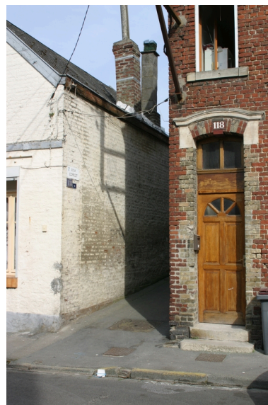
L'entrée de la cour.