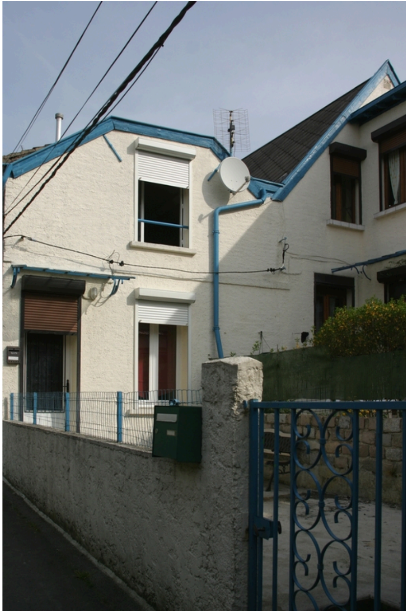
Deux logements de la cour.