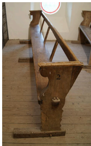
Banc, début 19e siècle (tribune).