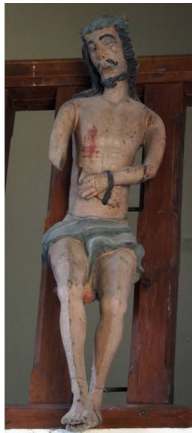
Ecce Homo, statue (petite nature), bois polychromé, 16e ou 17e siècle (garde-corps de la tribune).