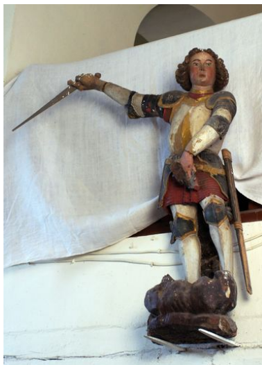
Saint Michel terrassant le démon, statue (petite nature), bois polychromé, 16e ou 17e siècle (garde-corps de la tribune). IVR22_20118000367NUCA