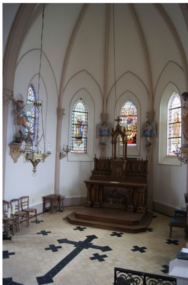
Vue du chœur.

Phot. Marie-Laure Monnehay-Vulliet IVR22_20118000406NUCA