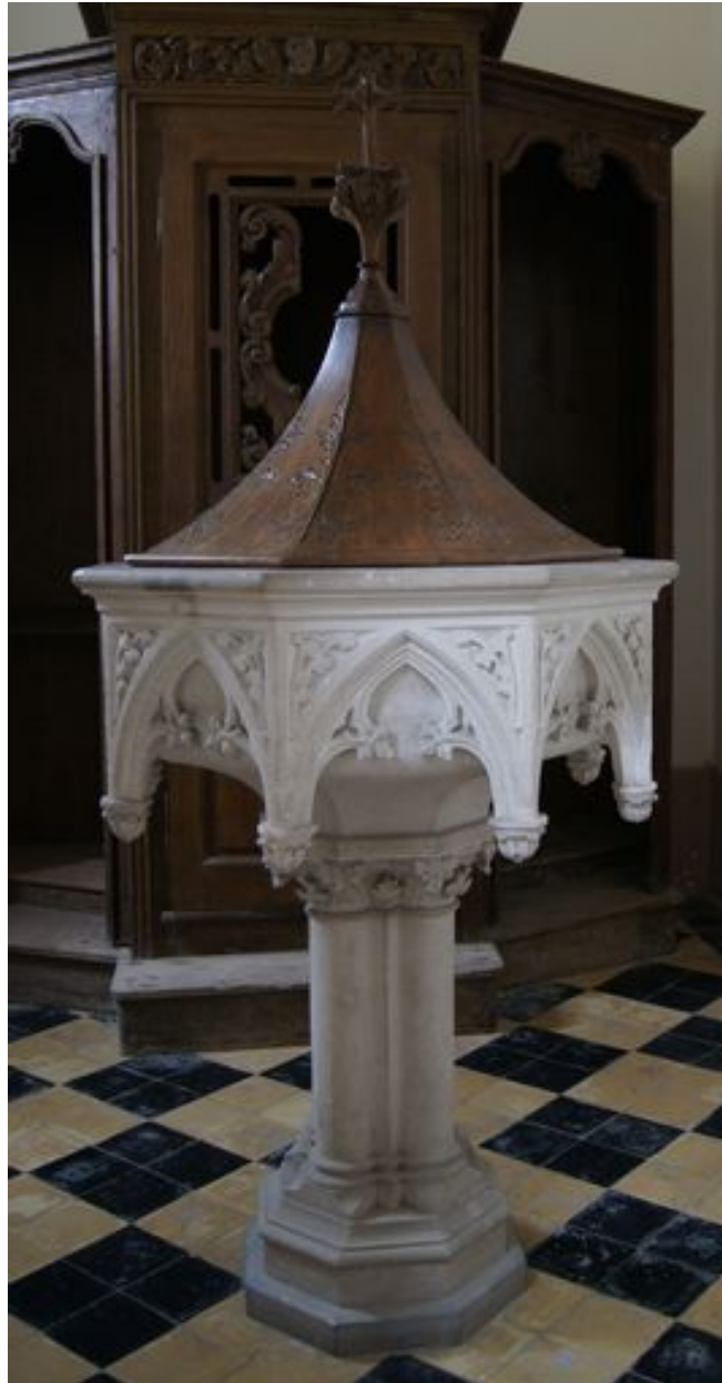
Fonts baptismaux, vers 1899.