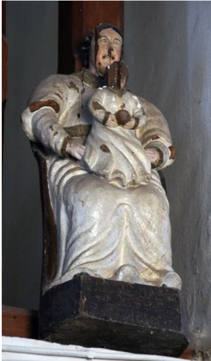
Vierge à l'enfant, dite Notre-Dame de la Joie, statue (petite nature), bois polychromé, 17e ou 18e siècle (garde-corps de la tribune).