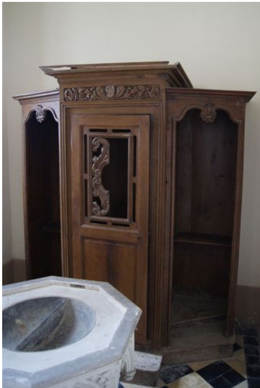
Confessionnal (chapelle des Fonts), 1ère moitié 19e siècle.