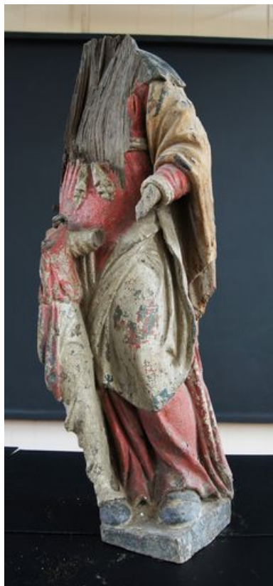
Groupe sculpté : Saint Joseph et l'Enfant(?), 16e siècle.

IVR22_20118000370NUCA