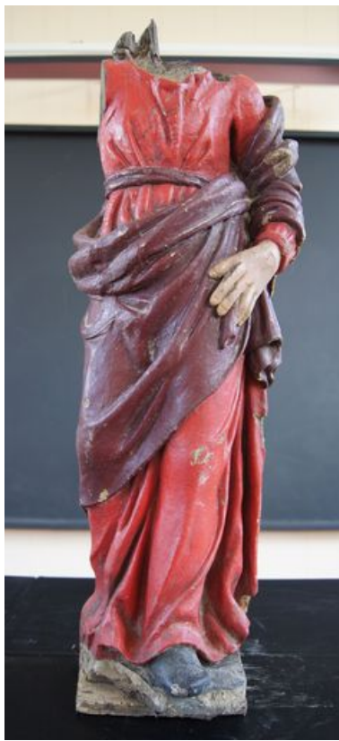
Statue : Saint Jean (?), 16e siècle. IVR22_20118000390NUCA

IVR22_20118000384NUCA