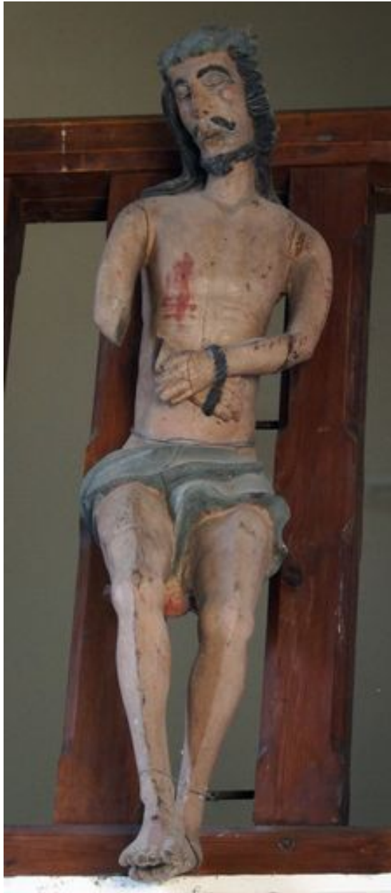
Ecce Homo, statue (petite nature), bois polychromé, 16e ou 17e siècle (garde-corps de la tribune).