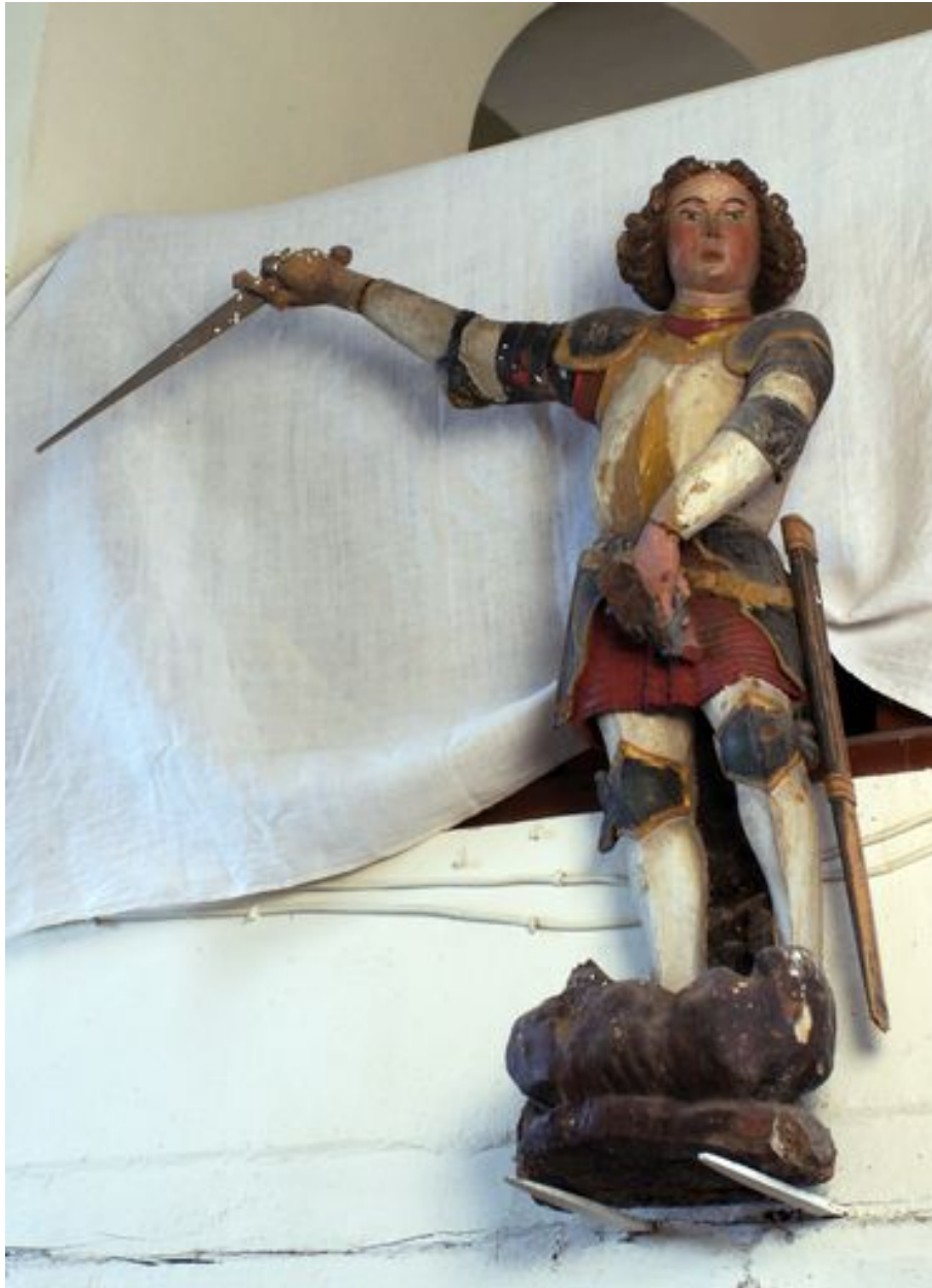
Saint Michel terrassant le démon, statue (petite nature), bois polychromé, 16e ou 17e siècle (garde-corps de la tribune).