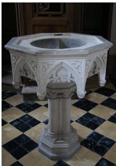
Fonts baptismaux (ouverts). IVR22_20118000376NUCA