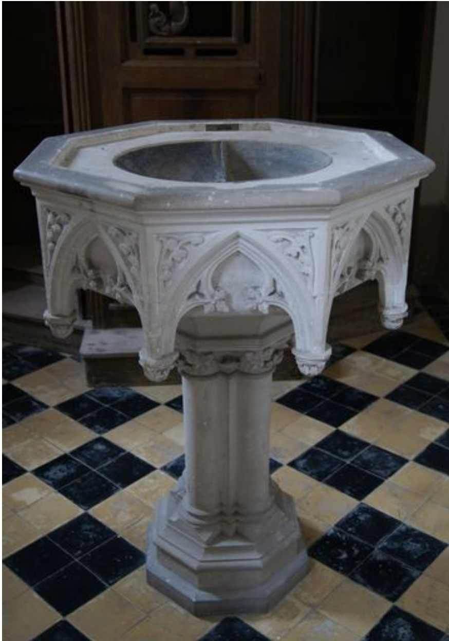
Fonts baptismaux (ouverts).