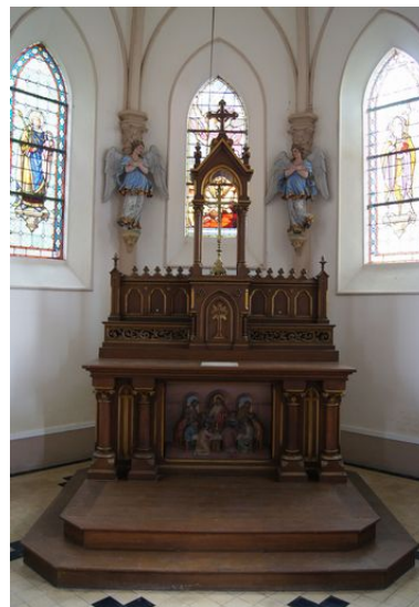
Maître-autel. IVR22_20118000372NUCA