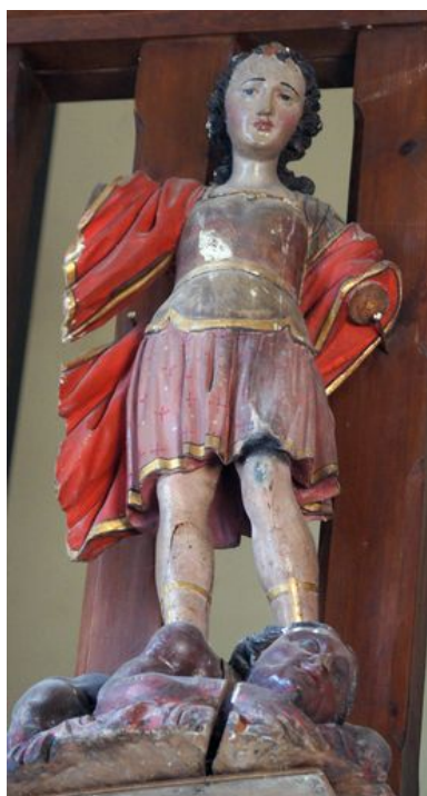
Saint Michel terrassant le démon, statue (petite nature), bois polychromé, 16e ou 17e siècle (garde-corps de la tribune).