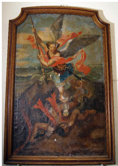
Tableau (tribune) : saint Michel terrassant le démon, 1753 (date portée), d'après Raphaël. IVR22_20118000355NUC2A