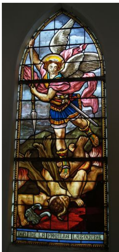
Verrière (baie 0) : saint Michel terrassant le démon, d'après Raphaël. Don de la famille Latouche.