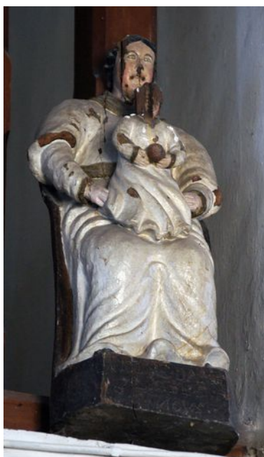
Vierge à l'enfant, dite Notre-Dame de la Joie, statue (petite nature), bois polychromé, 17e ou 18e siècle (garde-corps de la tribune). IVR22_20118000366NUCA