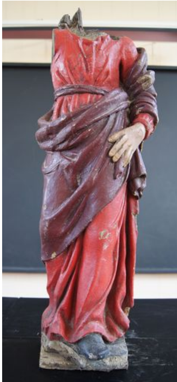
Statue : Saint Jean (?), 16e siècle.