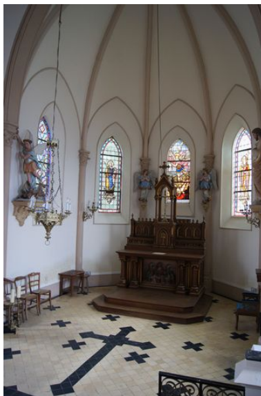
Vue du chœur. IVR22_20118000374NUCA