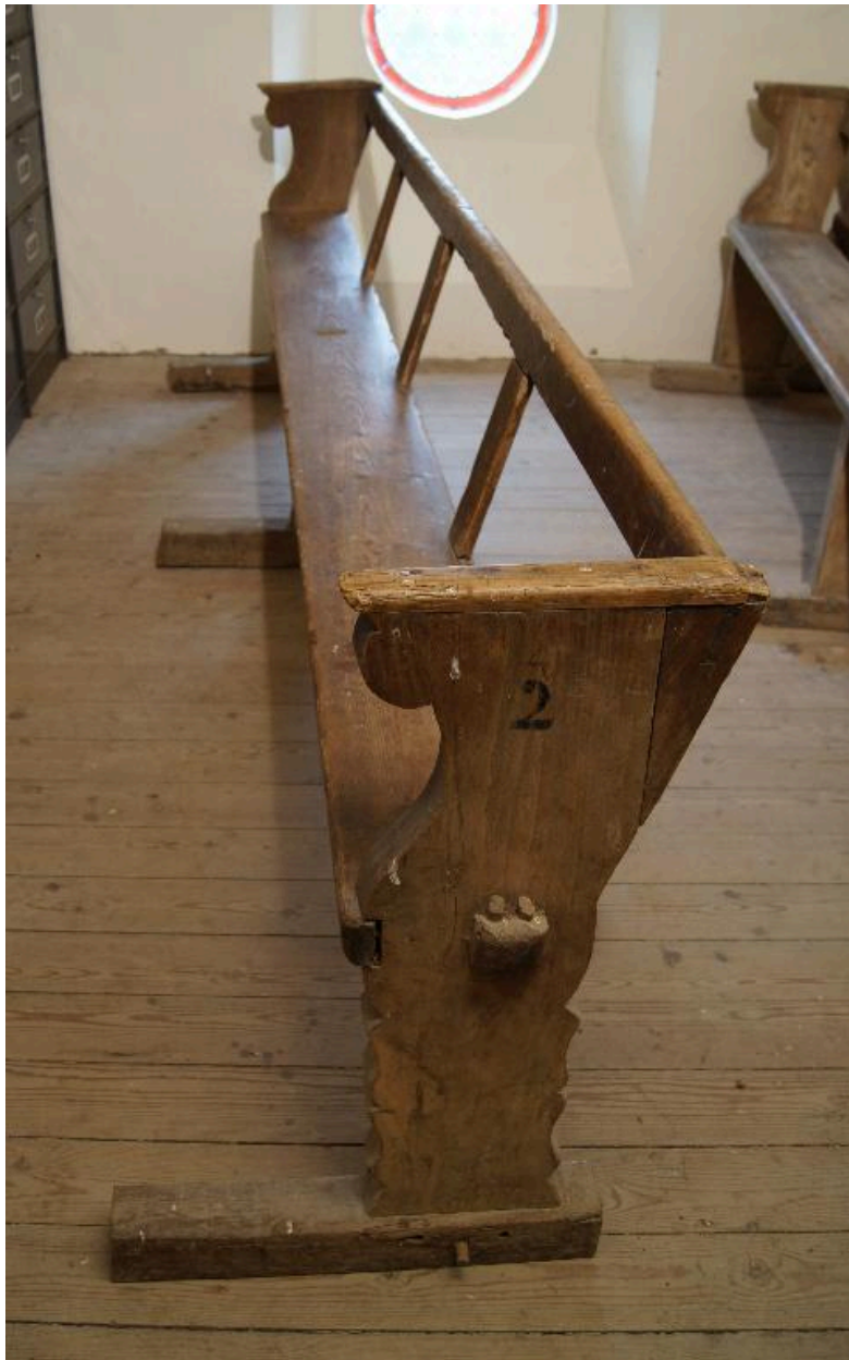
Banc, début 19e siècle (tribune).