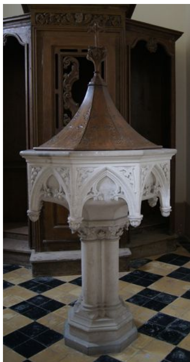
Fonts baptismaux, vers 1899. IVR22_20118000375NUCA