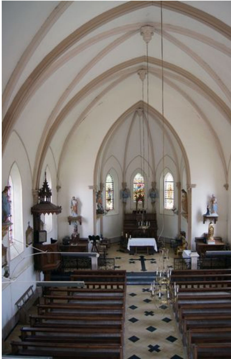
Vue intérieure vers le choeur.