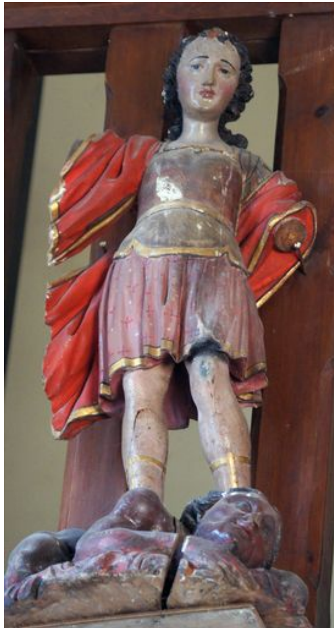
Saint Michel terrassant le démon, statue (petite nature), bois polychromé, 16e ou 17e siècle (garde-corps de la tribune).