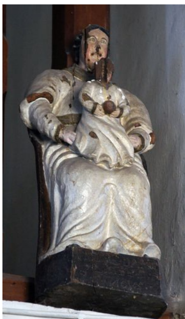
Vierge à l'enfant, dite Notre-Dame de la Joie, statue (petite nature), bois polychromé, 17e ou 18e siècle (garde-corps de la tribune). IVR22_20118000366NUCA