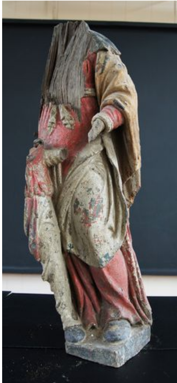
Groupe sculpté : Saint Joseph et l'Enfant(?), 16e siècle.