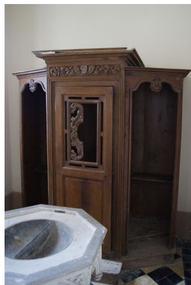
Confessionnal (chapelle des Fonts), 1ère moitié 19e siècle. IVR22_20118000377NUCA