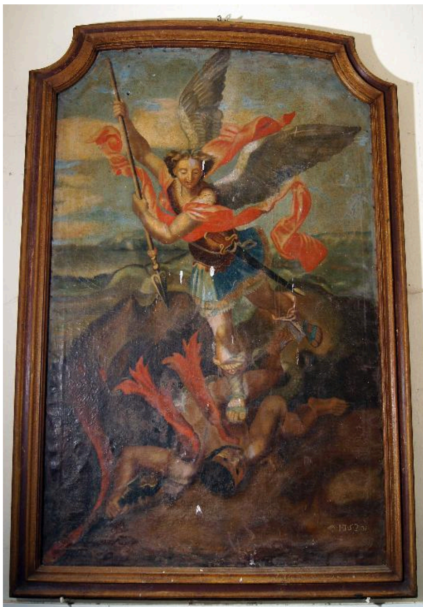
Tableau (tribune) : saint Michel terrassant le démon, 1753 (date portée), d'après Raphaël.