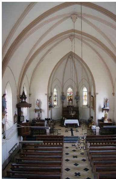
Vue intérieure vers le chœur. IVR22_20118000406NUCA