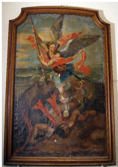
Tableau (tribune) : saint Michel terrassant le démon, 1753 (date portée), d'après Raphaël. IVR22_20118000355NUC2A