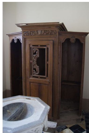
Confessionnal (chapelle des Fonts), 1ère moitié 19e siècle. IVR22_20118000377NUCA