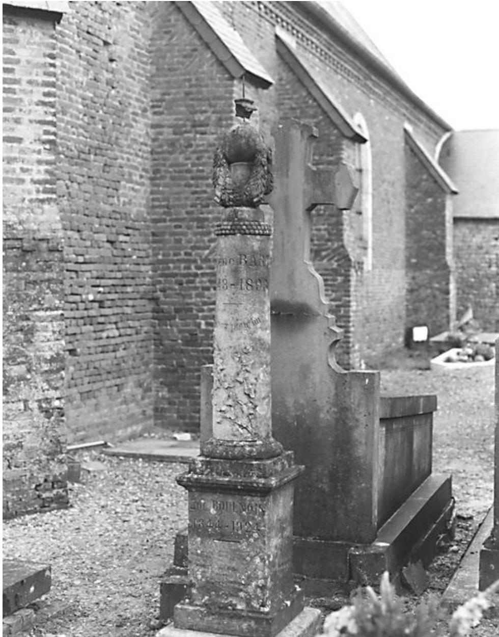
Cimetière : colonne funéraire d'Eugène Bodenois, 1893.