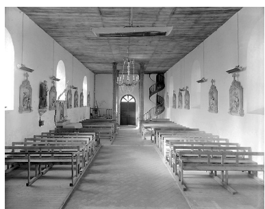
Vue intérieure du chœur vers la nef. IVR22_19970201859V