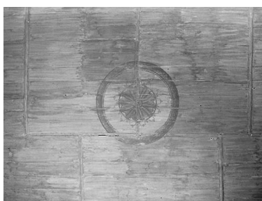
Détail du plafond peint du chœur. IVR22_19970202202X