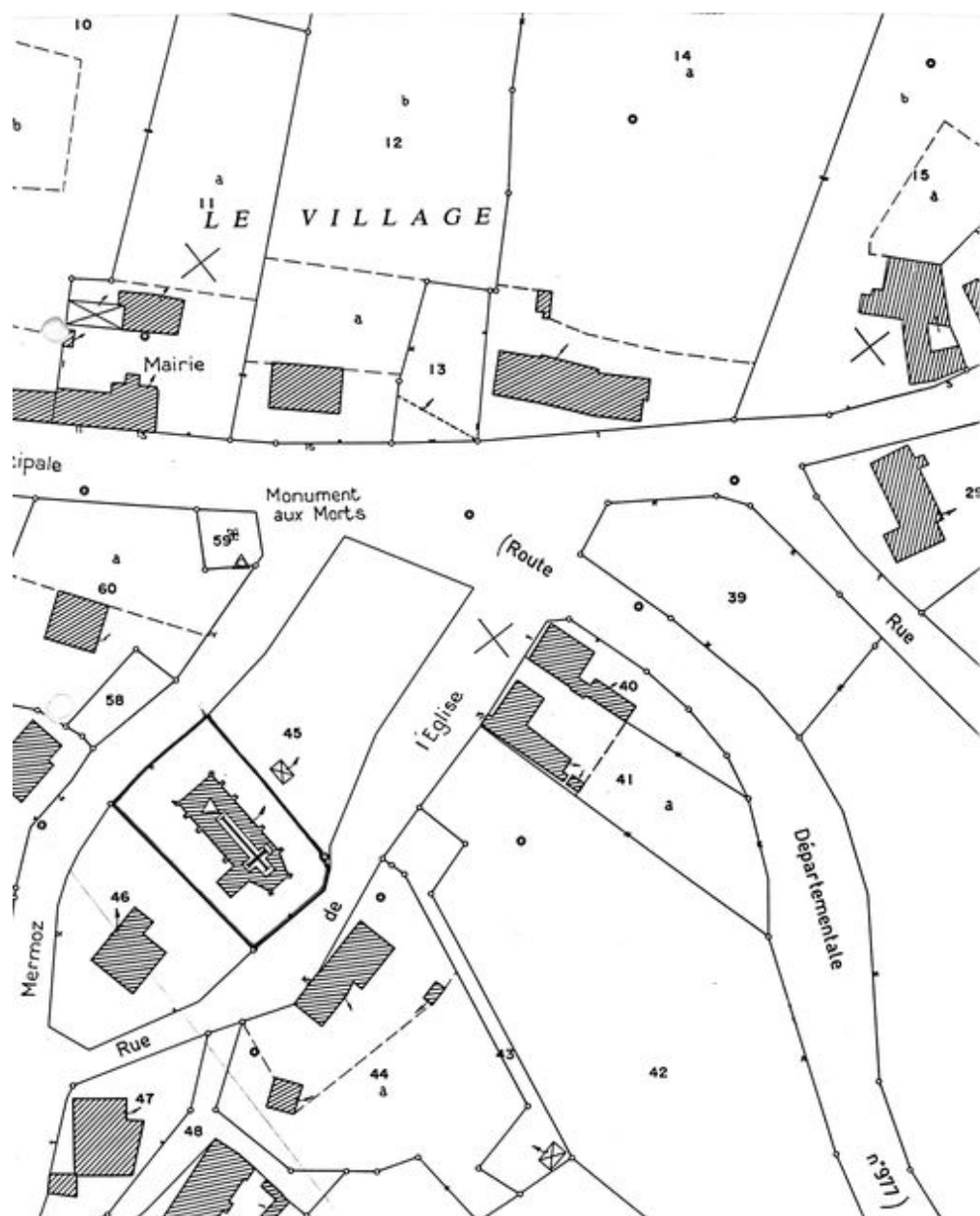
Plan de situation. Extrait du plan cadastral de 1986, section ZA.