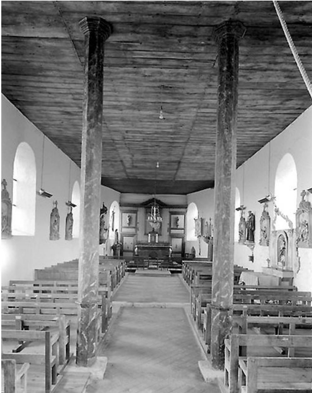
Vue intérieure de la nef vers le chœur.