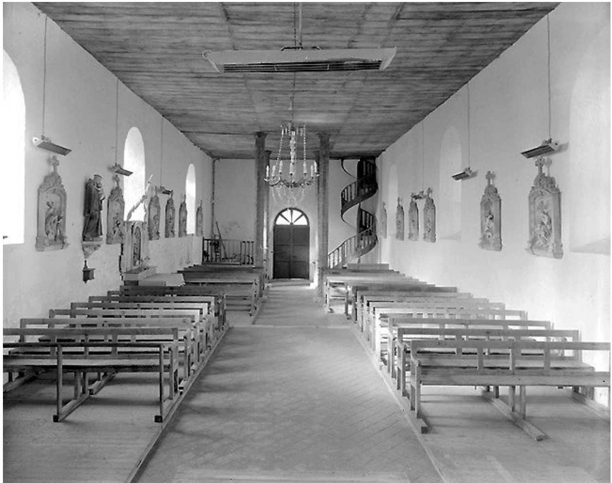
Vue intérieure du choeur vers la nef.