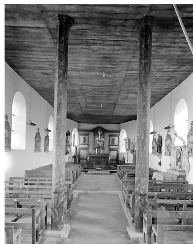
Vue intérieure de la nef vers le chœur. IVR22_19970201860V