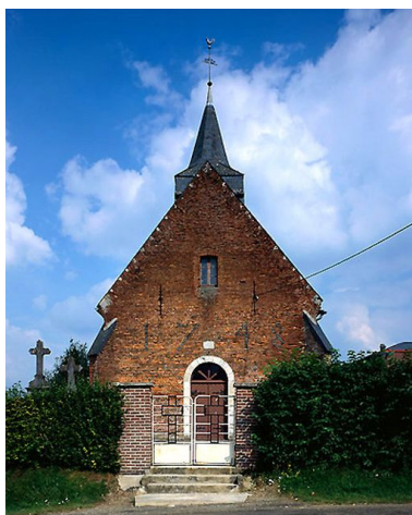
Façade occidentale. IVR22_19990204125VA