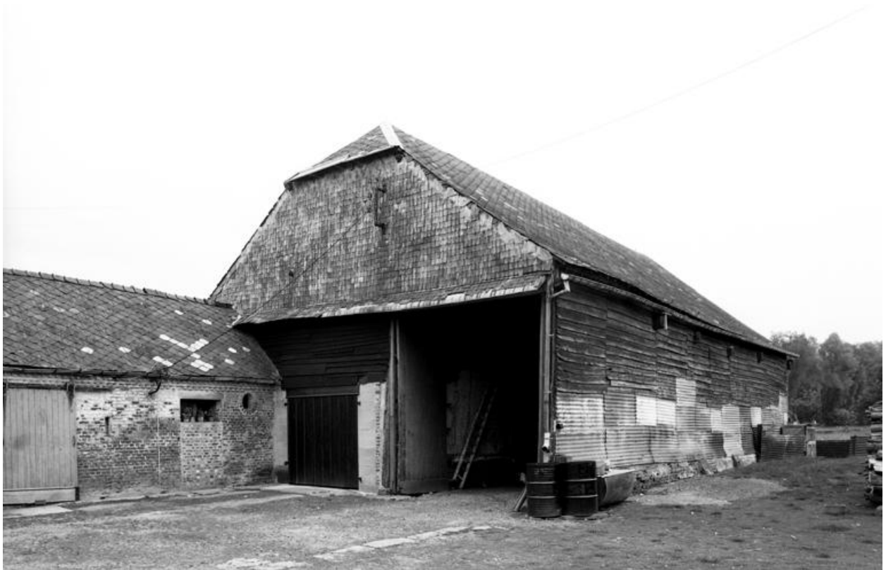
Vue d'ensemble de la grange, depuis le sud-est.