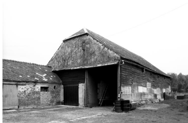
Vue d'ensemble de la grange, depuis le sud-est.