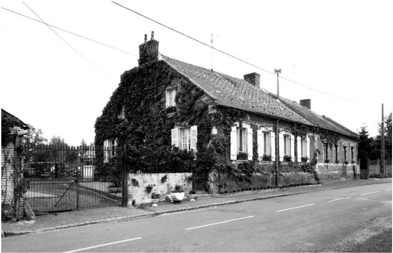
Vue d'ensemble du logis, depuis le sud-ouest.