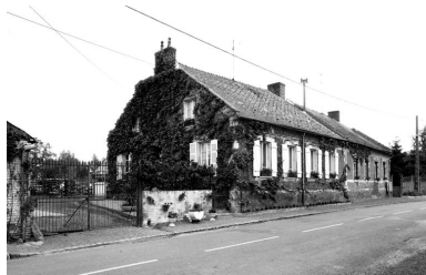
Vue d'ensemble du logis, depuis le sud-ouest. IVR22_19920201216Z